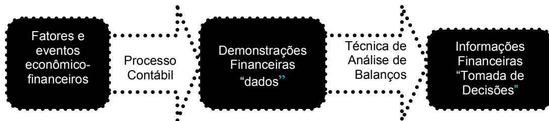
Figura 1 - Seqüência do Processo Contábil