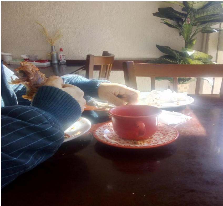
Cafeteria na Av. Rio Branco. Foto do arquivo pessoal, ano 2019.