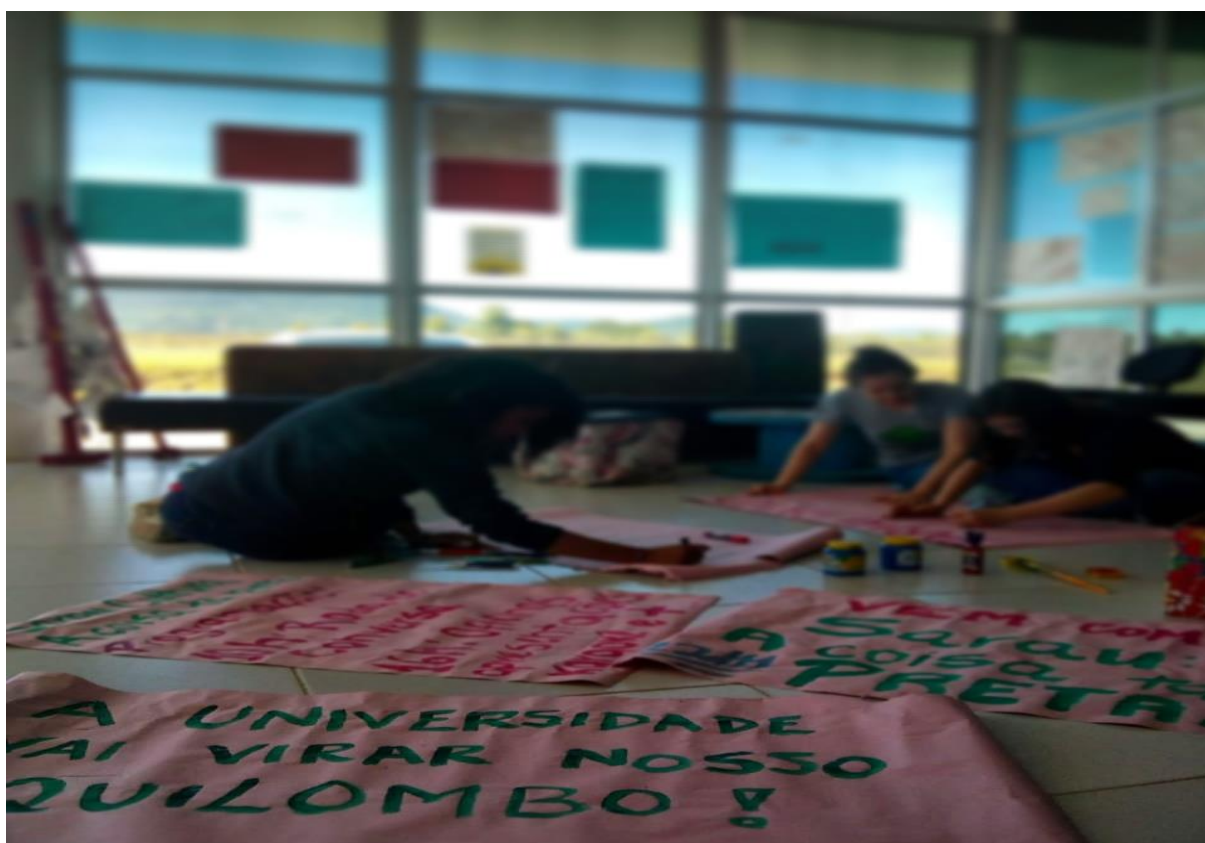
Hall do prédio de Terapia Ocupacional. Foto do arquivo pessoal, 2018.