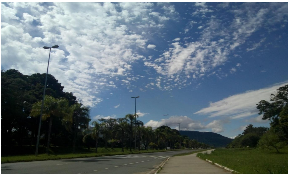
Av. Roraima, UFSM.