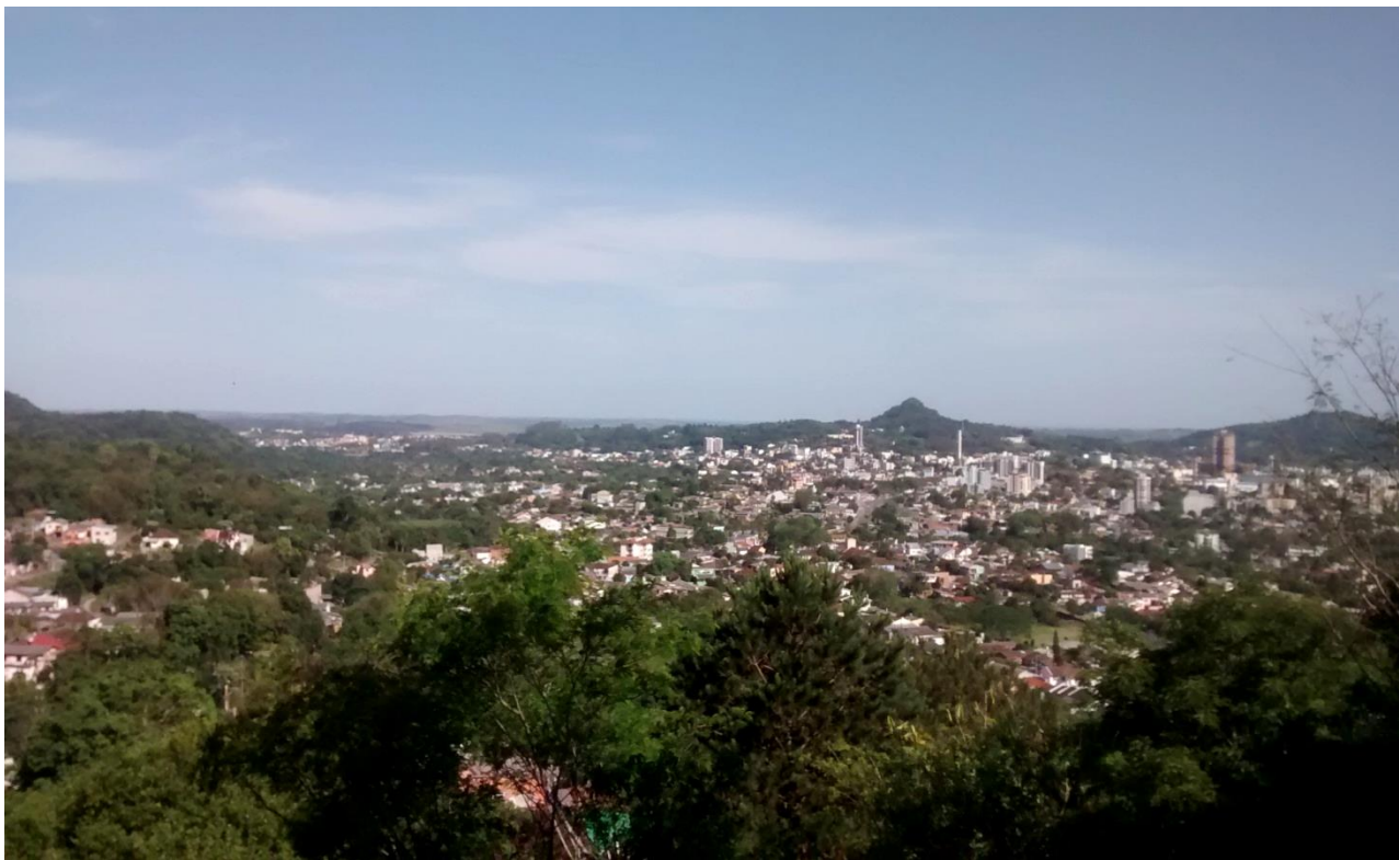
Vista do morro dos Ferroviários. Fotos do arquivo pessoal, ano 2017.