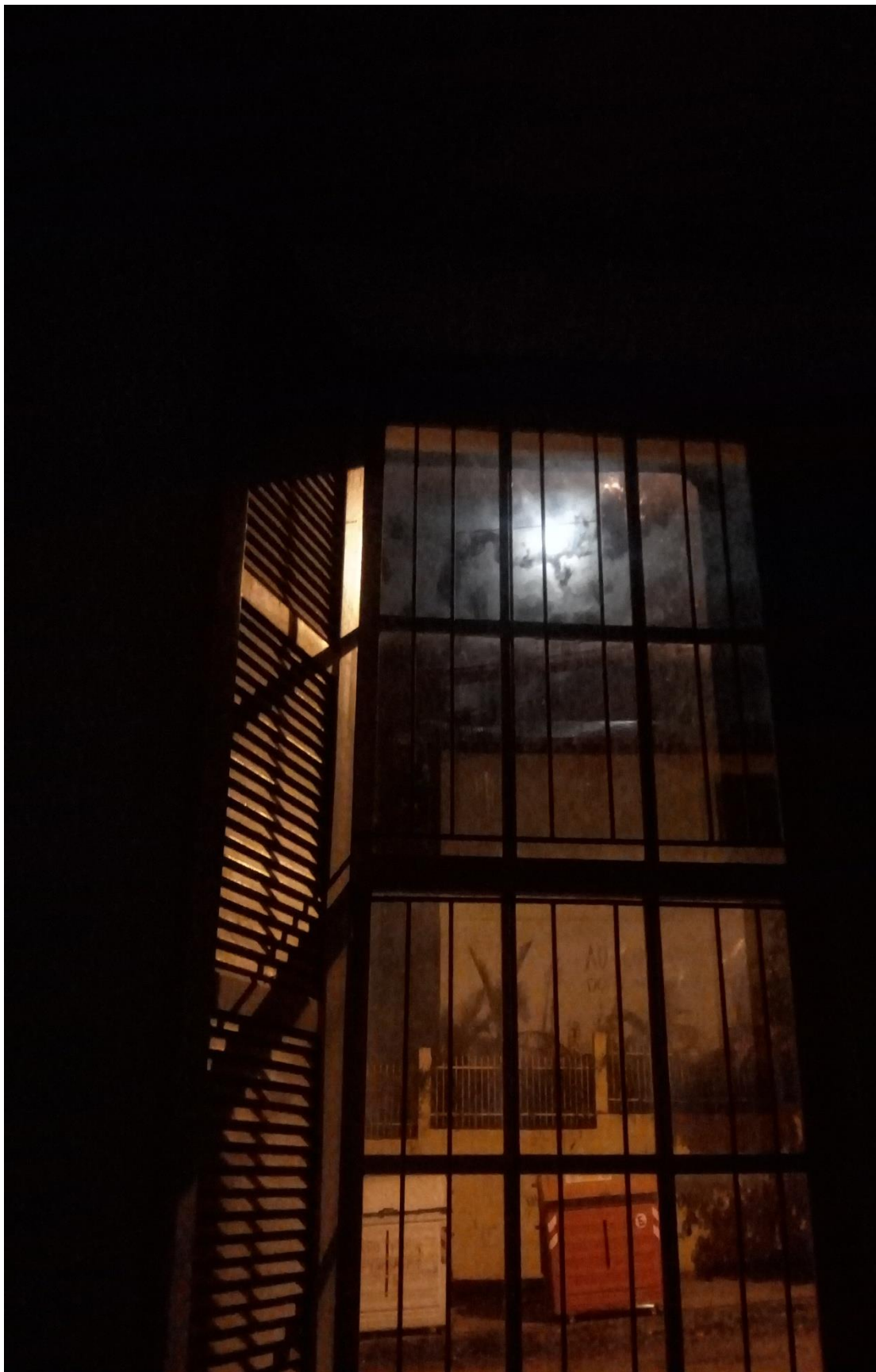
Janela no luar. Foto do arquivo pessoal, ano 2020.