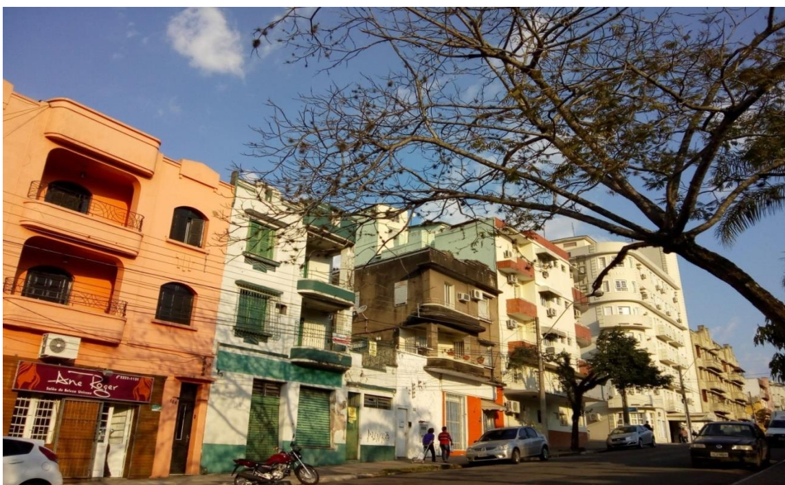
Av. Rio Branco.