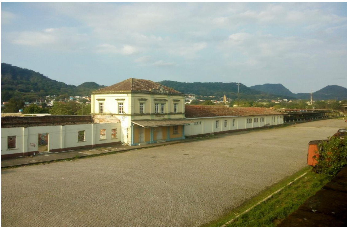
Gare da Estação. Foto do arquivo pessoal, ano 2020.