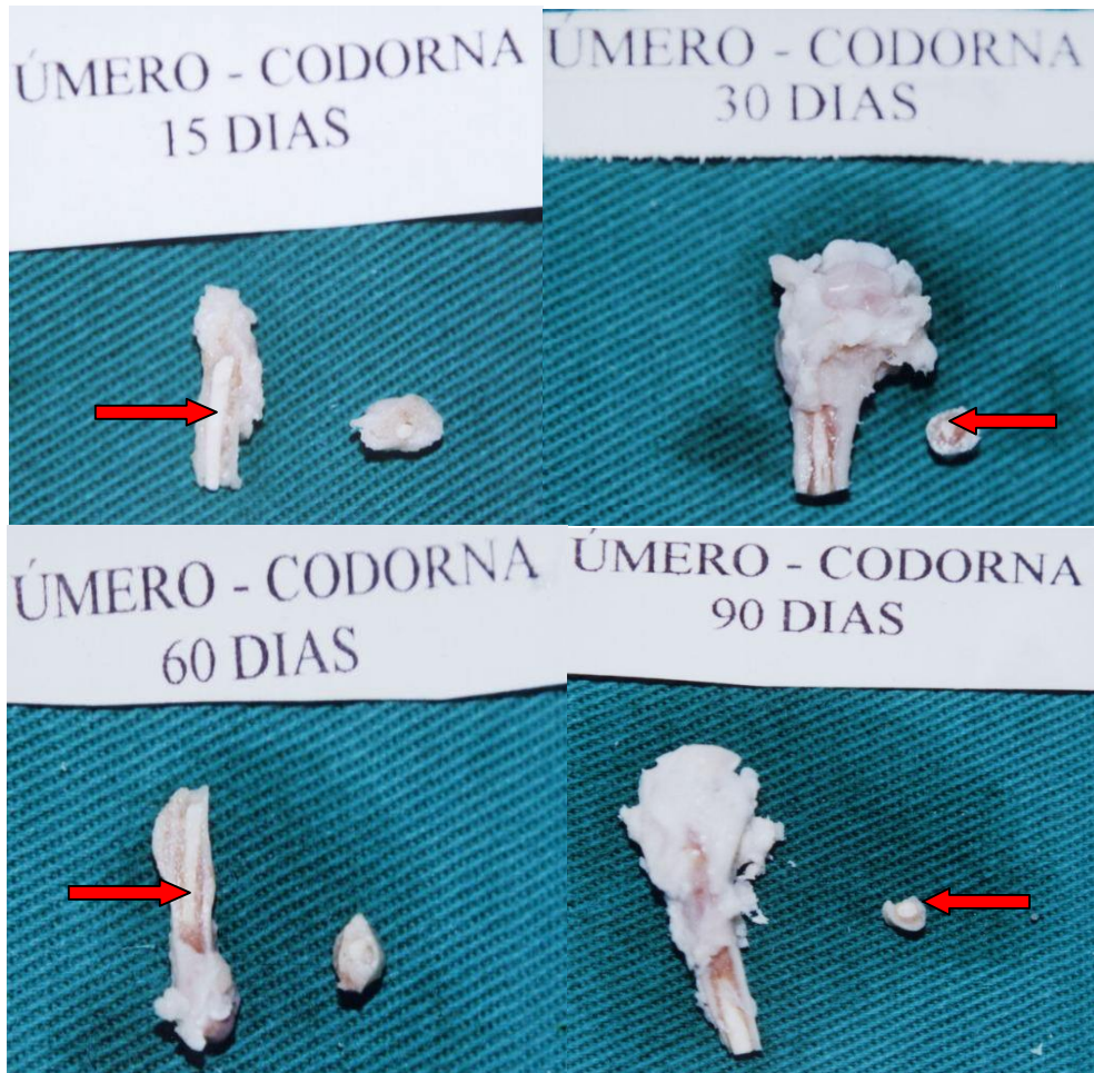
Figura 13 – Imagens fotográficas mostrando a seqüência da avaliação macroscópica, do úmero esquerdo de codornas domésticas ( Coturnix coturnix japonica ), submetidas ao implante da poliuretana de mamona ( Ricinus communis ). Notar a presença da poliuretana, dentro do seio medular, nos cortes longitudinais e transversais (setas), nos vários períodos de avaliação.

Durante o corte do osso juntamente com a resina, notou-se pequena alteração na consistência do pino pré-moldado, que se tornou menos resistente, fato esse constatado através da facilidade de se obter fatias do material com a utilização de uma lâmina de bisturi. MARIA et al. (2003) em estudo com cães submetidos ao implante na face medial da tíbia, observaram que ao corte longitudinal da tíbia, alguns implantes soltaram-se espontaneamente e os restantes foram facilmente retirados. Verificaram que as poliuretanas apresentavam aspecto semelhante ao inicial, sem irregularidades estruturais.