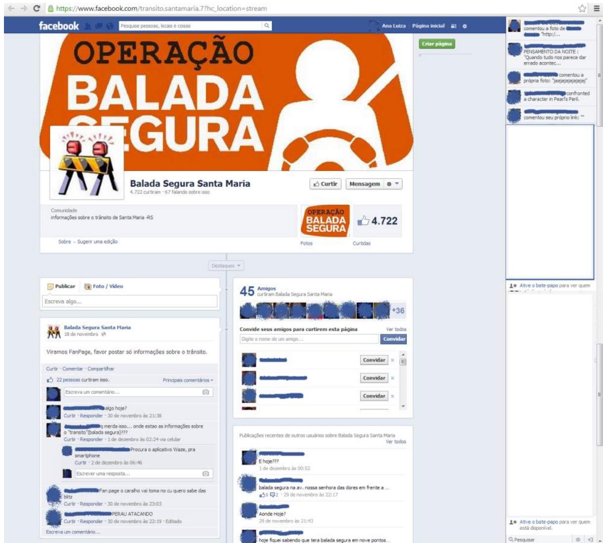
Figura 1 - Página do "Balada Segura Santa Maria" (FACEBOOK, 2013-a)

Observa-se que 4.722 (quatro mil setecentos e vinte e dois) usuários do Facebook curtiram a página, o que significa que sempre que alguém publicar na página, esses usuários receberão uma notificação com o conteúdo da mensagem. A estrutura dessa página é de fanpage , ou seja, os usuários da rede social devem "curtir" a página para receber as notificações. É diferente da estrutura de um grupo no Facebook , em que, para participar, o usuário deve ser adicionado por outro usuário, ou, em caso de grupo aberto, poderá adicionar-se, se assim desejar.