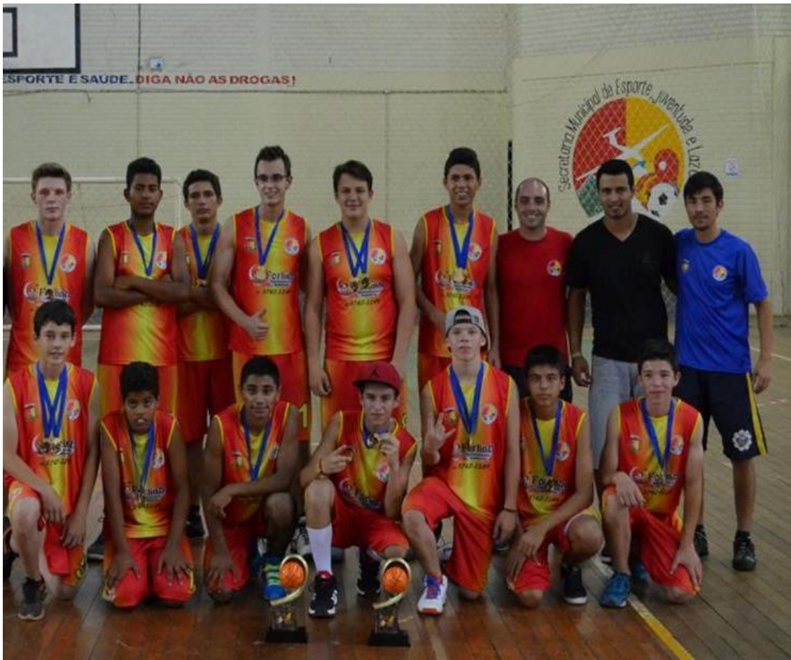
Figura 2- Alunos da Escolinha de Basquete de Palmeira das Missões

Após a criação desta secretaria foram executados vários programas e políticas públicas voltadas para o esporte. Uma delas sendo a Escolinha de Basquete de Palmeira das Missões fundada em 2013, este programa abrange toda a cidade com alunos 05 a 13 anos (em caráter de escolinha, ou seja, aprendizado) e 14 a 17 anos (Treinamento para Esporte de Rendimento). Atualmente conta com um total de 34 alunos que são o público alvo deste estudo. A escolinha conta com 02 professores de educação física remunerados pela prefeitura. Assim, na próxima seção, são apresentados os procedimentos metodológicos que balizarão a presente pesquisa.