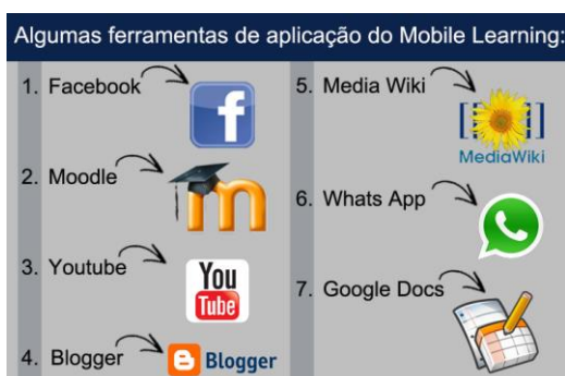
Figura 2 - Aplicação do m-learning

Nesse ponto foi elaborado um quadro (Figura 2) com uma lista de possíveis ferramentas de aplicação educacional.