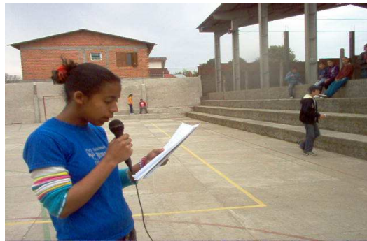
Figura 1 – Aluna da sétima série do E. Fundamental experimentando o recurso microfone

Na primeira etapa, com o objetivo de conhecer a linguagem do rádio e o uso correto do microfone, foi realizada uma palestra, ministrada por um profissional de uma rádio da cidade, na escola para todos os alunos, professores, supervisão e direção da escola. Outras atividades foram realizadas na escola. Em tais atividades, os alunos puderam utilizar o microfone e aprender algumas instruções relativas ao uso desse importante equipamento de comunicação, como se observa na Figura 1.