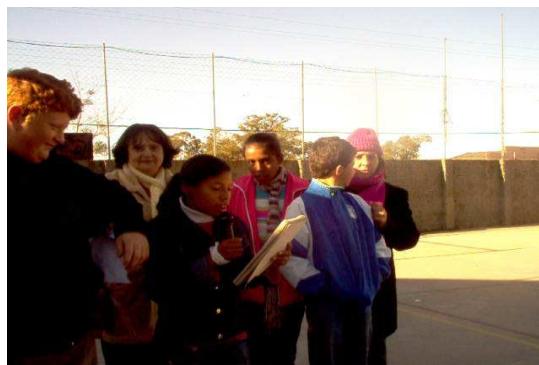
Figura 2 - Alunos colaboradores e professores coordenadores

Na segunda etapa, formou-se uma equipe, composta por três alunos colaboradores e dois professores que desempenhavam a função de coordenadores das atividades de planejamento, supervisão e execução das pautas das programações da rádio, conforme Figura 2.