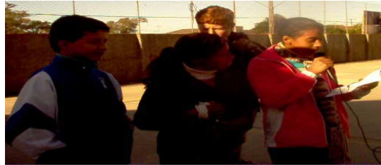
Figura 4 - Grupo de alunos realizando a apresentação de um programa da rádio.

Nessa etapa, até cinco alunos eram convidados e faziam a apresentação prevista.