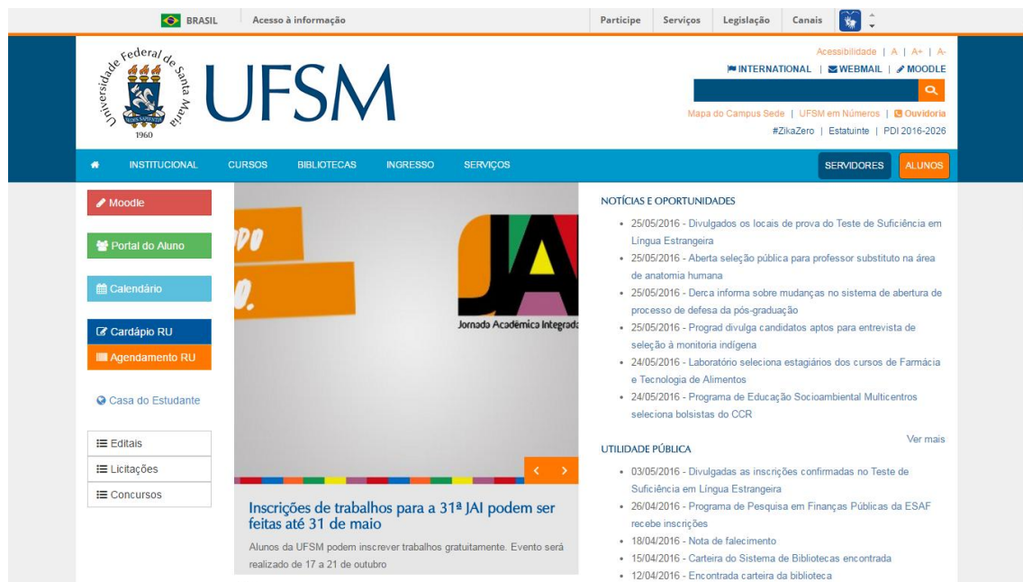
Figura 8-PrintScreen da sessão alunos do portal da UFMSM