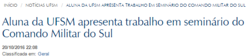
Figura 1- PrintScreen do portal da UFSM

Assim, pela característica dos fluxos de comunicação que atravessam os meios institucionais é que muitas vezes as estratégias ou ações de comunicação acabam não seguindo os preceitos da comunicação pública. O fato das assessorias já receberem textos prontos e a dificuldade e falta de profissionais que investiguem as informações, faz com que algumas das notícias contenham um conteúdo de viés privado. A seguir, alguns prints que fazem referência a notícias postadas nos portais da UFSM, UFRGS e IFFar.