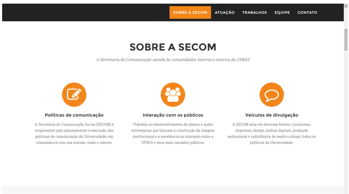
Figura 13-PrintScreen da SECOM no portal da UFRGS

Nesse primeiro contato com a página da SECOM- UFRGS é possível perceber a estrutura bem organizada das informações básicas ao qual a secretaria de comunicação é responsável, tal como o que é a SECOM, quais são as áreas de atuação, quem é a equipe responsável e meios de contato que possam interessar aos públicos.