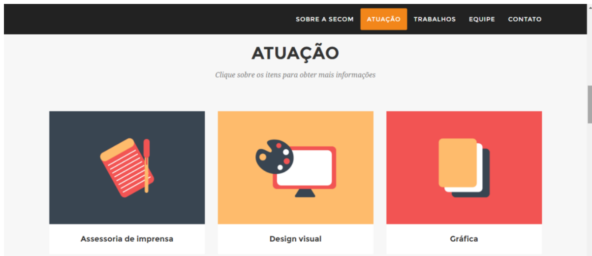
Figura 14- PrintScreen da SECOM no portal da UFRGS