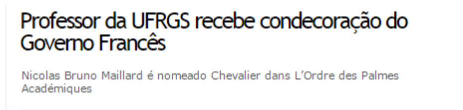
Figura 2- PrintScreen do portal da UFRGS