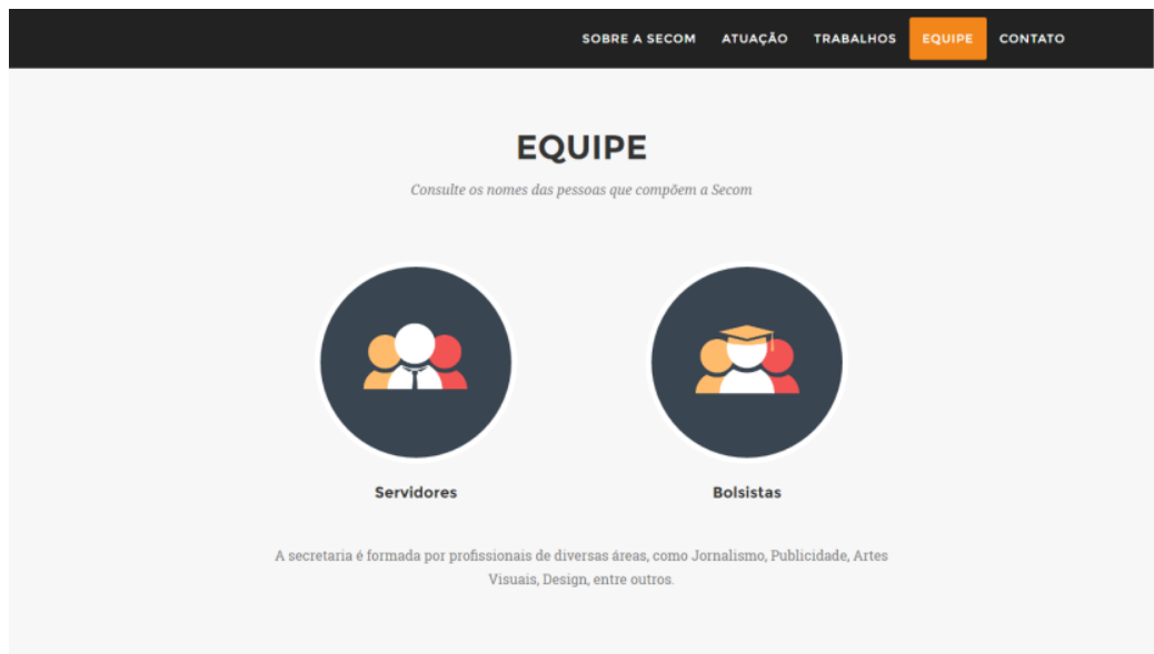
Figura 16-PrintScreen da SECOM no portal da UFRGS