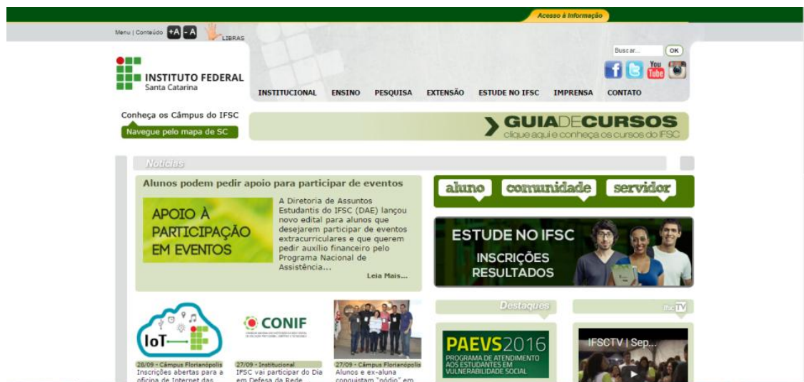
Figura 19-PrintScreen do portal do IFSC

Em depoimento 55 dos comunicadores do Instituto, os canais de comunicação por serem novos, ainda não possuem um planejamento específico. Por esse motivo, muito do que é publicado em um canal acaba sendo compartilhado com as outras mídias, sem muita diferenciação. O fato de cada campi possuir um espaço separado é apontado como um complicador, pois descentraliza as informações e também a imagem do Instituto com uma instituição ao qual os campi fazem parte. O IFSC, por exemplo, não possui uma aba para cada campus, mas sim um único canal que centraliza os acontecimentos.