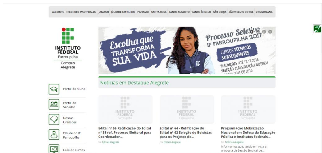
Figura 18-PrintScreen do portal da IFFar- Alegrete

Seguindo a linha da dimensão instrumental, o portal do IFFar é utilizado como um meio de se comunicar com o público interno e com a comunidade externa. Informativo, procura construir sua base institucional por meio de matérias que visem os acontecimentos dos campi, como eventos, pesquisas, processos seletivos. O principal diferencial do Instituto com relação ao portal da UFSM e UFRGS é que ele é dividido por seções que representam cada um dos 11 campi, a página inicial representa a Reitoria apresentando notícias que agregam a Instituição como um todo. Nesse sentido, o portal acaba descentralizando as informações de acordo com o interesse dos públicos.