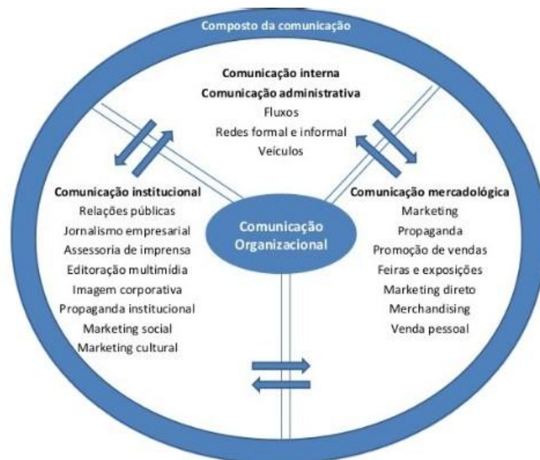
Figura 5-Esquema da Comunicação Integrada

Kunsh (2003) destaca que apesar das peculiaridades de cada área é importante para organização que a comunicação forme uma unidade harmoniosa, integrando suas atividades com base em uma política global definida, que perpassa a missão, visão, valores e objetivos da empresa, tornando, assim, as ações comunicacionais mais estratégicas, táticas e eficazes. A autora termina descrevendo que através do mix da comunicação – intervenção integrada das modalidades e profissionais de comunicação – as organizações atraem a possibilidade de estreitarem seus relacionamentos com os públicos de interesse e também com a sociedade, salientando a sua importância. “Em síntese, constitui uma somatória dos serviços de comunicação feitos, sinergicamente por uma ou várias organizações e tendo em vista, sobretudo os públicos a serem atingidos.” (KUNSCH, 1986, p. 113). Esse composto da comunicação integrada é ilustrado da seguinte maneira: