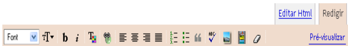
Figura 2 – Formatação das Mensagens

A partir deste momento o usuário poderá escrever mensagens, formatar texto escolhendo tamanho, tipo, cor, alinhamento de letra, inserir hiperligações para outro site, inserir imagens e vídeos sendo processo simples e intuitivo. Clicando no ícone da barra de tarefas (Figura 2) aparecerá uma janela para proceder ao envio (upload) da mensagem (post) do blog.