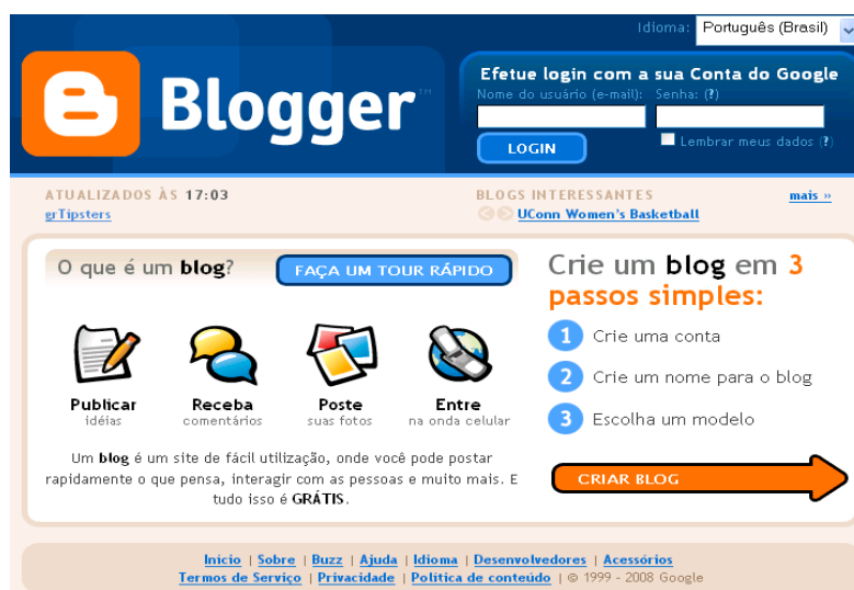
Figura 1 – Tela para criação do Blog

Neste contexto, foi desenvolvido como alternativa pedagógica à reestruturação da Escola a ferramenta Blog, a qual buscou integrar cooperativamente professores, alunos, funcionários e equipe diretiva. A ferramenta foi desenvolvida nas seguintes etapas: criação de um endereço eletrônico ( www.blogger.com ); escolha do nome e, criação da interface gráfica. A Figura 1 apresenta a tela inicial de criação do blog.