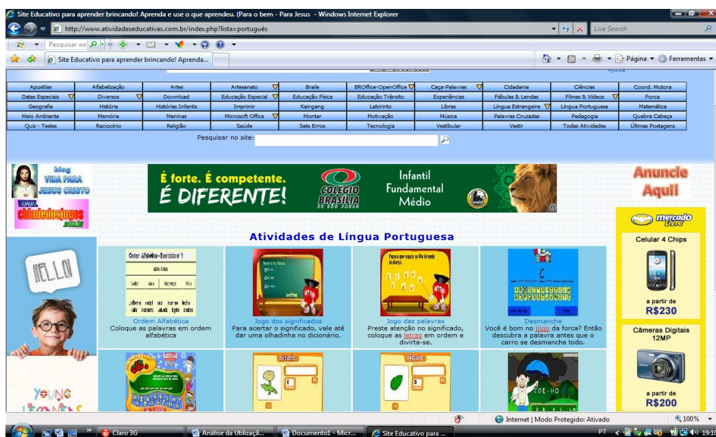
Figura 3 – Interface do site Atividades Educativas

O planejamento das atividades a serem desenvolvidas na sala de informática, a escolha dos sites e jogos educativos, se faz em parceria entre o professor da sala de informática e o regente da turma. Ao trabalhar os jogos buscam-se atividades que de fato auxiliem a aprendizagem dos alunos e, venham a sanar as dificuldades que estes apresentam em sala de aula.