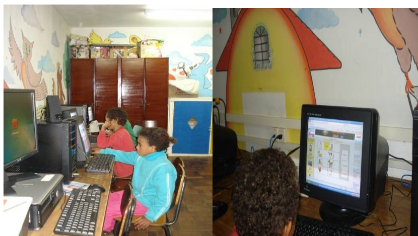
Figura 2 - Atividades de Investigação com os alunos na Sala de Informática

atividades propostas nos jogos, e demonstram facilidade, interesse e autonomia em sua execução. Às queixas, reclamações e/ou dificuldades encontradas, como estes destacaram, recaem no tempo de carregamento dos jogos, e não na execução do desafio proposto pelo mesmo. Assim, percebe-se que a motivação e o interesse superam as possíveis dificuldades, pois os alunos, objetos da pesquisa, não possuem “medo” em mexer na máquina (computador), como pode ser observado na Figura 2, estes não desistem e vão a cada clique descobrindo mais possibilidades, construindo o seu aprendizado com autonomia, de forma lúdica e prazerosa.