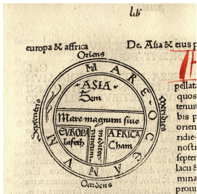
Fig. 1: Mapa do mundo, St. Isidoro (560-636), bispo de Sevilha. Biblioteca Geral da Universidade de Coimbra