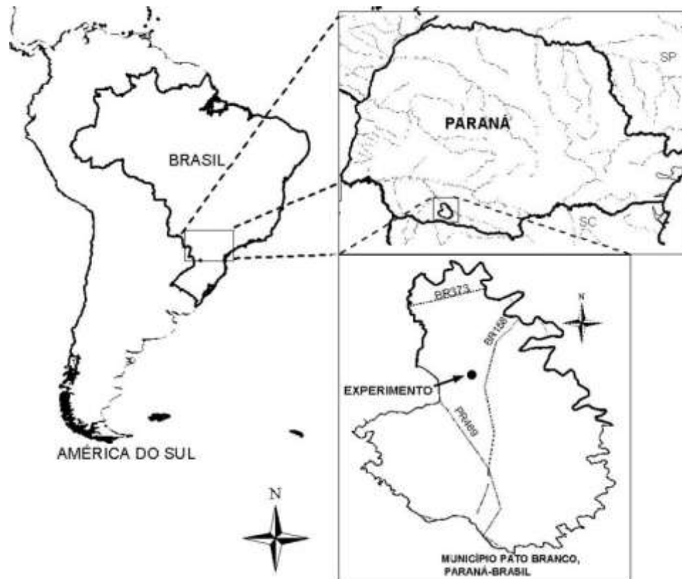
Figura 2– Localização do experimento na Estação Experimental do IAPAR, na região Sudoeste do Paraná (CALEGARI, 2006).