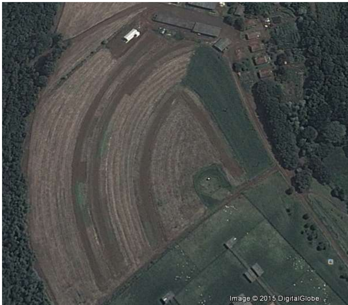
Figura 3– Visão geral da localização do experimento instalado na Estação Experimental do IAPAR, região Sudoeste do Paraná.

A área experimental foi coberta por Mata Atlântica até 1976, ano em que foi derrubada, dando lugar às culturas de verão: milho ( Zea mays L.) e feijão ( Phaseolus vulgaris L.), cultivadas sob sistema cultivo convencional (SCC). Durante 10 anos, em toda a área, o solo foi preparado com uma aração e duas gradagens leves, sempre antes de cada cultivo. A partir do inverno de 1986, a área foi dividida em três blocos com dois sistemas de manejo (sistema plantio direto (SPD) e SCC) e 36 parcelas, das quais, no presente trabalho foram utilizadas 24 parcelas.