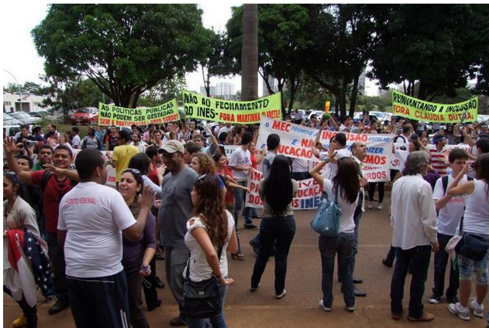
Figura 4: O Movimento surdo lutando pela educação bilíngue, em Maio/2011, com mais de quatro mil pessoas..

Posso garantir que as tecnologias assumiram um papel central e talvez revolucionário nos movimentos surdos na contemporaneidade, pois ajudou a mobilizar uma grande força política enquanto ferramenta de luta. Vale lembrar que o maior objetivo do movimento surdo é a educação de surdo. O movimento surdo explora a liderança dos manifestantes e negocia com a Cultura surda, além de explorar as tecnologias como ferramenta de mobilização. Aproveito as palavras do Du Gay: