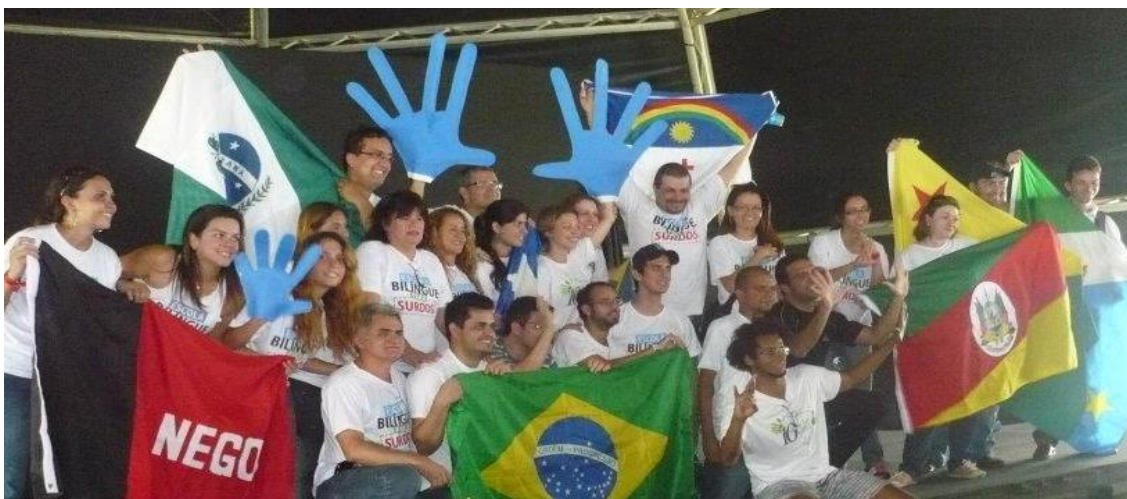
Figura 5: Movimento Surdo nos dez anos da Lei 10.436 em Brasília, 24/04/2012.

Outro exemplo do alcance e da importância das redes sociais na organização dos movimentos surdos foi a organização do movimento festivo em comemoração aos dez anos da oficialização da lei de Libras, em abril de 2012. A organização do movimento dos dez anos da lei Libras foi mobilizada nas redes sociais pelos líderes surdos e ouvintes em todo Brasil e teve como objetivo entregar as propostas para a Educação Bilíngue aos surdos à Casa Civil.