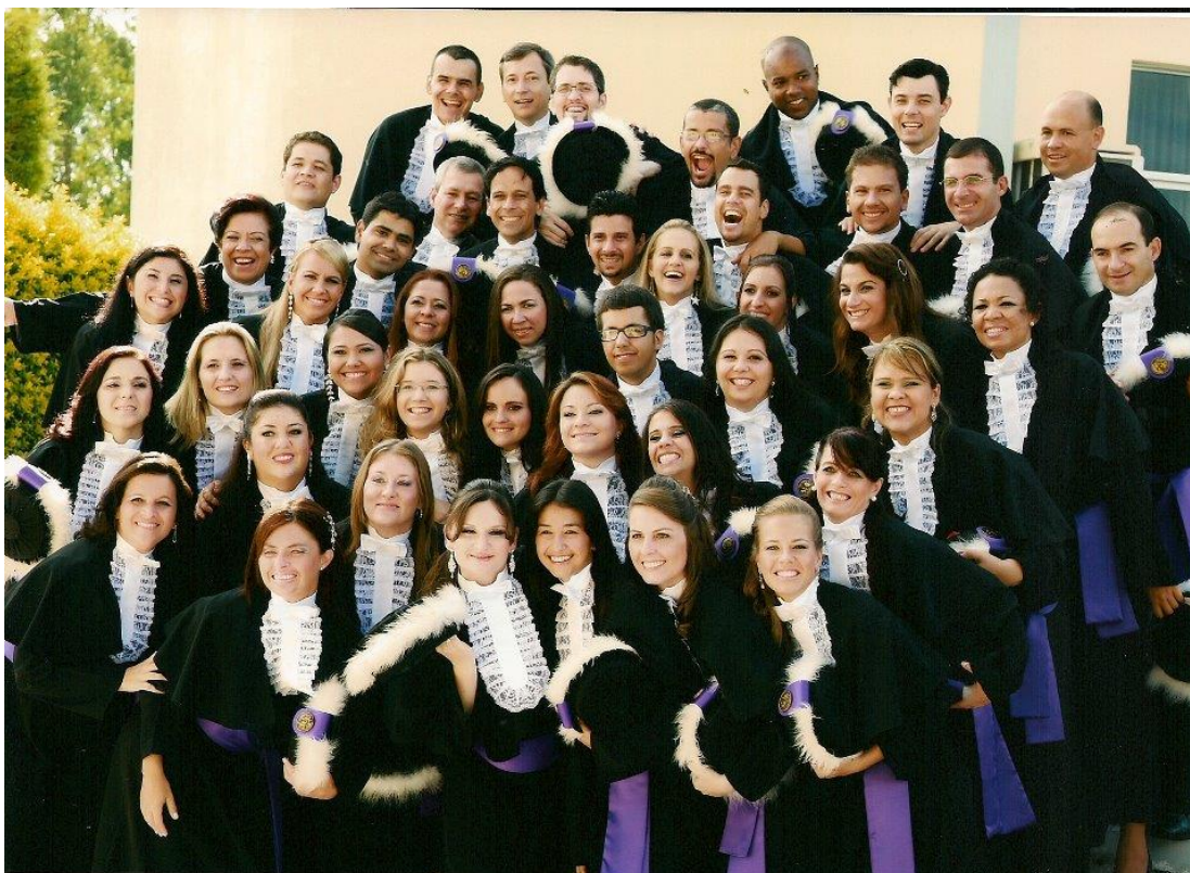
Figura 1: Primeira turma de Letras/Libras 2006 – Pólo UFSM

Há, também, o curso de graduação em Letras/Libras na modalidade presencial na UFSC. Já foram realizados quatros vestibulares e atualmente conta com o curso de bacharelado e de licenciatura. Eu sou testemunha que o curso de Letras/Libras foi muito importante para os surdos, pois muitos tiveram a oportunidade de aprender aspectos da estrutura da Libras como, por exemplo, a gramática dessa língua. E os alunos dessa forma sentem-se mais preparados para exercer a função de professor de Libras. Segundo Strobel, (2008),