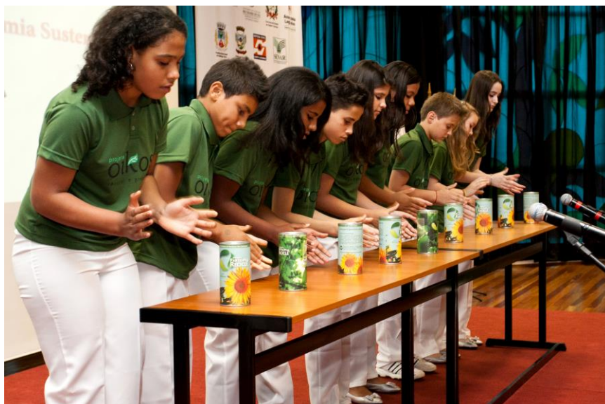
Foto 08: Apresentação do Grupo Especial no Congresso Internacional Responsabilidade e Reciprocidade, no Auditório da AMF (2011).

Foi apresentada ainda a peça “Querência Amada” do compositor Teixeira, executada por um aluno tocando acordeon, acompanhado de flautas e violões; Asa Branca de Luiz Gonzaga, em que foi trabalhado, antecipadamente, o significado da letra e as dificuldades enfrentadas pelo povo nordestino e um trecho da Nona Sinfonia de Beethoven em que se trabalhou também o repertório erudito. Segue anexo, a este projeto de pesquisa, um vídeo com trecho dessa apresentação (Apêndice C).