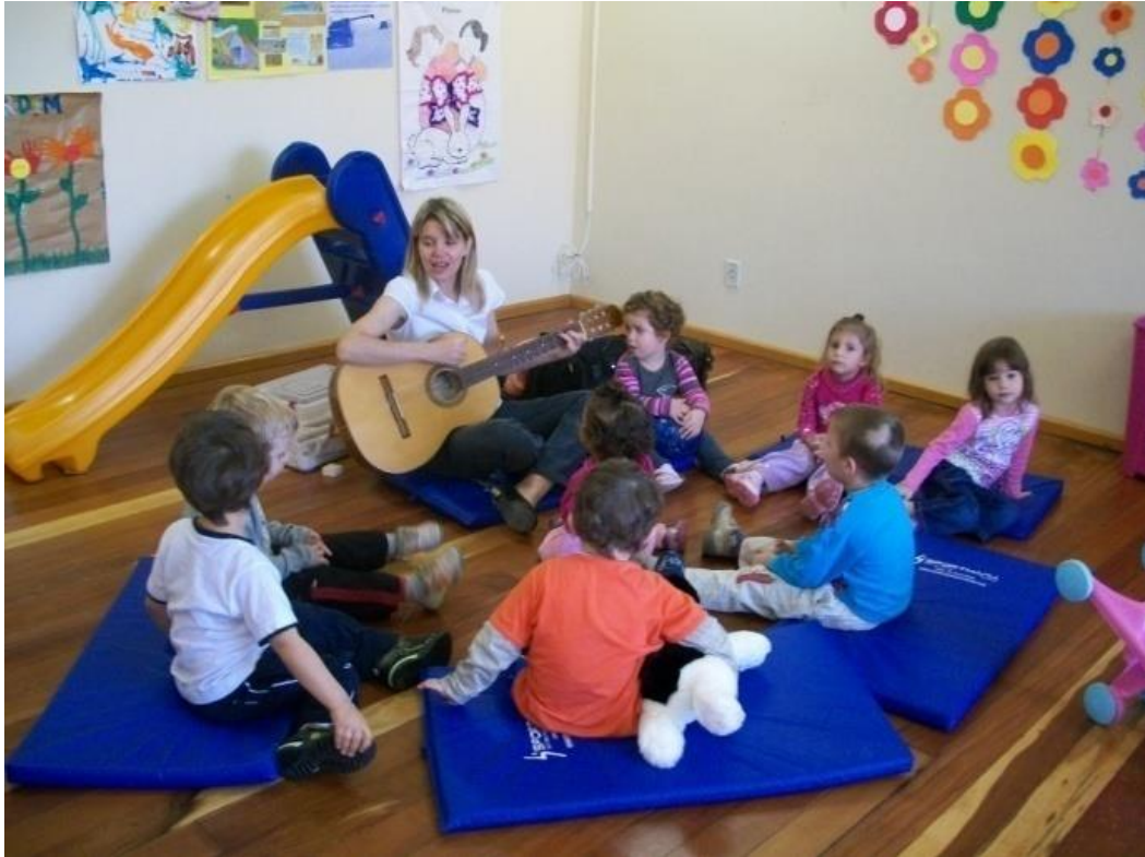
Foto 2: Alunos do Projeto Flauta, educação infantil – maternal II, em aula (2009).