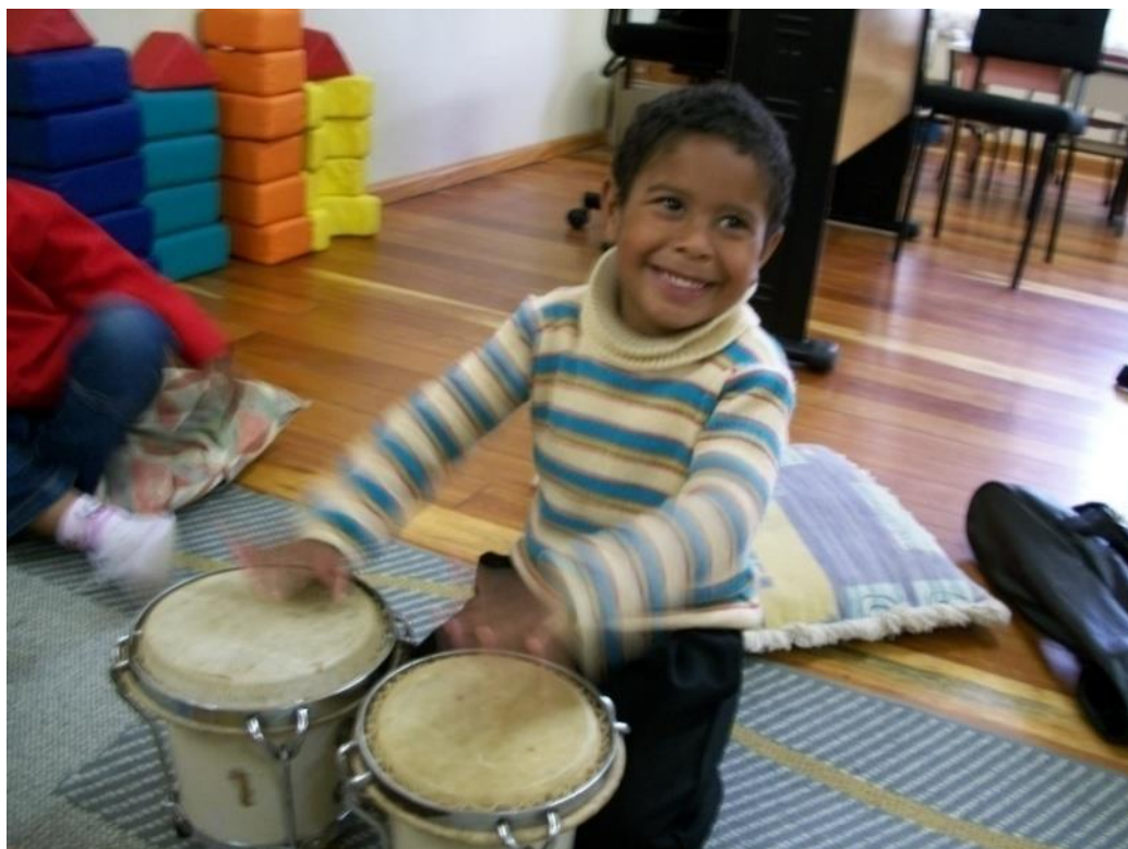
Foto 4: Aluno do Projeto Flauta, educação infantil – pré A, em aula (2009).

No primeiro ano do Projeto Flauta, em 2009, além das aulas de musicalização infantil eu acompanhava um professor que atuava com os alunos do ensino fundamental, anos iniciais, na época, ainda chamado de 1ª a 4ª série. Assistia às aulas e, às vezes, realizava atividades com as crianças dessas séries. A partir do mês de março de 2010, assumi também as aulas das escolas de ensino fundamental e mais uma escola passou a integrar o grupo de escolas atendidas pelo Projeto Flauta, a Escola Municipal de Educação Infantil Beija-Flor, do Distrito de Vale Vêneto, localidade vizinha ao Distrito Recanto Maestro. Com isso, o número de crianças integrantes do projeto ampliou para 140, e, em 2011, para 147. Muitos pais que antes matriculavam os seus filhos na escola estadual quando esses deixavam a educação infantil, passaram a matricular nas escolas do município, relatando que queriam que seus filhos continuassem integrando o Projeto Flauta.