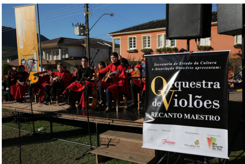
Foto 11: Apresentação do Grupo Especial em parceria com a Orquestra de Violões Recanto Maestro, no Festival de Inverno da UFSM, 2013.

O Grupo Especial realizou, junto com a Orquestra de Violões Recanto Maestro (projeto aprovado em 2012 pela LIC – Lei de Incentivo à Cultura do Rio Grande do Sul), uma apresentação no XXVIII Festival, no dia 04 de agosto de 2013. Esse festival promovido pela UFSM representa muito para a vida das crianças e jovens da região da Quarta Colônia, em especial para o município de São João do Polêsine, distrito de Vale Vêneto, que é o local sede do festival. Todo o ano a localidade recebe grandes músicos nacionais e internacionais, desse modo os concertos são de altíssima qualidade e os professores que vem ministrar os cursos e oficinas são de máxima excelência. As crianças e jovens acabam usufruindo direta ou indiretamente desses eventos, seja fazendo os cursos ou assistindo aos concertos e os estudantes do Grupo Especial, participam das apresentações.