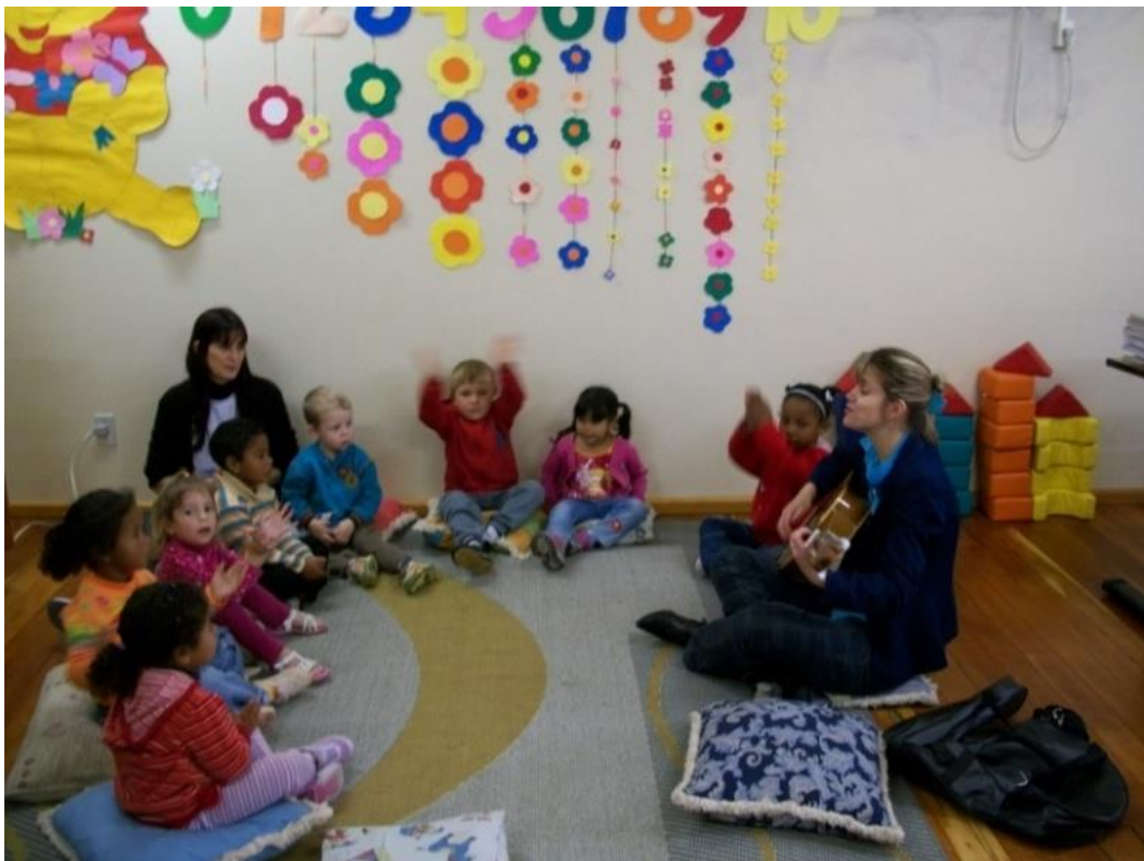
Foto 3: Alunos do Projeto Flauta, educação infantil – pré A, em aula (2009).