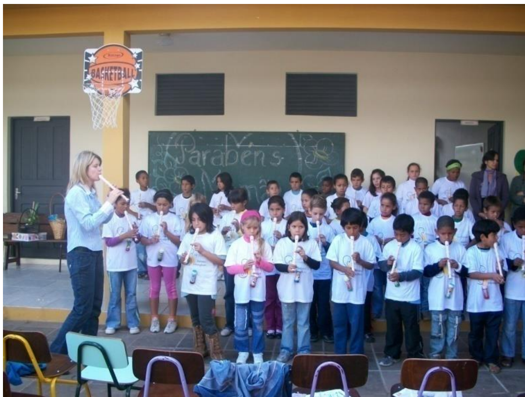
Foto 6: Alunos do Projeto Flauta (Ensino Fundamental – 3º e 4º anos) em apresentação para os pais (2011).