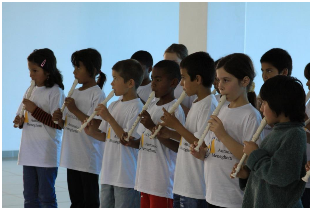
Foto 1 9 : Alunos do Projeto Flauta em apresentação na Antonio Meneghetti Faculdade (2009). 10

Quando minha filha chega da escola, ela vem direto falar sobre a aula e canta, faz sons como se tivesse tocando a flauta. Deve estar gostando de tocar flauta! (Relato da mãe de uma aluna da 4ª série, São João do Polêsine, 2010).