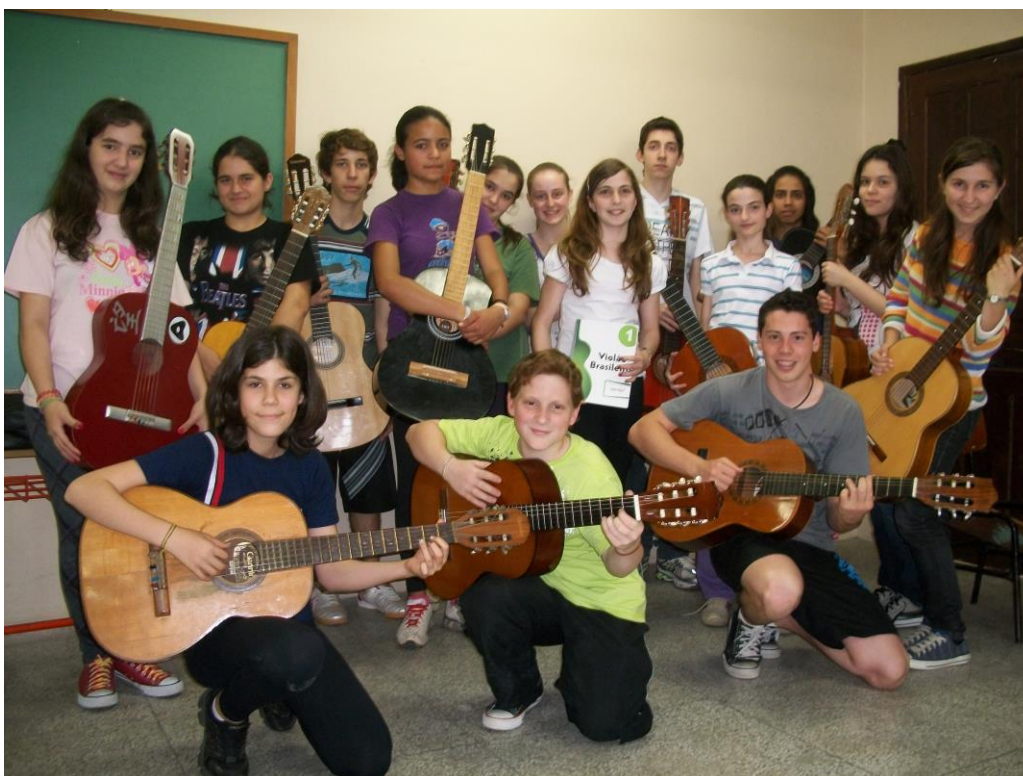
Foto 7: Alunos do Projeto Amigos do Violão (Ensino Fundamental - séries finais e Ensino Médio) (2010).

solicitação espontânea dos próprios alunos que manifestaram interesse em aprender esse outro instrumento. Assim, ele iniciou no segundo semestre de 2010, em parceria entre a Escola Estadual de Educação Básica João XXIII de São João do Polêsine, a Fundação Antonio Meneghetti 20 , a Impare Escola de Música e Educação Musical e a AMF.