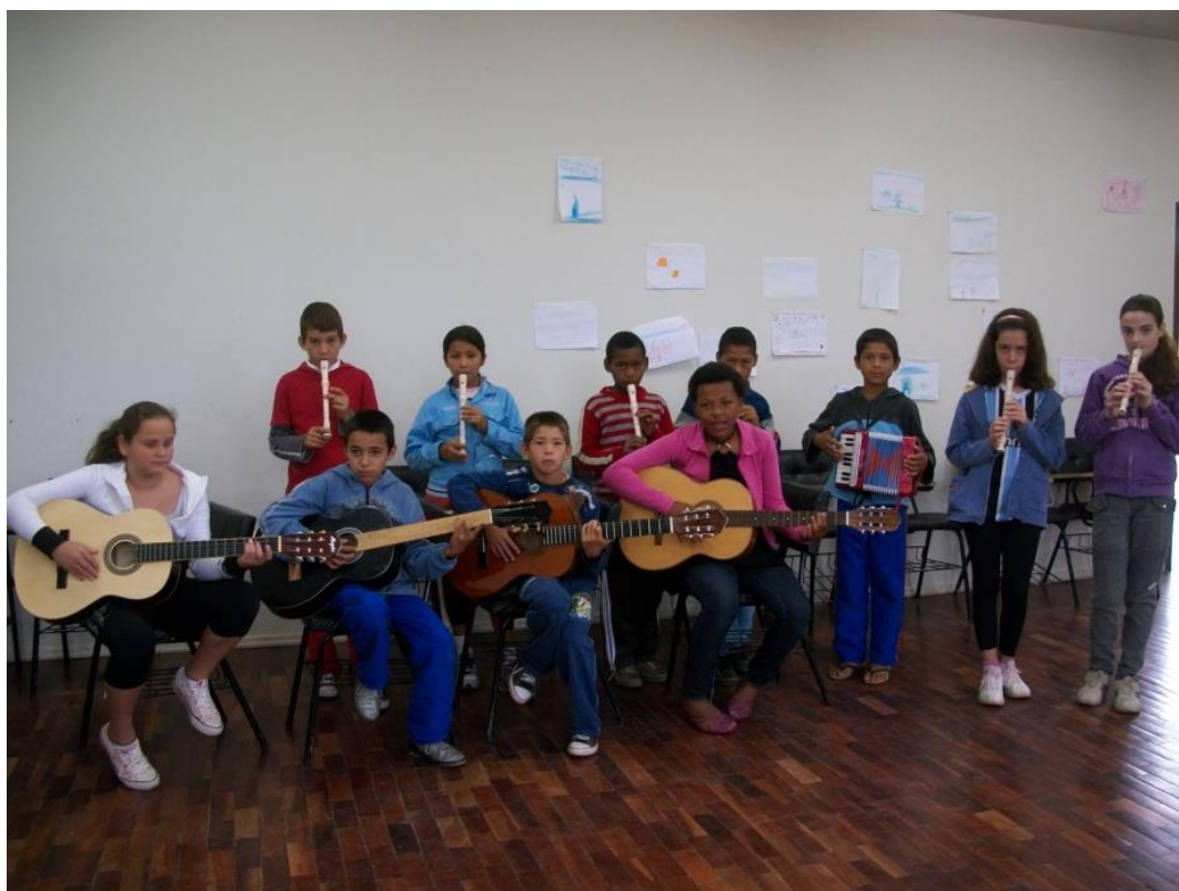
Foto 5: Alunos do Projeto Flauta (Ensino Fundamental – 4ª série) em apresentação na sala de aula (2010).

e passam a entender e querer fazer o melhor e isso vira uma rotina, um hábito que, depois, pode ser transposto em outras ações do seu dia-a-dia. Fazemos então uma analogia com um time de futebol, em que os jogadores treinam com o objetivo de jogar e fazer o gol. É isso que possibilitamos aos alunos do Projeto Flauta, que eles joguem e façam o gol, então, os professores do Projeto trabalham com seriedade e respeito desde o início, porém sem perder o carisma e a alegria. As aulas acontecem num clima de descontração, no qual todos são incentivados a dar o seu melhor e o professor articula as atividades de modo que haja muito respeito às diferenças e limitações de cada um. Desse modo, todos poderão tocar e não terão medo de expor-se. O respeito mútuo é exercitado em todas as aulas e, dessa forma, elementos que extrapolam o campo da música são trabalhados com os alunos.