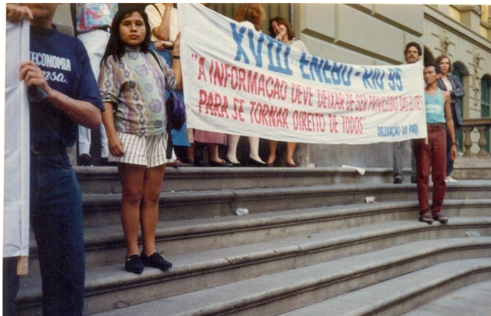
Fotografia 2 - Participação em Encontro de Estudantes de Biblioteconomia

importante essa troca de experiências com outros estudantes e com outras realidades da biblioteconomia.