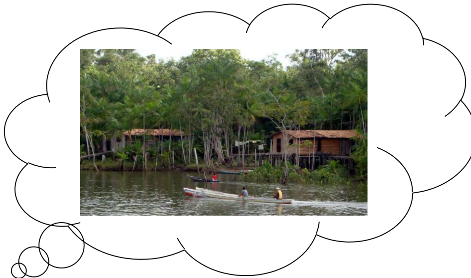
Figura 2 – Cotidiano da cidade de Cametá

Há um tempo em que é preciso abandonar as roupas usadas, que já têm a forma do nosso corpo, e esquecer os nossos caminhos, que nos levam sempre aos mesmos lugares. É o tempo da travessia: e, se não ousarmos fazê-la, teremos ficado, para sempre, à margem de nós mesmos. (Fernando Pessoa)