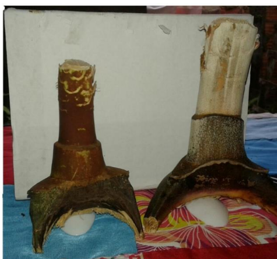
Fotografia 1 - Boneca do cacho do açazeiro.

Ainda sobre minha infância recordo das muitas brincadeiras junto com meus irmãos, brincávamos de bandeirinha, elástico, escravo de Jorge, pira cola, queimada, pião, etc.. Lembro também que, devido às condições financeiras, não tínhamos brinquedos de loja e nossa boneca (fotografia 1) era feita de cacho do açazeiro. O Açai é um fruto típico da região do Pará e faz parte do cardápio paraense. A parte que fica fixa no açazeiro era a parte que fazíamos de conta que eram as pernas da boneca e colocávamos então na cintura, como antes nos interiores se carregavam as crianças. O pião e os bichos eram feitos dos frutos da pracuúba (madeira utilizada para fazer casco e remo) e da pitaica (madeira boa para fazer lenha) e ainda fazíamos brinquedos da palmeira denominada de miriti.