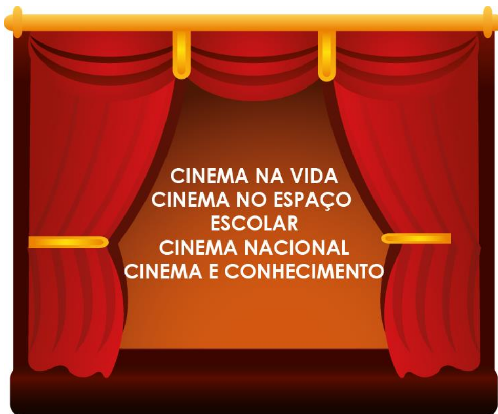
Figura 3- Eixos temáticos

Como a própria autora sugere, é necessária a construção de subeixos mais precisos e específicos, que venham a responder sobretudo os objetivos da pesquisa. Com base nos assuntos abordados nas entrevistas, foram definidos 4 (quatro) eixos e 8 (oito) subeixos, conforme estabelecido no quadro 2.