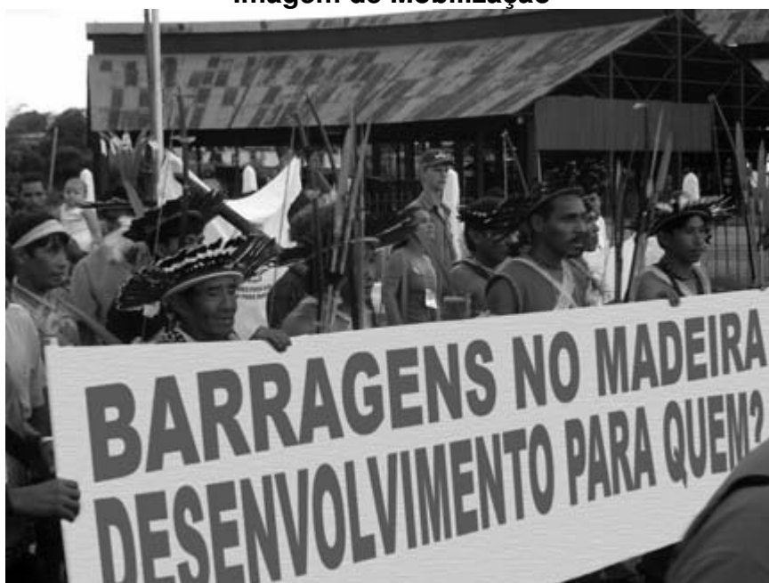
Imagem de Mobilização