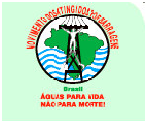
Figura 1 – recorte de material impresso I

Sob a perspectiva da Análise de Discurso, o enunciado “Águas para a Vida, Não para a Morte”, utilizado pelo MAB nas duas campanhas analisadas e nos demais materiais impressos de divulgação, encerra significados que remetem à uma percepção do ente “água” ancorada no cotidiano e na relação sócio-histórica estabelecida entre as comunidades atingidas e os recursos naturais, isso tudo colocado dentro de um apelo sensibilizador, pois destaca a oposição vida/morte associada à imagem de um homem sacrificado por uma torre de eletricidade.