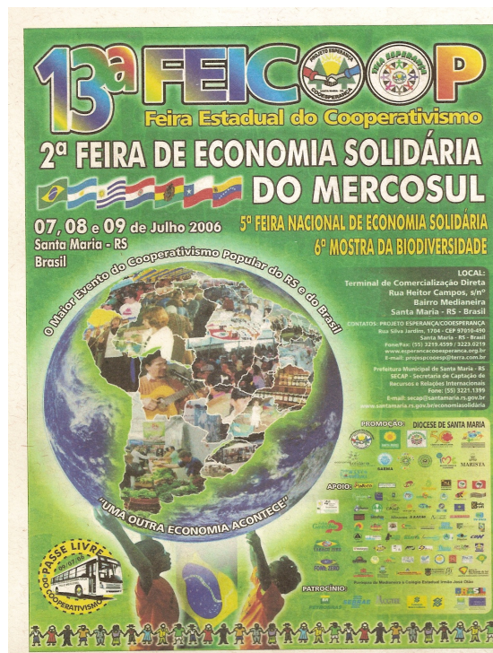
Cartaz da 13ª Feicoop - 2006