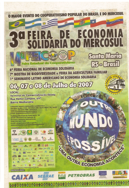
Cartaz da 14ª Feicoop - 2007