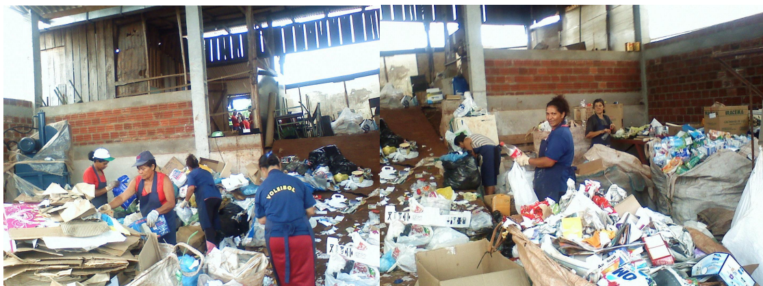
Figuras 8 - Catadores na triagem do material reciclável na associação