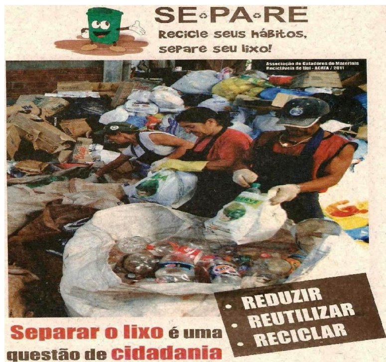
Figura 4 - Folheto distribuído nas oficinas da Campanha SEPA·RE.