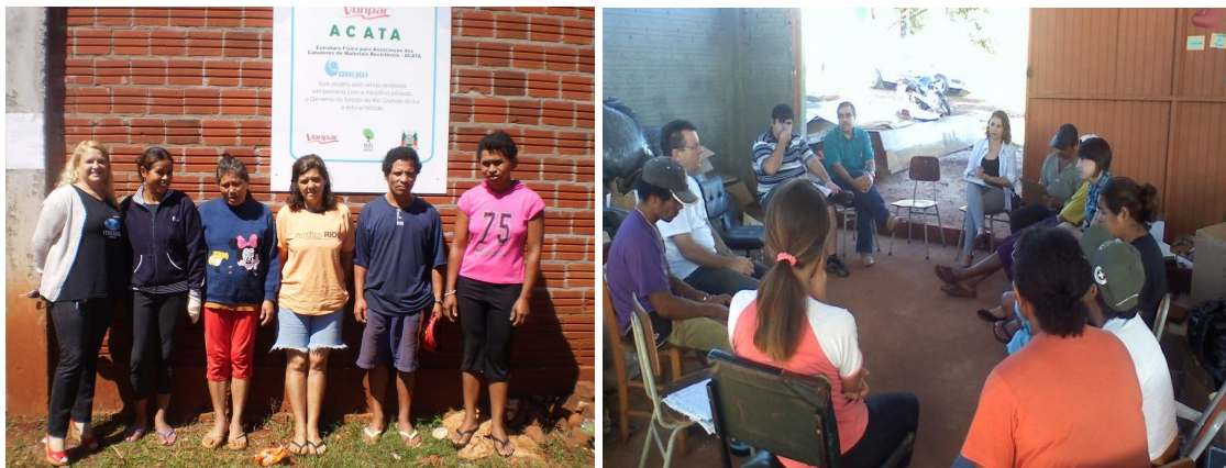
Figuras 7 - Associados que fazem parte da coordenação da Associação de Catadores de Materiais Recicláveis de Ijuí –ACATA e integrantes do Programa REVIVA .

atuais e futuros envolvidos, o domínio sobre operacionalização do sistema e a conscientização sobre a importância do seu trabalho (figuras 7 e 8).