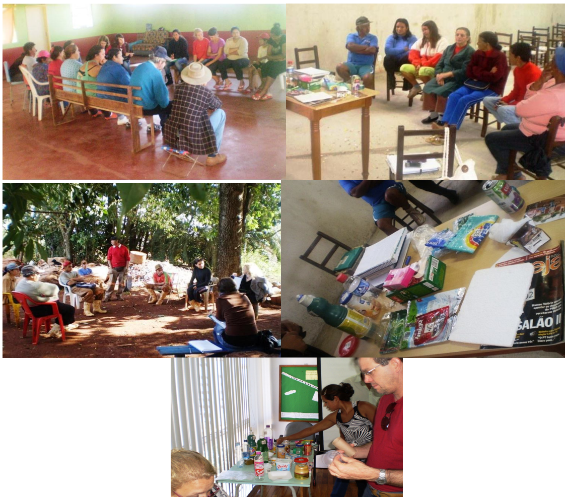
Figuras 9 - Oficinas de educação ambiental realizadas em grupos de catadores de materiais recicláveis e integrantes do programa socioambiental REVIVA no ano de 2010 e 2011