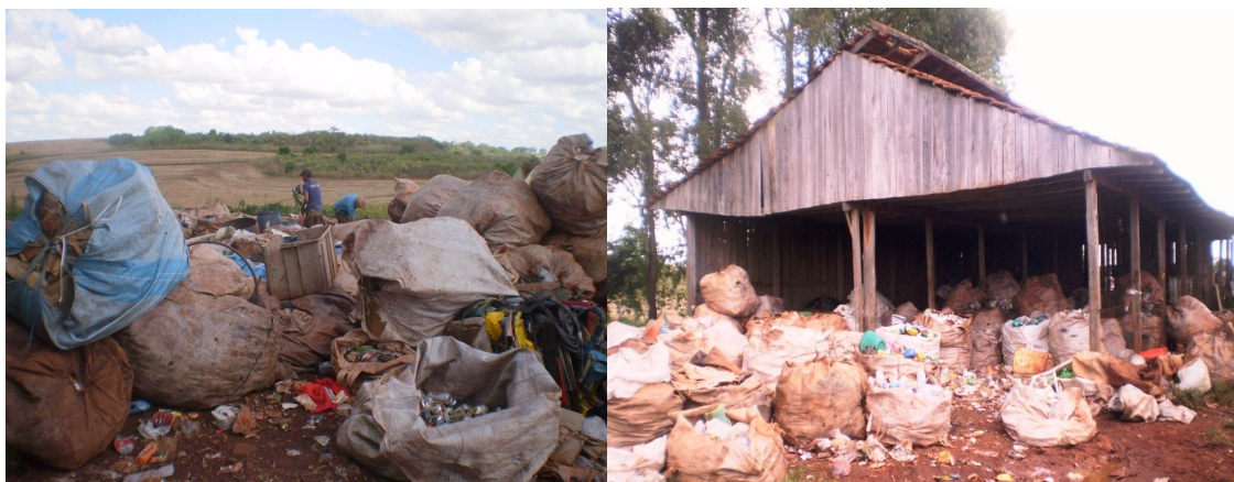
Figuras 3 - Materiais recicláveis antes do processo de triagem dispostos em locais inadequados

Em relação à logística de coleta e descarregamento dos materiais nas centrais de triagem, a divisão dos serviços em centrais regionais é a alternativa para os municípios com grande extensão territorial ou com muitos habitantes, pois quanto menor a distância entre os pontos coletados e os espaços de triagem, melhor será a logística do sistema e menores os custos de transporte (figuras 3).