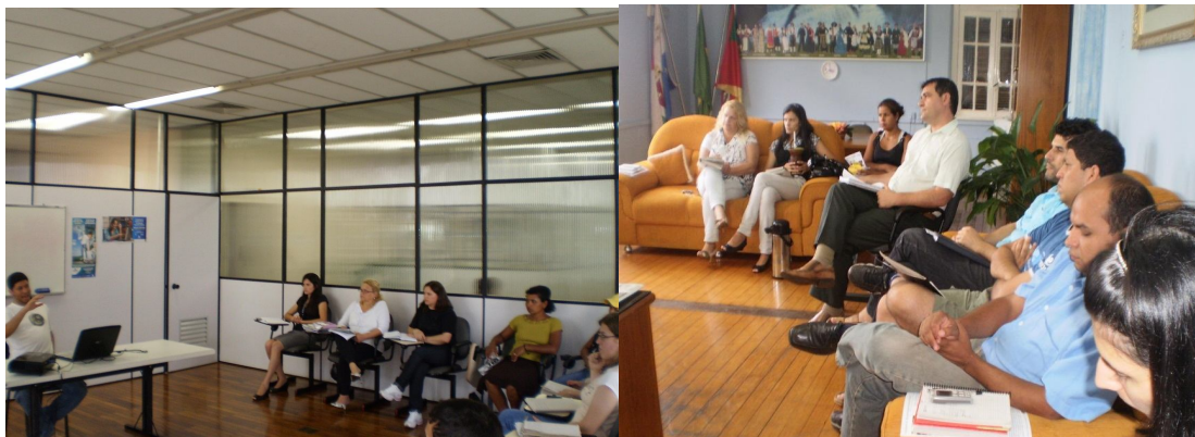
Figura 2 – Reuniões e debates do Programa REVIVA

Para que os trabalhos se desenvolvam de maneira adequada, são realizadas reuniões e debates para apresentação de propostas à política pública de reciclagem com integrantes do programa socioambiental REVIVA (figura 2).