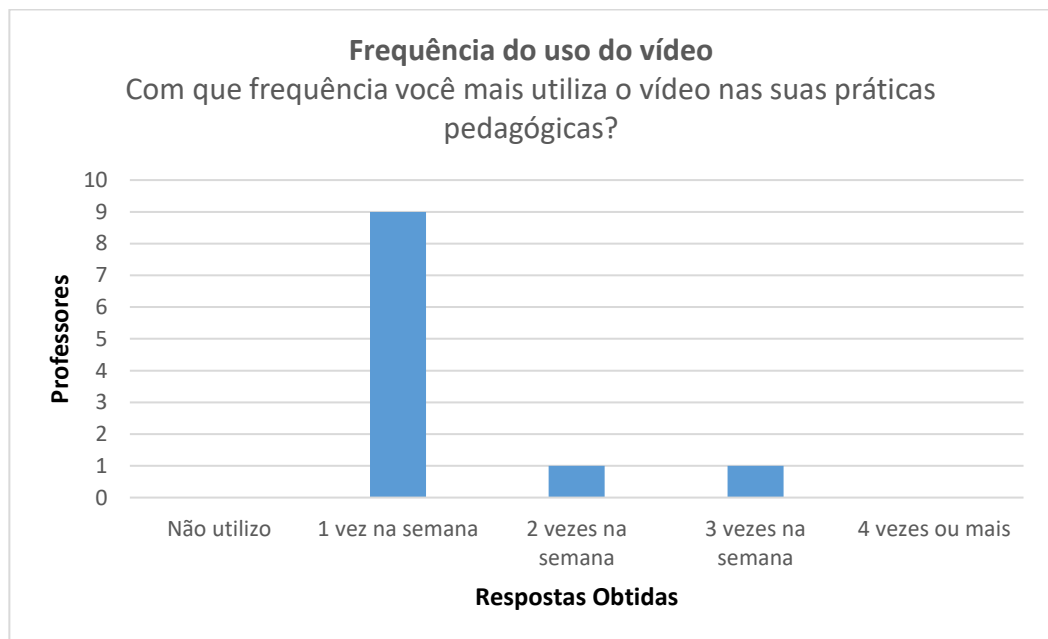
Figura 2. Respostas dos pesquisados sobre a frequência do uso do vídeo.

Quanto a frequência e o tempo de duração do vídeo utilizado em sala de aula, (Figura 2) apresenta resultados obtidos no questionário.