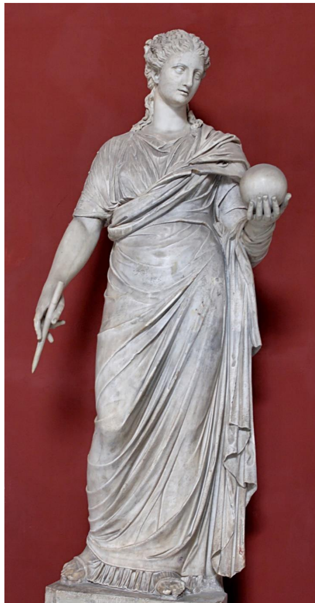
Imagem 1 – Urânia, musa grega da astrologia-astronomia

Representação de Urania, musa da astrologia-astronomia, em mármore: cópia romana da original grega do século IV AEC. A cabeça não pertence ao corpo, foi retirada da Villa Adriana, perto de Tivoli, em 1786.