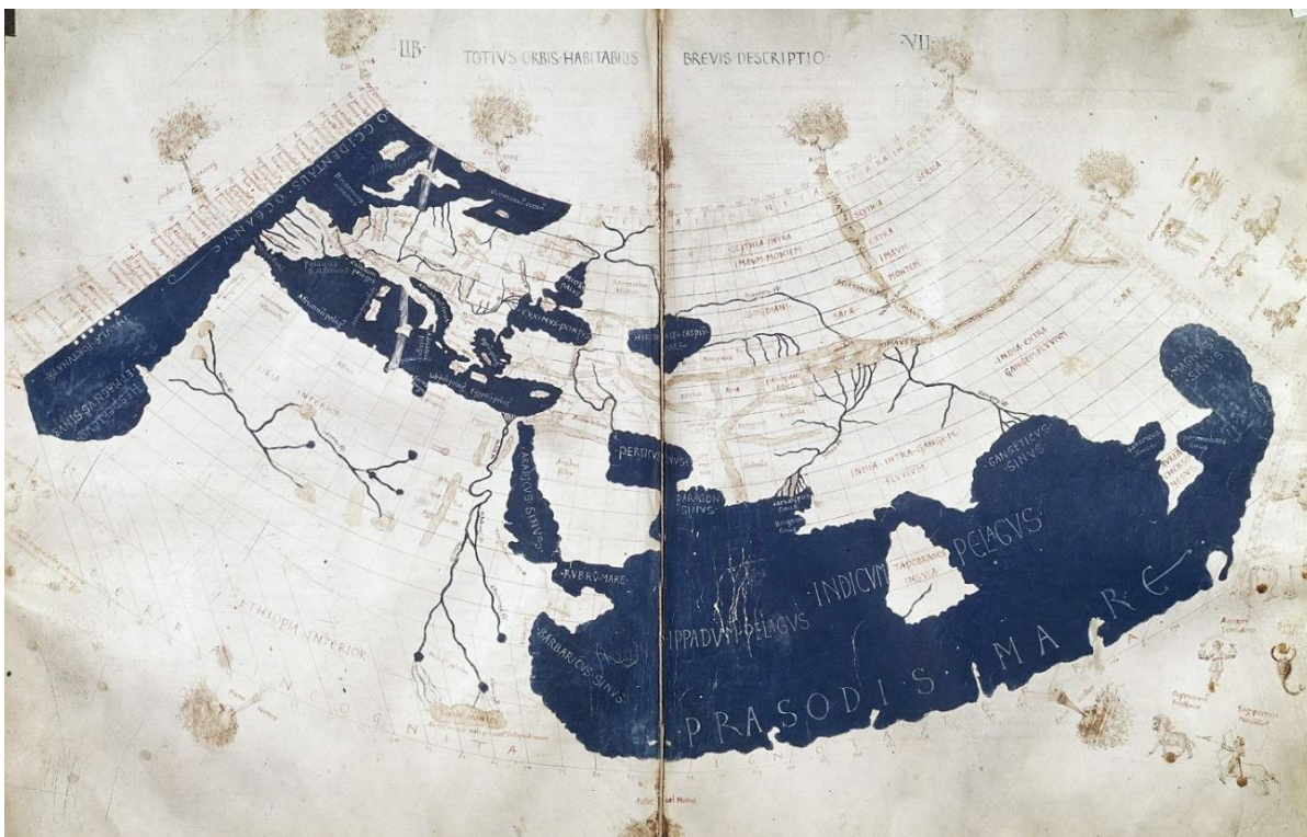
Imagem 7 – Mapa do Mundo Antigo conhecido, segundo a Geografia de Ptolomeu

Mapa florentino produzido em meados do século XV, baseado na tradução latina (de Jacobus Angelus, 1406) dos manuscritos gregos da Geografia de Ptolomeu encontrados por Maximus Planudes no final do século XIII.