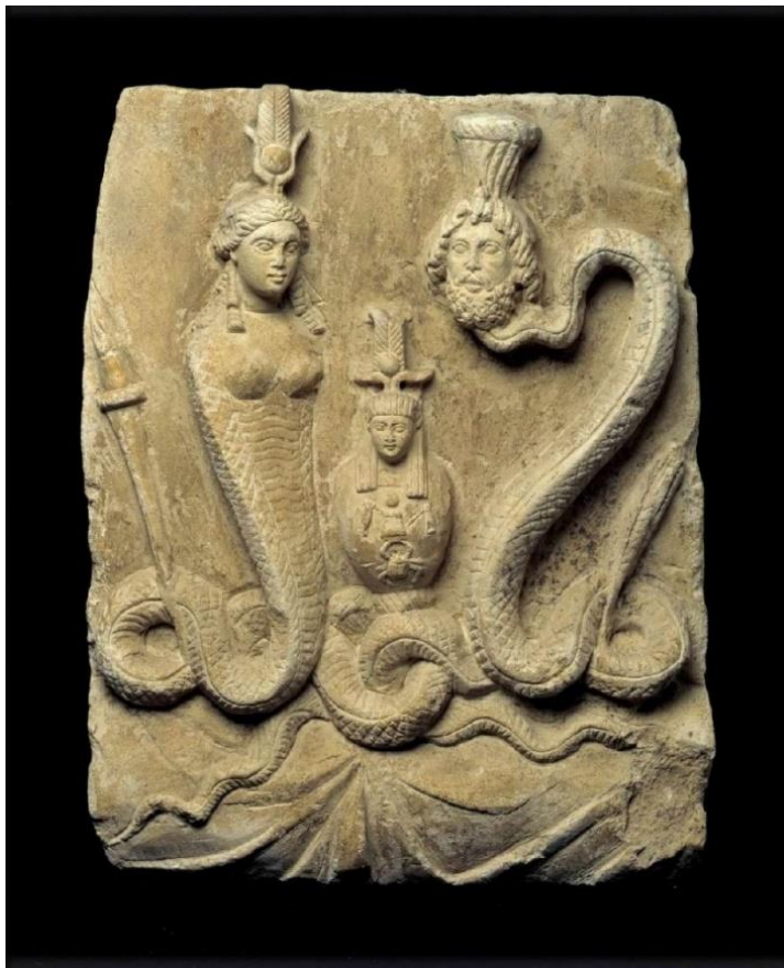
Imagem 4 – Estela ao Bom Daimon e Boa Fortuna com Ísis, Osíris e Serápis

Estela alexandrina em relevo, produzida entre os períodos ptolomaico e romano, em que aparecem Ísis, Serápis e Osíris, representando o Bom Daimon e a Boa Fortuna e a relação com o culto osiriano (Acervo do Museu Holandês de Antiguidades, Leiden).