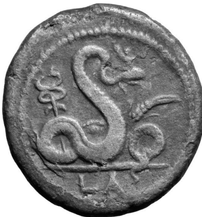
Imagem 3 – Moeda alexandrina representando um altar ao Bom Daimon

Lado inverso de uma moeda romana de Alexandria datada cerca de 76 EC, em que aparece o Agathos Daimon usando a coroa dupla do Egito, com um caduceu a esquerda e trigo maduro a direita.