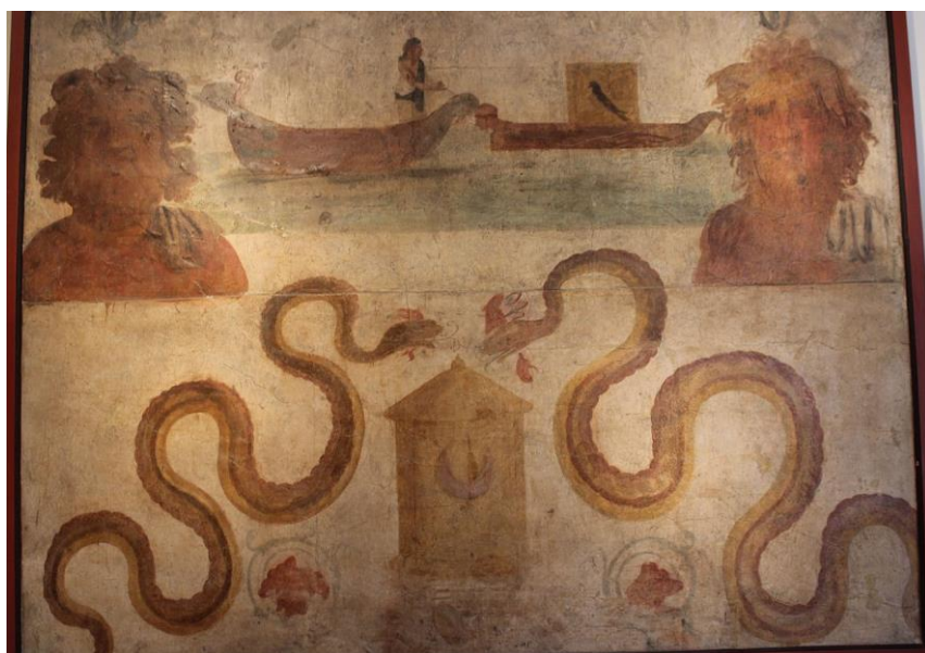
Imagem 6 – Afresco retratando o Agathodaemon encontrado em Pompéia

Afresco romano do período do Principado, encontrado em Pompéia representando o Bom Daimon em um santuário à deusa Ísis (Acervo do Museu Arqueológico de Nápoles, Itália).