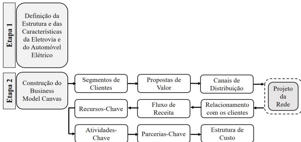
Figura 03 – Desenho do Processo das etapas da pesquisa

Na Figura 03 a seguir, são ilustradas no desenho do processo as etapas da pesquisa: