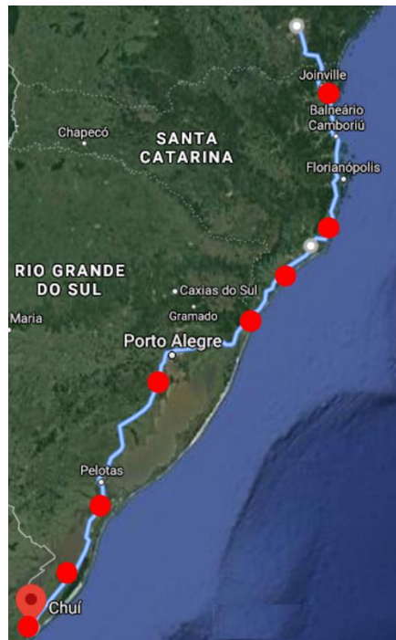
Figura 05 – Localizações das estações de recarga no corredor elétrico do Mercosul.

Na Figura 05 é ilustrado em pontos vermelhos as estações de recarga escolhidas para serem instaladas no corredor elétrico do Mercosul.