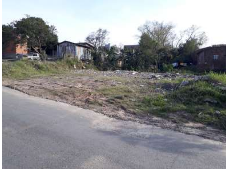
Figura 1. Área próxima à escola da pesquisa retratando lixo e entulho, e, ao fundo, algumas casas.