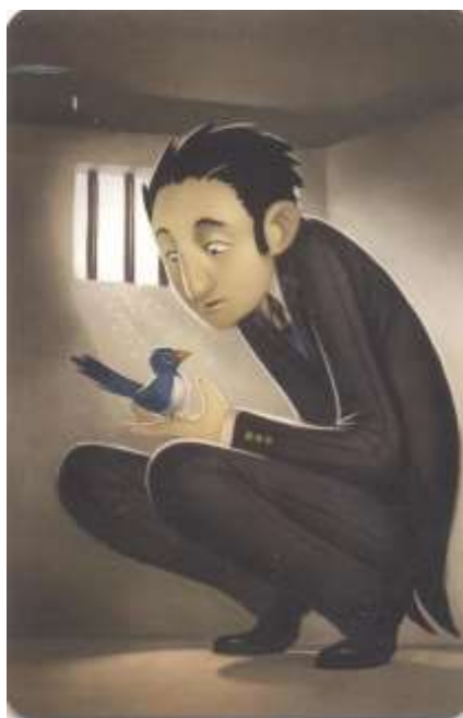
Figura 15. Carta do Jogo Dixit.

Nessa lógica da aquisição de direitos pelo mérito, explicita-se, nas falas dos adolescentes, a associação dos direitos enquanto “liberdades” concedidas pela família ou pela escola, e a falta desses direitos seria a imposição de limites através de regras: “ Na Escola, ah, o aluno tem direito de... Caminhar, aluno tem direito de mexer no celular ” (Tistu); “ Eu pensei assim ‘bah, por que que o adolescente não pode ter um telefone?’ (...) porque a minha mãe falou que ia me dar lá nos meus quinze e falta dois anos ainda ” (Coraline); “ Ah, eu sei um [direito] que eu não tenho. É... A minha mãe não deixa eu ficar até tarde na rua ” (Pedrinho).