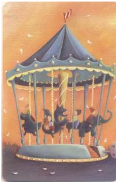
Figura 17. Carta do Jogo Dixit.