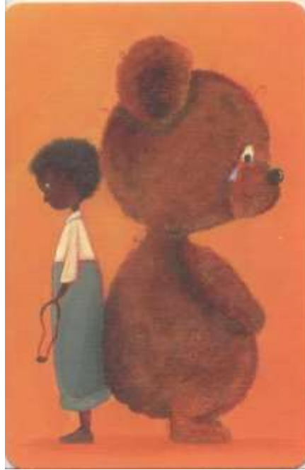
Figura 4. Carta do Jogo Dixit.