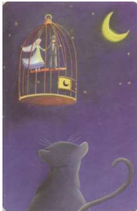
Figura 9. Carta do Jogo Dixit.

econômica, mas sim da ameaça de um empobrecimento do laço social, da inscrição simbólica, das relações intersubjetivas e até mesmo da capacidade de encontrar formas de inclusão (Kemper, 2013). É o que parece suceder no cotidiano dos participantes da pesquisa, uma vez que esses atravessamentos influenciam diretamente em seus modos de vida, suas escolhas e seus caminhos. Nos grupos focais, os adolescentes aprofundam os sentimentos com relação ao bairro através das seguintes cartas: