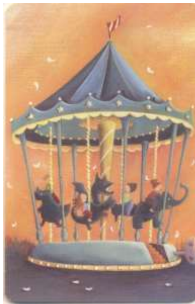
Figura 12. Carta do Jogo Dixit.