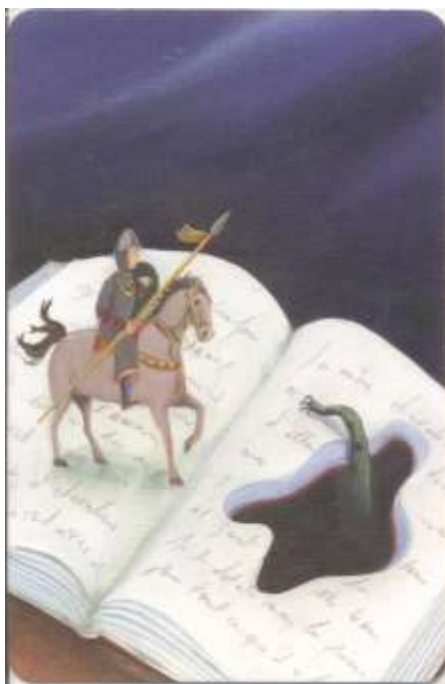
Figura 6. Carta do Jogo Dixit.