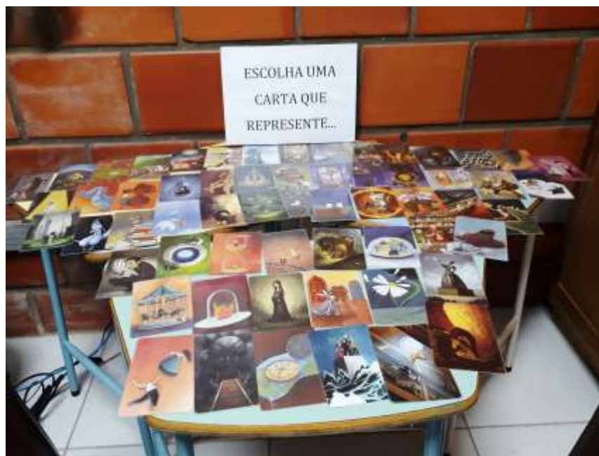
Figura 3. Mesa preparada com as Cartas do Jogo Dixit para o início do grupo focal.

Os grupos, conforme Gaskell (2003), configuram-se como importante recurso metodológico, pois possibilitam que os participantes levem em conta outros pontos de vista e compartilhem experiências. Ainda, Barbour (2009), pontua que os grupos focais podem encorajar os participantes a uma maior honestidade, proporcionando debates sobre questões normalmente não levantadas, principalmente se o objetivo do grupo é refletir alguma experiência em comum que os difere dos outros. Afinal, é preciso que os participantes “tenham o suficiente em comum entre si, de modo que a discussão pareça apropriada, mas que apresentem experiências ou perspectivas variadas o bastante para que ocorra algum debate ou diferença de opinião” (BARBOUR, 2009, p. 21). Logo, acredita-se que os grupos focais puderam enriquecer a pesquisa na medida em que buscaram uma compreensão mais ampla e profunda de aspectos já colocados nas entrevistas e proporcionaram um momento de encontro afetivo e acolhedor aos adolescentes.