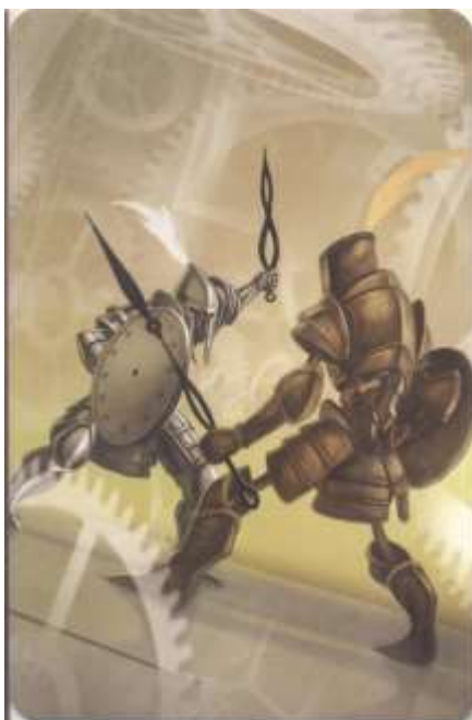
Figura 7. Carta do Jogo Dixit.

No grupo focal 1, foi utilizada a seguinte carta para ilustrar “quando começassem a trabalhar”, sendo que a partir dela os adolescentes teceram algumas discussões acerca das suas percepções sobre trabalho: