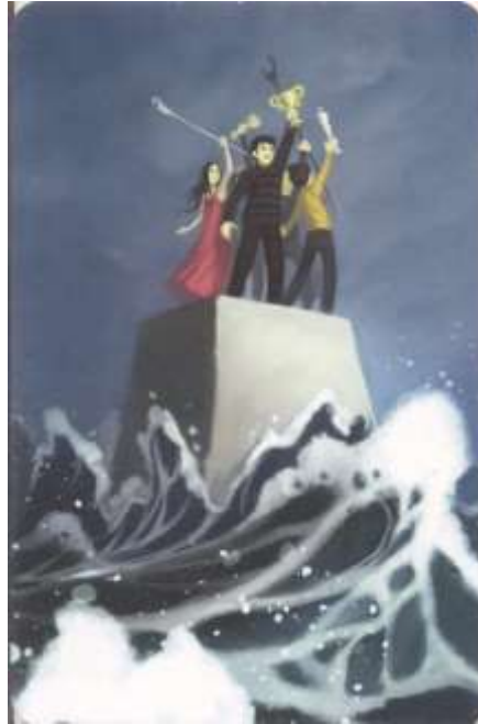
Figura 8. Carta do Jogo Dixit.

bloqueia acessos. A partir dessa mesma solicitação, o grupo focal também discute sobre a carta abaixo (Figura 8), na qual há um grupo de pessoas erguendo objetos (sendo um deles um troféu) em meio a um mar revolto.