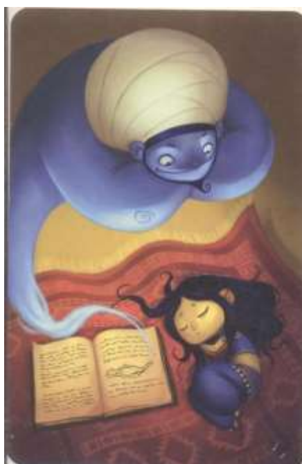
Figura 14. Carta do Jogo Dixit.

Nessas narrativas, Pollyanna e Coraline reivindicam não só os seus direitos, mas os direitos de outros adolescentes e das pessoas com quem convivem, conhecem ou simplesmente veem em seu bairro. Nesse contexto, não há como discordar das meninas em suas reivindicações, pois é sabido que nos territórios da exclusão, da violência e das diversas vulnerabilidades, a vida se torna um desafio até mesmo no que tange a necessidades básicas, que deveriam estar asseguradas a todos. Nos grupos focais também emergiram opiniões bastante críticas com relação à posição do Estado na garantia dos direitos dos adolescentes: