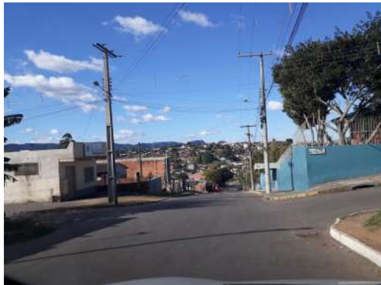
Figura 2. Área próxima à rua principal do bairro: à direita, a escola da pesquisa (muro azul), e ao fundo, distante, o centro da cidade.

Por fim, Takeiti e Vicentin (2017, p. 151) entendem que a periferia “seria o lócus por excelência da pobreza e exclusão urbanas, onde as contradições sociais, advindas do modelo de expansão da cidade, estariam mais visíveis e aguçadas”. Nesse sentido, é importante salientar que essa escola, localizada em um território marcado pela exclusão social, configurou-se em um local privilegiado para pesquisar questões que englobam a adolescência, a exclusão social e os direitos desses adolescentes.