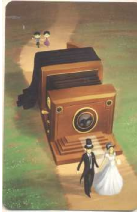
Figura 11. Carta do Jogo Dixit.