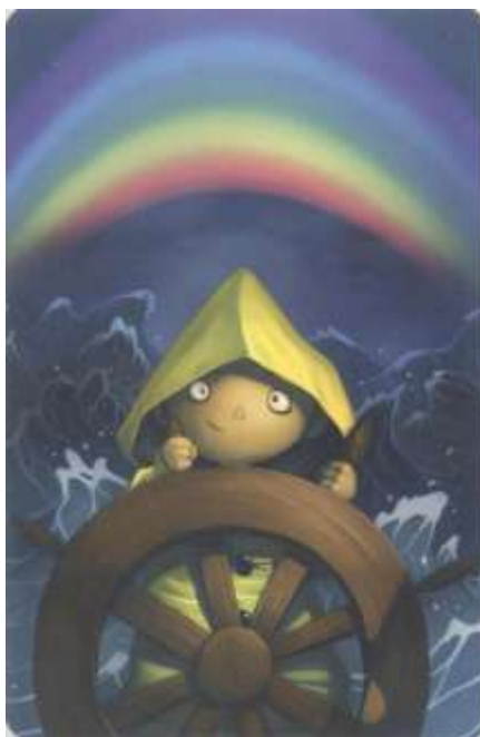
Figura 16. Carta do Jogo Dixit.

Afinal, quando apenas um caminho se apresenta, que possibilidade de escolha há? Com relação ao direito de escolha, Matilda utiliza a carta abaixo no grupo focal (figura 16), relacionando o “livre-arbítrio” ao direito à liberdade. Tistu complementa que o “livre-arbítrio” seria o “contrário de uma ditadura”. Ou seja, pensando na imagem a que se referem os adolescentes, seria a possibilidade de que cada um conduzisse seu próprio barco, tomando suas decisões e podendo escolher a direção a navegar, ainda que em meio a um mar revolto.