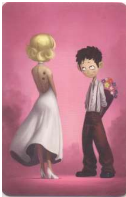
Figura 18. Carta do Jogo Dixit.