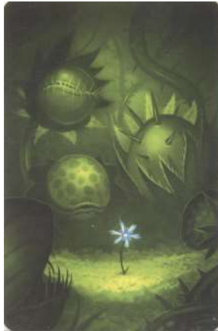
Figura 13. Carta do Jogo Dixit.

A participante Wendy parece dialogar com Dunker (2017) no momento em que utiliza esta carta (Figura 13) para representar seus sonhos: