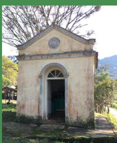
3 CAPITEL DE SÃO PATRÍCIO Linha Um, s.n., Zona Rural 29° 38' 29" S 53° 31' 34" O