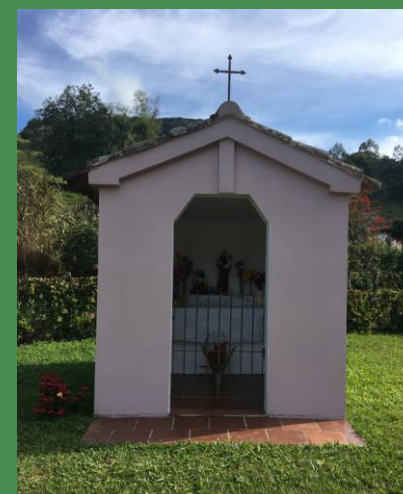
5 CAPITEL DE SANTO ANTÔNIO Linha São Valentin, s.n., Zona Rural 29° 39' 45" S 53° 32' 35" O