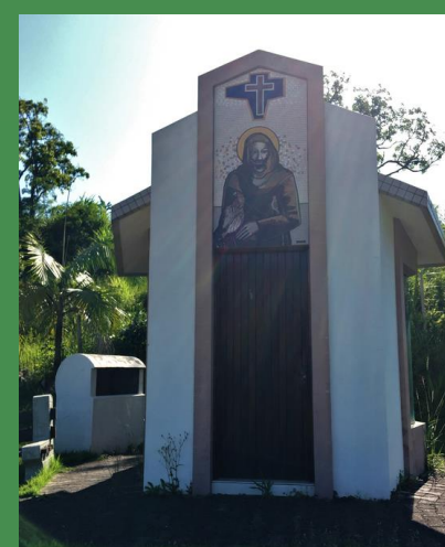
4 CAPITEL DE SÃO FRANCISCO - NOVO R. Alexandre Rorato, s.n., Vale Vêneto 29° 39' 19" S 53° 31' 45" O