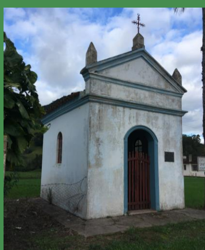
2 CAPITEL DE N. SR. DO ROSÁRIO DA POMPÉIA R. Lourenço Iop, s.n., Vale Vêneto 29° 39' 14" S 53° 31' 16" O