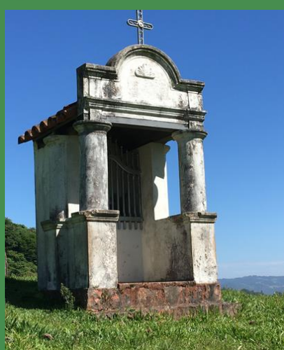
1 CAPITEL DE SÃO JOSÉ Linha Bonfim, s.n., Zona Rural 29° 38' 18" S 53° 27' 26" O