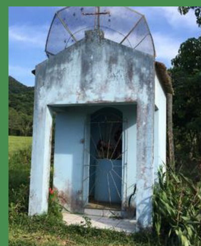
6 CAPITEL DE SANTO ANTÔNIO Linha da Consciência, s.n., Zona Rural 29° 40' 12" S 53° 29' 16" O