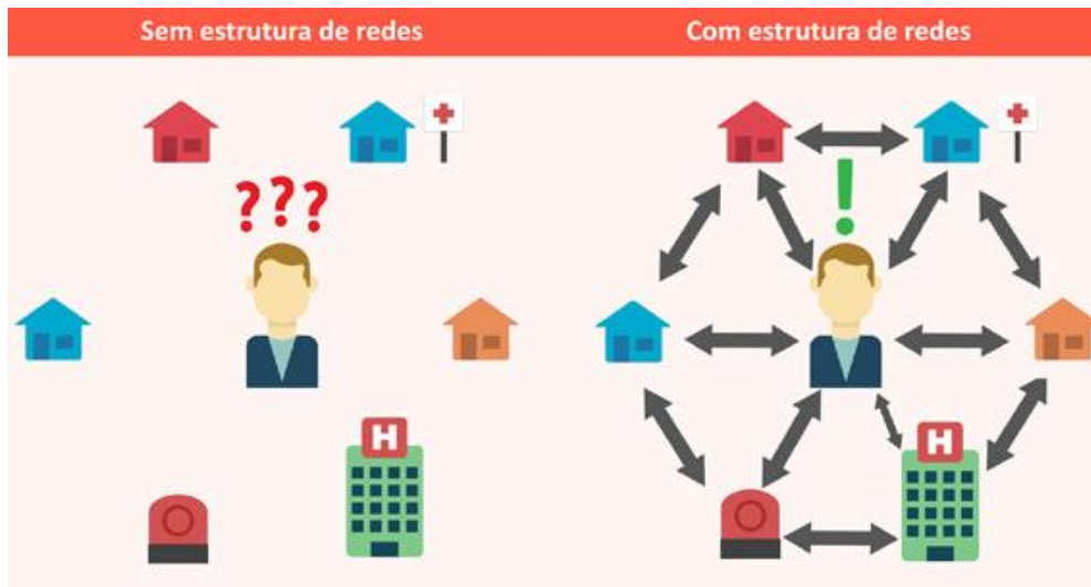
Figura 1 – Estruturas de rede.