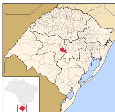
Figura 1- Mapa localização Restinga Sêca- RS

O município de Restinga Sêca localiza-se na região central do estado do Rio Grande do Sul, a 277 km, via rodovia de sua capital, Porto Alegre, conforme Figura 1. A área do município é de 954,76 km 2 , sendo que em sua maioria é rural, com uma população de 15.849 habitantes.