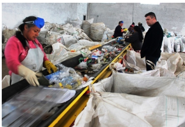
Figura 2- Galpão