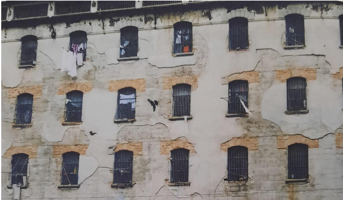
Figura 2 – Parte externa da penitenciária feminina