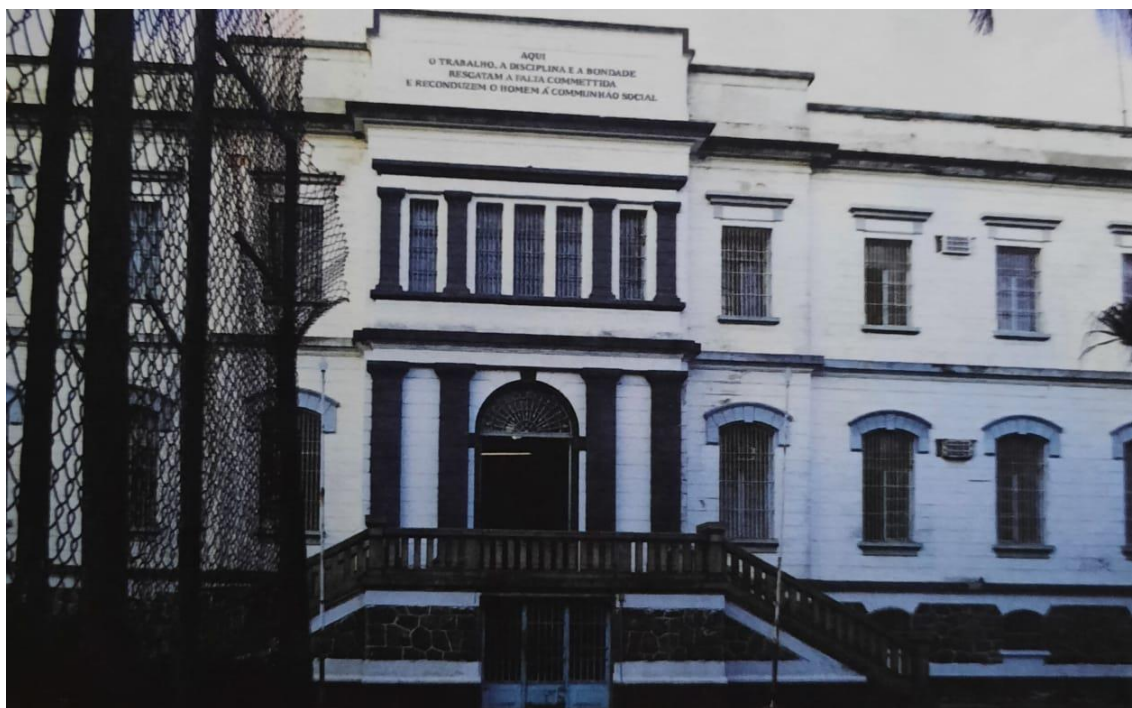
Figura 1 – Entrada do presídio feminino

A expressão “regeneração” ainda remonta ao ideal das instituições penais a partir do século XVIII, salientado por Carvalho Filho (2002): elas eram lugares nos quais se buscava a repressão ao crime e a suposta reinserção do infrator na comunidade, a partir da reflexão do indivíduo sobre seus atos desviantes, promovida pelo isolamento, e a conseqüente alteração de seus hábitos. Dias e Costa (2013), no entanto, afirmam que esse ideal não era cumprido na prática. Desse modo, entende-se que não eram ofertados caminhos para que os sujeitos encarcerados voltassem à sociedade, o que mergulhava os prisioneiros em incertezas sobre seu próprio futuro. Essa afirmação, todavia, vai de encontro à frase gravada no frontispício da cadeia feminina, que pode ser observada na Figura 1: