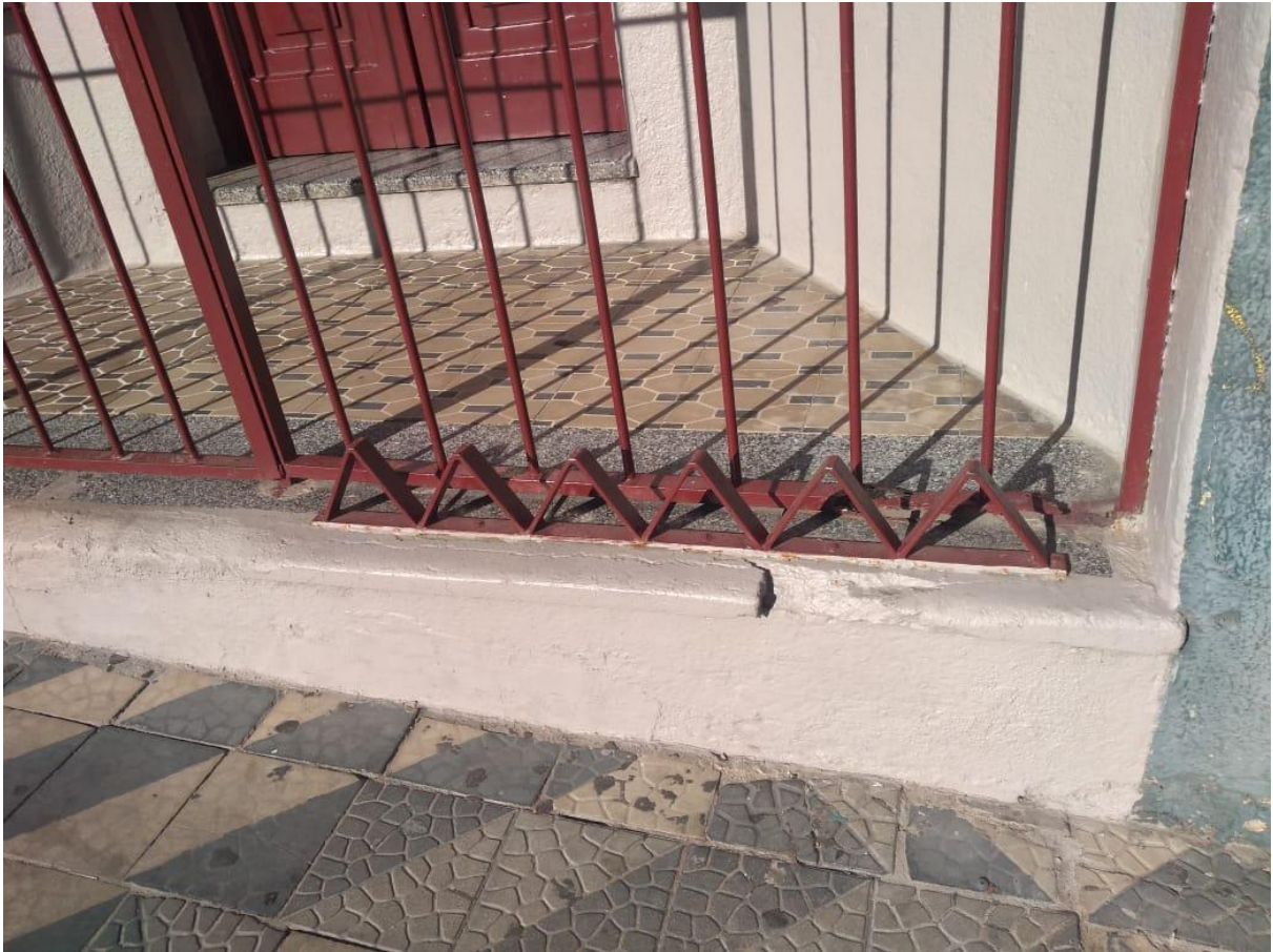
Figura 2: Elemento hostil em condomínio na Avenida Rio Branco.

O primeiro elemento está localizado na Avenida Rio Branco e pertence a um condomínio residencial, onde foram instaladas pequenas ferragens onduladas sobre o degrau que faz divisa com a calçada, impossibilitando que alguém se sente ali. O curioso deste caso é que já existe a presença de altas grades que delimitam o espaço entre o condomínio e a calçada, no entanto, somou-se ainda ferragens menores como forma de complementar a restrição de permanência naquele local. Pela imagem, é possível perceber que existe um espaço vazio na entrada do prédio e que, se não houvesse grades ali, naturalmente seria um local propício à pernoite de moradores de rua ou até mesmo outras pessoas que desejassem sentar um momento. Contudo, com a implantação de tais artefatos fica evidente o desejo da não presença de quaisquer pessoas e, o fato de estar presente em um condomínio residencial, explicita também a procura por segurança e proteção por parte dos moradores.