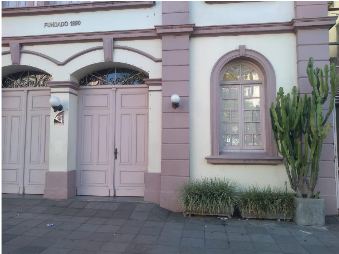
Figura 8: Elemento Hostil em frente ao Theatro Treze de Maio na Praça Saldanha Marinho.

Por último, o sétimo elemento de Arquitetura Hostil corresponde a plantas espinhosas situadas no Theatro Treze de Maio, que fica na face leste da Praça Saldanha Marinho. As plantas estão dispostas nos dois lados da porta de entrada do Theatro e, observando é possível compreender que com os grandes vasos é dificultoso que alguém consiga, por exemplo, se recostar na parede ou ainda permanecer deitado naquele espaço. No entanto, por se tratar de vegetação, é possível considerar a intenção decorativa de dispor tais elementos naquele espaço, todavia, nesta análise será considerado como dispositivo de Arquitetura Hostil por se tratar de plantas espinhosas, além do que, estão em frente a um ponto turístico da cidade, um local que recebe eventos e público, dessa forma, se torna mais possível considerar a intenção de afastar pessoas indesejáveis daquela área, mantendo-a “limpa”.