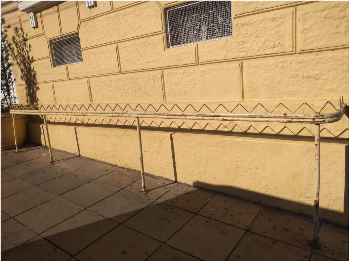
Figura 4: Elemento Hostil em prédio histórico na Avenida Rio Branco.

O terceiro elemento foi identificado no prédio nº683 da Avenida Rio Branco, o qual sob Decreto Executivo de 5 de agosto de 2020 foi tombado provisoriamente como Patrimônio Histórico e Cultural do Município. Corresponde à ferragens onduladas, dispostas em toda extensão da parede frontal do prédio, além de um vaso de planta, como forma de afastar pessoas que pudessem se encostar na parede e permanecer naquele local. É possível afirmar que tais elementos poluem o desenho visual e a arquitetura original deste prédio histórico, o que pode tornar o local nada atrativo, por exemplo aos turistas, além disso, a essência da hospitalidade urbana que é ofertar qualidade ambiental (Ferraz, 2013) pode ser contrariada, pois, torna-se impossível considerar agradável e bonito um local repleto de ferros pontiagudos ou plantas espinhosas.