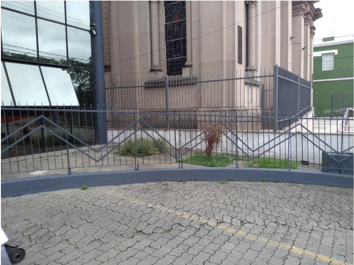
Figura 5: Elemento hostil ao lado de uma academia na Avenida Rio Branco.

Ainda na Avenida Rio Branco, o quarto elemento foi identificado, desta vez ao lado de uma academia, as ferragens altas cercam um espaço vazio entre a academia e a igreja. Em frente há uma parada de ônibus e geralmente um grande número de pessoas se concentra naquele espaço, sendo necessário às vezes aguardar em frente a academia, nesse sentido, tais aparatos de ferro tornam-se hostis aos indivíduos que circulam no local e demonstram a indesejabilidade de ocupação daquele espaço. Em vista disso, essas ferragens atuam como uma barreira física de delimitação de espaços, que é agressiva e hostil, contribuindo para a construção de imagem de cidade permeada de ferros.