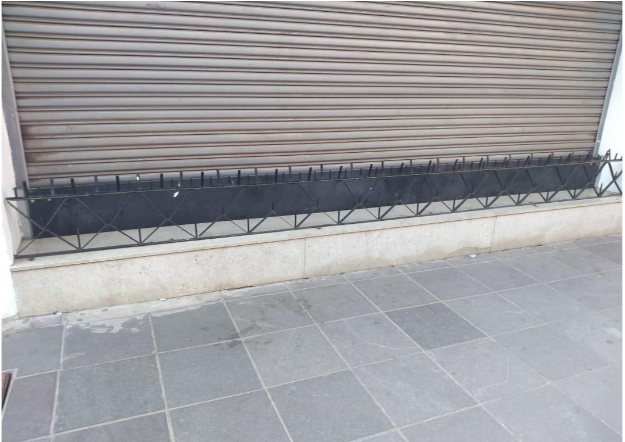
Figura 6: Elemento hostil em uma loja de roupas no Calçadão Salvador Isaia.

Já no Calçadão Salvador Isaia, foi encontrado o quinto elemento, tratando-se de uma trama de ferros fixada sobre a soleira da vitrine de uma loja de roupas. A área é sempre movimentada e considerando que atualmente o Calçadão passa por obras e que todos os bancos foram retirados, as soleiras seriam o único local onde alguém poderia descansar por um momento. Todavia, pode-se entender que independentemente de ser morador de rua ou não, nenhuma pessoa é bem vinda a utilizar estes espaços residuais para descanso ou qualquer outra coisa e, assim, para reafirmar essa ideia, são instalados esses artefatos pontiagudos, de design desagradável. Quando pensamos em estabelecimentos como lojas de roupa por exemplo, que visa apresentar/vender uma imagem de “beleza”, essa ideia de afastar a “feiuza” por meio da Arquitetura Hostil ganha mais ênfase, pois um local onde há moradores de rua dormindo sob a marquise não seria atraente para potenciais clientes. Desse modo, o que precisa ser entendido é que utilizar de meios hostis para afastar pessoas indesejáveis como mendigos, apenas serve para mascarar a realidade, uma vez que não é fornecida a devida assistência a esses indivíduos para que consigam melhorar de situação (PEIXOTO, 2020).