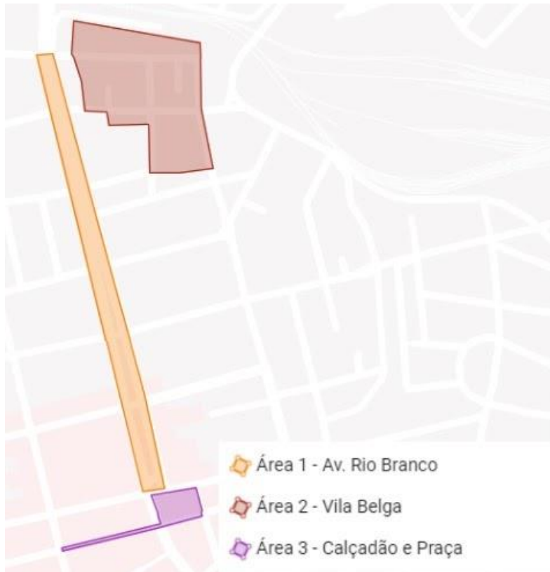
Figura 1: Localização das áreas urbanas observadas.

A Área 1 definida para este trabalho diz respeito à Avenida Rio Branco, principal avenida do centro e uma das mais importantes da cidade de Santa Maria, pois de acordo com Silva (2014) teve grande participação no desenvolvimento e crescimento da cidade. A autora destaca que a instalação da rede ferroviária em Santa Maria foi de fundamental importância para o desenvolvimento da cidade e também para que a Avenida Rio Branco se tornasse o centro do comércio santa-mariense, além de espaço de convivência e socialização entre as pessoas. Atualmente, percebemos que a Avenida Rio Branco já não é a principal da cidade em questões de eixo comercial, uma vez que o comércio se expandiu para além do centro, no entanto, permanece