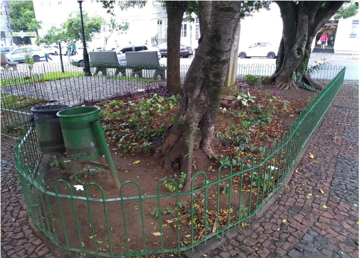
Figura 3: Elemento hostil em canteiro central da Avenida Rio Branco.

O segundo elemento localiza-se no canteiro central entre as duas vias da Avenida Rio Branco, tratando-se de um cercamento de ferros ao redor de algumas árvores e área com grama. Neste caso, este elemento em específico deixa mais questionamentos do que outros com relação a seu real objetivo, pois tal ação pode ser interpretada tanto como forma de preservar a grama, uma vez que é comum as pessoas transitarem por ali e pisotear sobre a área verde, ou como forma exclusiva de cercar o espaço e restringir o acesso e permanência de indivíduos. Todavia, o que se pode apontar é que contribui para produção de um espaço urbano de má qualidade (Andrade, 2010) por ser esteticamente feio e poluir a imagem visual do espaço, ademais, por se tratar de uma área pública, deduz-se que foi implantada sob ordens de governantes.