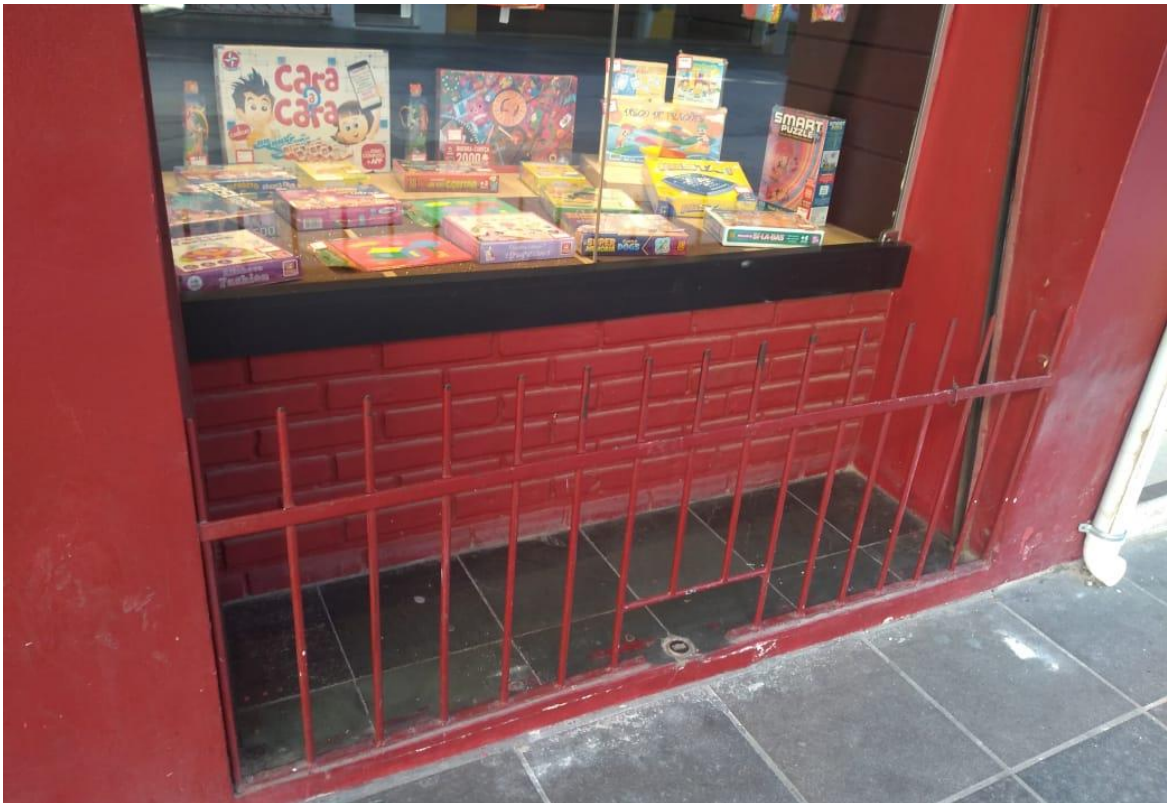
Figura 7: Elemento hostil em uma livraria no Calçadão Salvador Isaia.

Também no Calçadão, em uma livraria foi localizado o sexto elemento, o qual diz respeito a uma grade de ferro cercando um espaço vazio que poderia servir de abrigo a alguém devido ao fato de estar sob a marquise. De antemão, refletindo sobre todos os elementos já analisados, pode-se dizer que a grande semelhança que todos possuem em comum é a explícita restrição de uso dos espaços, de modo que as ferragens, em razão de seu design e tamanho traduzem a intenção higienista por trás de tais instalações. Ainda de acordo com esses fatos e, considerando os principais afetados pela Arquitetura Hostil que são os indivíduos em situação de vulnerabilidade/pobreza, reafirma-se o estereótipo de que a criminalidade está diretamente ligada à miséria, de forma que, se busca manter afastadas pessoas nestas condições em razão de acreditar que as mesmas representam perigo (FERRAZ et al 2015).