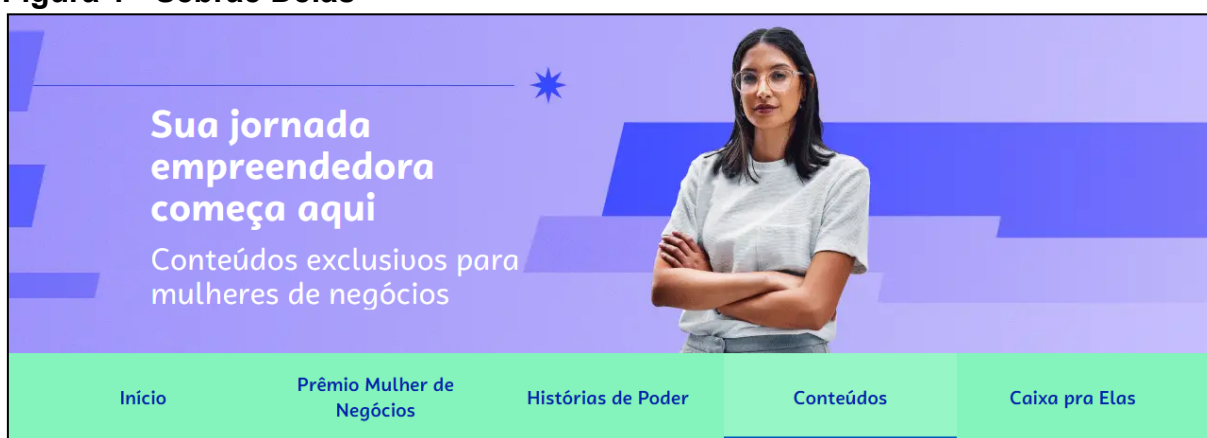
Figura 1 - Sebrae Delas