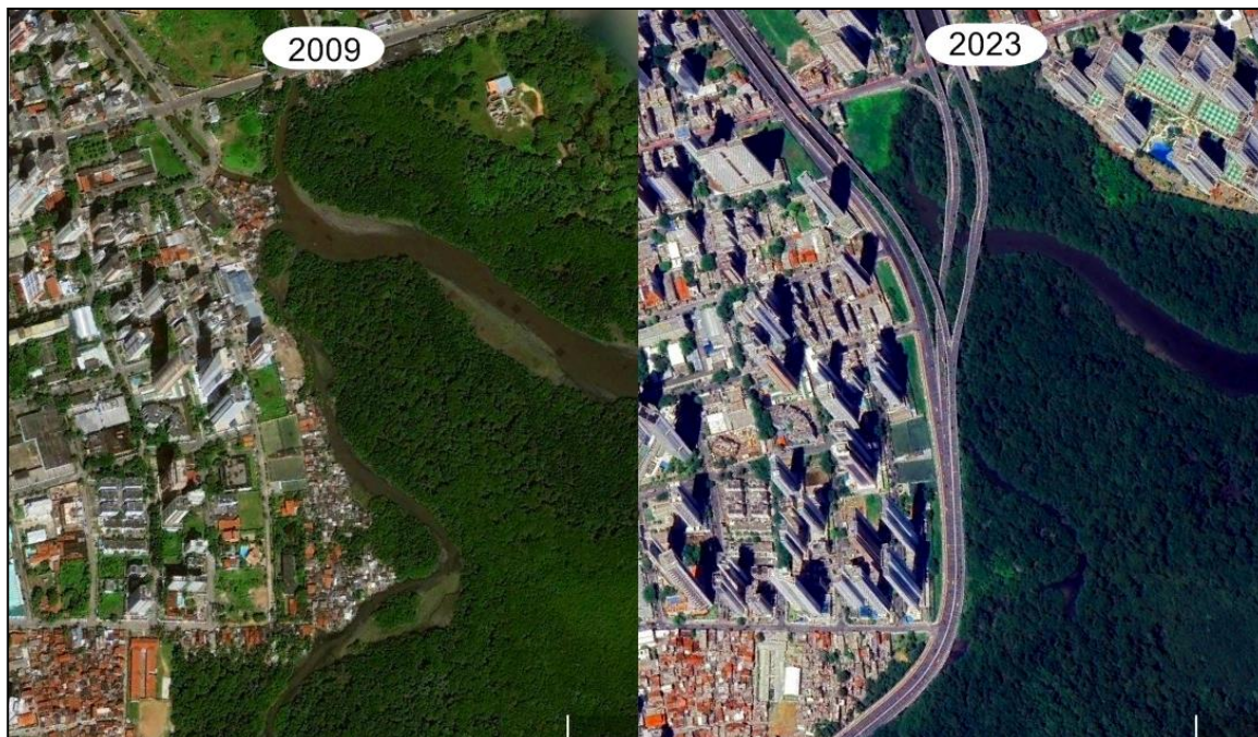
Figura 4 – Imagens do Google Earth da região dos mocambos (2009) e da nova Via mangue (2023) em Recife - PE

social profundo, onde os interesses de uma minoria privilegiada muitas vezes se sobrepõem às necessidades e direitos fundamentais da maioria.