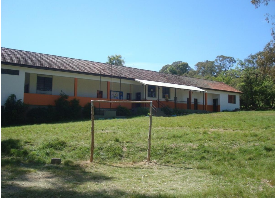
Figura 3 – Escola Nossa Senhora de Fátima, março de 2013 (Cachoeira do Sul).