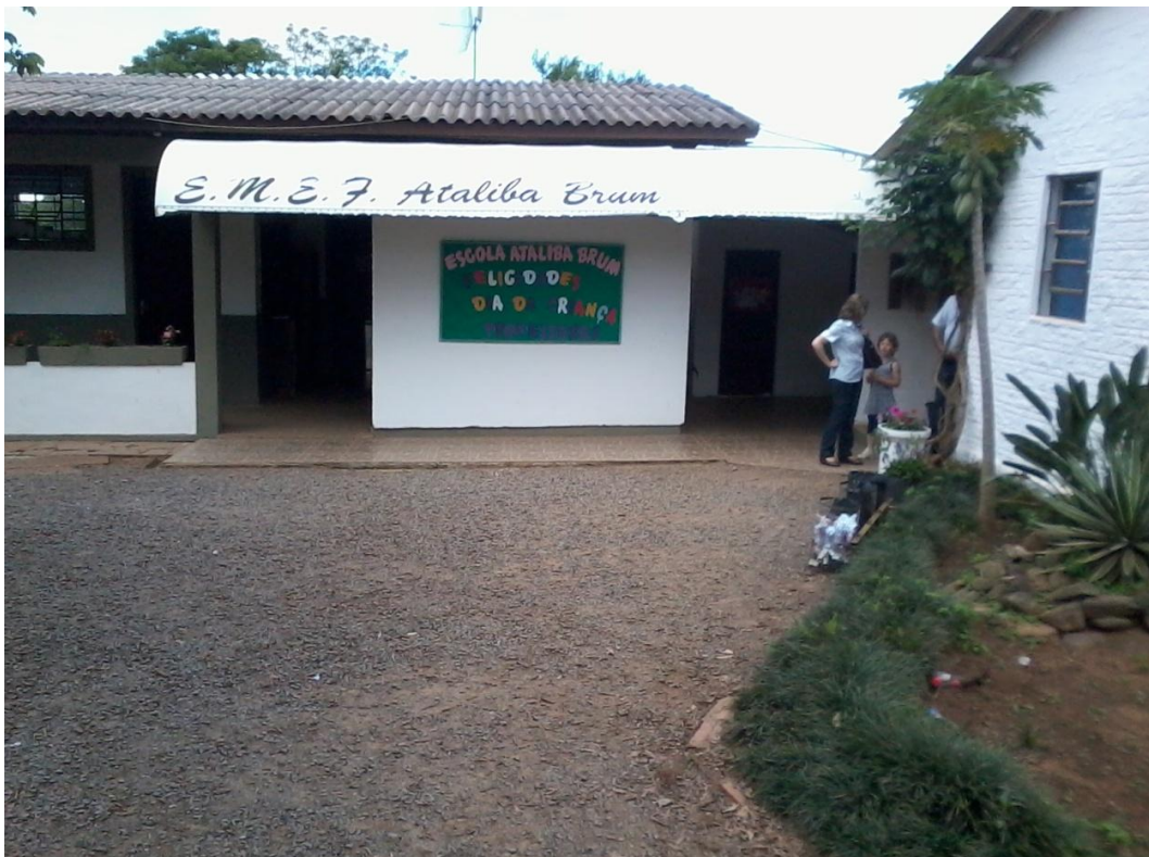
Figura 4 – Escola Ataliba Brum, outubro de 2013 (Cachoeira do Sul).