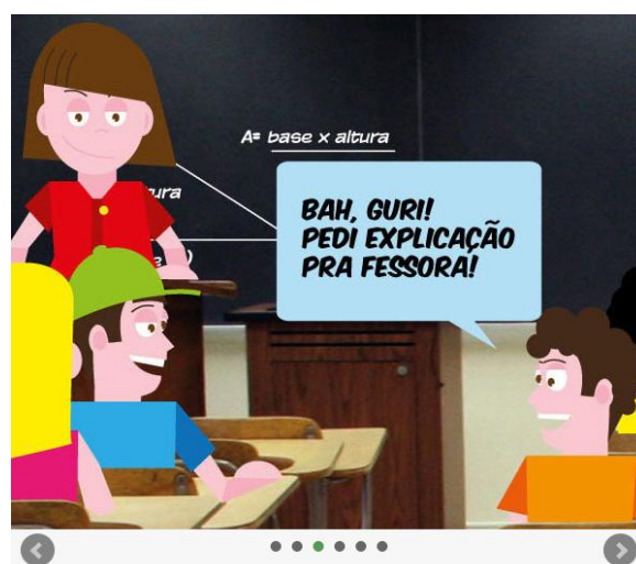
Figura 3 – HQ para o ensino da Matemática (MAIS UNIFRA, 2013)

Hoje em dia, devido a várias formas e gêneros que podem ser escritos e aos vários personagens nas mais variadas situações, além da facilidade de produção de mídias que os recursos digitais trouxeram à educação, as HQs se tornaram um interessante e divertido meio de aprendizagem para praticamente todas as áreas do conhecimento.