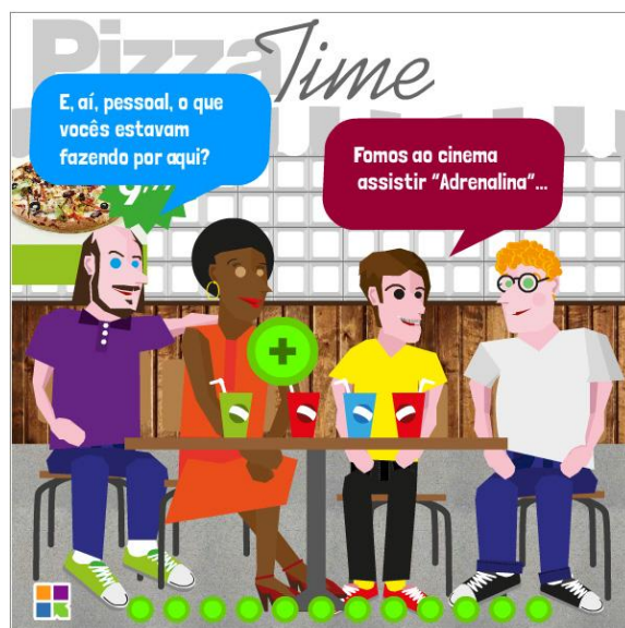
Figura 2 – HQ sobre “pragmática conversacional”, do curso de Letras (MAIS UNIFRA, 2013)