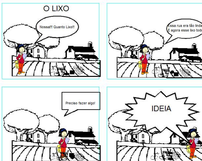
Figura 8 – História da atividade proposta

Aula 5 – A tarefa final foi terminar uma historinha sobre o meio ambiente que o professor já havia trabalhado anteriormente. O professor então salvou a pequena história em todos os computadores (Figura 8) e em duplas eles tiveram que terminar a história e depois apresentar para a turma suas criações.