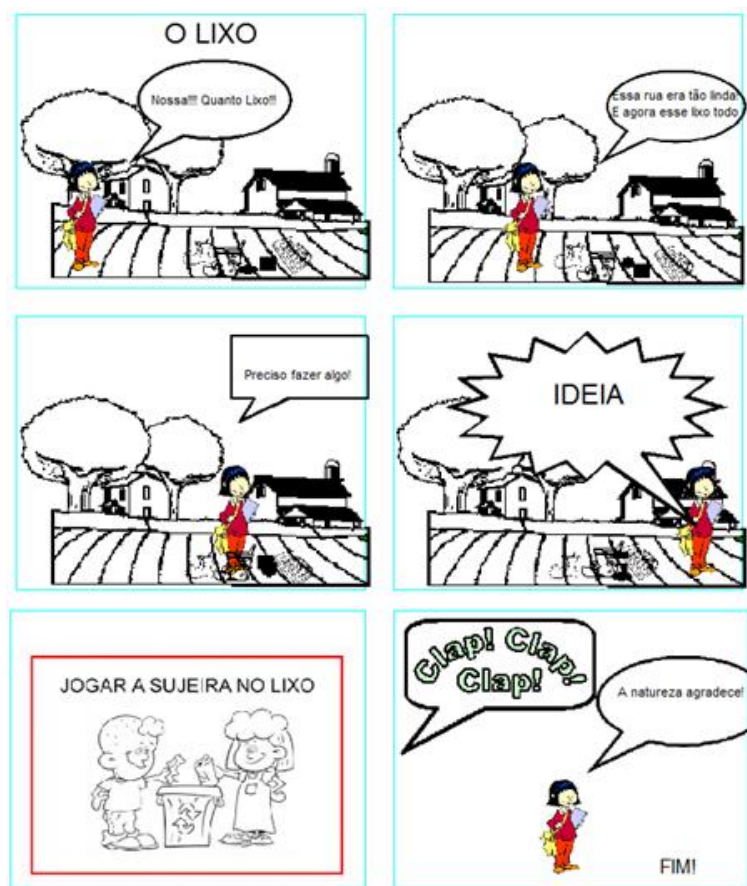
Figura 10 – Trabalho realizado pelos alunos

Para que fosse possível mensurar a qualidade da atividade, foi realizada uma última etapa em que a produção das HQs e a execução do exercício foram avaliados pelos professores.