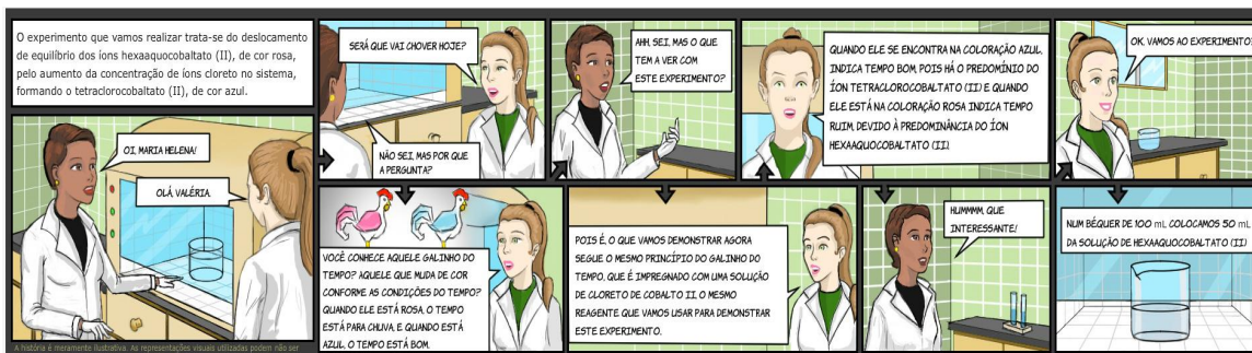
Figura 1 – HQ para o ensino de Química (MAIS UNIFRA, 2013)

Como exemplo, podemos citar o caso do Centro Universitário Franciscano, de Santa Maria, que possui um projeto onde os professores utilizam HQs para o processo de aprendizagem. Nas figuras 1, 2 e 3, é possível observar alguns exemplos: