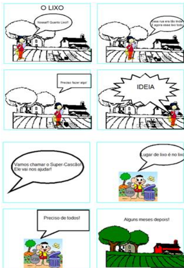
Figura 9 - Trabalho realizado pelos alunos

Algumas escolas não possuíam computadores suficientes para todos os alunos, por isso, as atividades foram planejadas para que pudessem tirar proveito desse fato, e assim as atividades foram desenvolvidas em duplas para que houvesse uma troca entre eles. É possível observar alguns exemplos de HQs produzidas pelos alunos (Figuras 9 e 10).