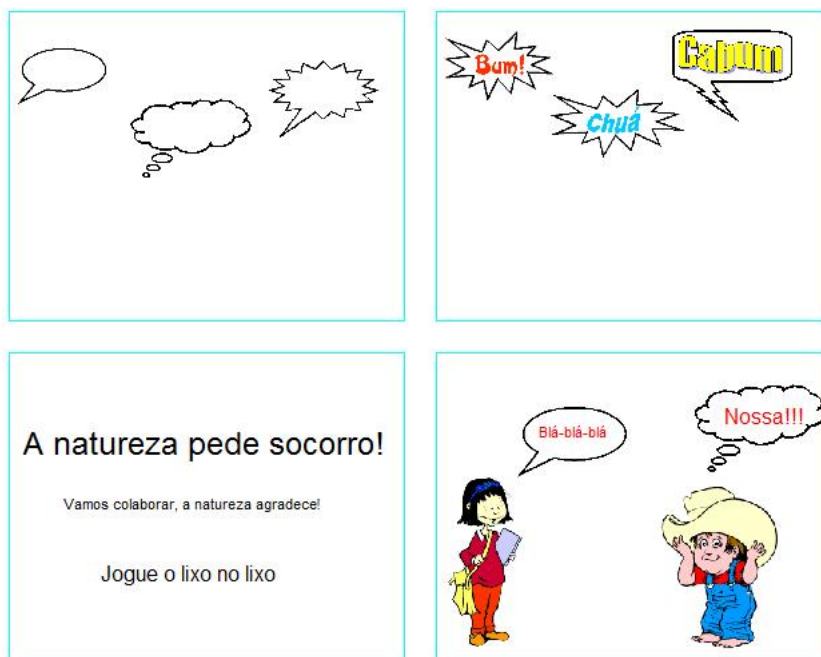
Figura 7 – Trabalhando com balões, onomatopeias, tamanho da letra.

Aula 5 – A tarefa final foi terminar uma historinha sobre o meio ambiente que o professor já havia trabalhado anteriormente. O professor então salvou a pequena história em todos os computadores (Figura 8) e em duplas eles tiveram que terminar a história e depois apresentar para a turma suas criações.