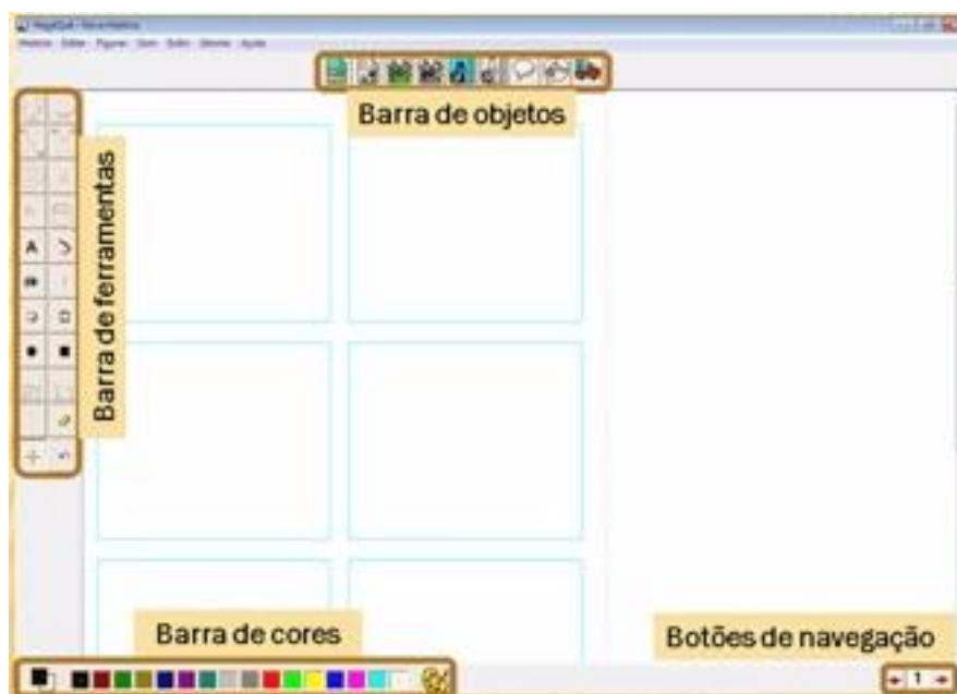
Figura 5 - Interface gráfica do software HagáQuê

Podemos observar na Figura 4 que o editor já nos oferece quadrinhos de tamanho padronizado e na Figura5 os recursos de edição oferecidos pelo programa.