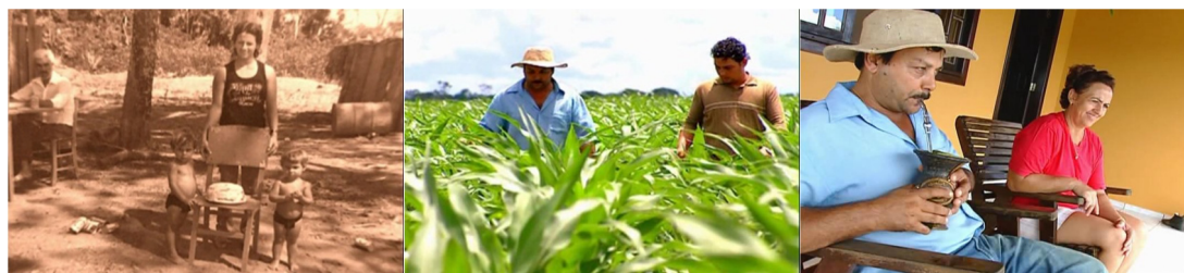
Figura 19. Episódio “Mato Grosso”, direção Rubens Bandeira.