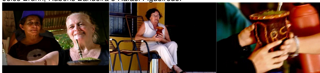
Figura 22. Episódios “Os gaúchos desbravadores”, “Os sonhos continuam” e “Origem”, direção de Joice Bruhn, Rubens Bandeira e Rafael Figueiredo.