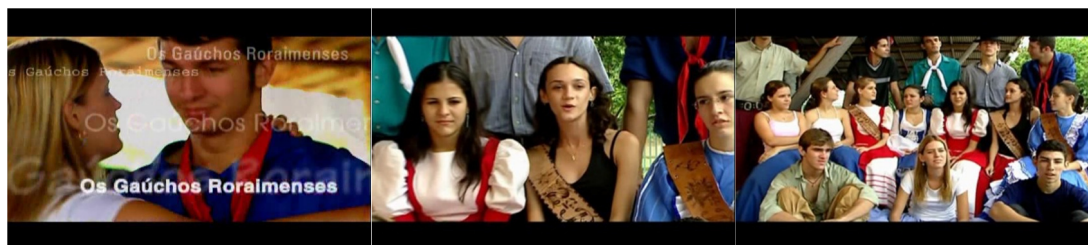
Figura 06. Episódio “Os gaúchos desbravadores”, direção Joice Bruhn.