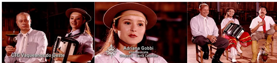
Figura 05. Episódio “Santa Catarina”, direção Rafael Figueiredo.