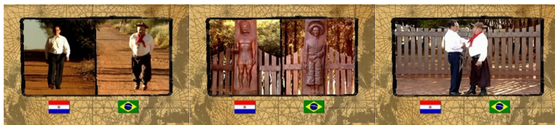
Figura 14. Episódio “Paraguai”, direção Rafael Figueiredo.

Fonte: Série de TV A Conquista do Oeste . RBS TV, 2004.