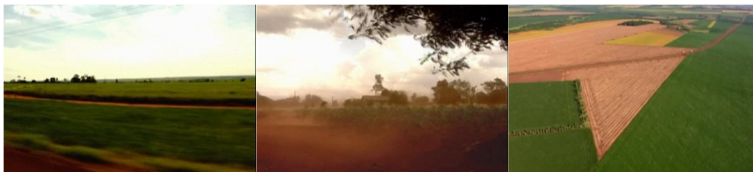
Figura 13. Episódio “Paraguai” direção Rafael Figueiredo.