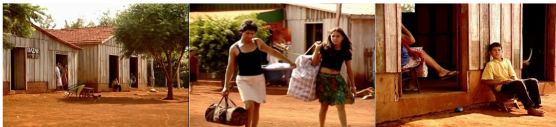
Figura 11. Episódio “Paraguai”, direção Rafael Figueiredo.