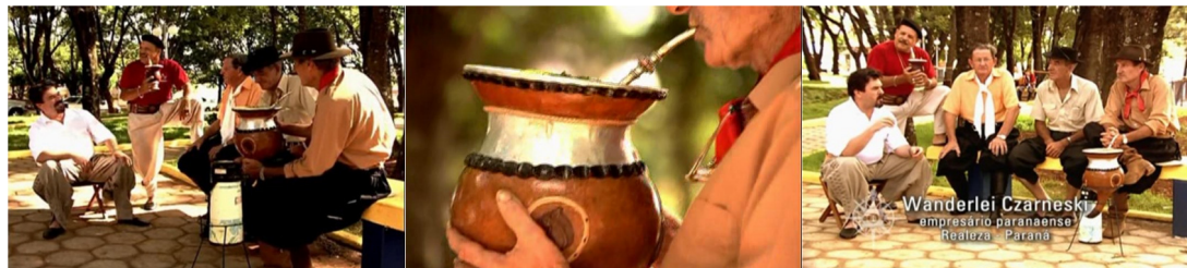
Figura 16. Episódio “Paraná”, direção Rafael Figueiredo.

Fonte: Série de TV A Conquista do Oeste . RBS TV, 2004.