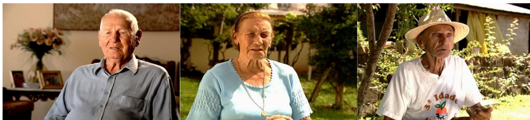
Figura 01. Episódio “Santa Catarina”, direção Rafael Figueiredo.