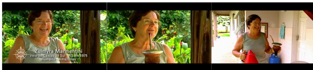
Figura 08. Episódio “E o pago virou floresta”, direção Joice Bruhn.