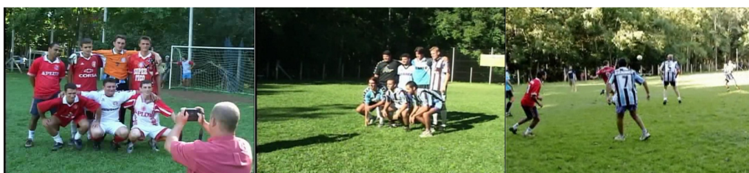
Figura 15. Episódio “Santa Catarina”, direção Rafael Figueiredo.