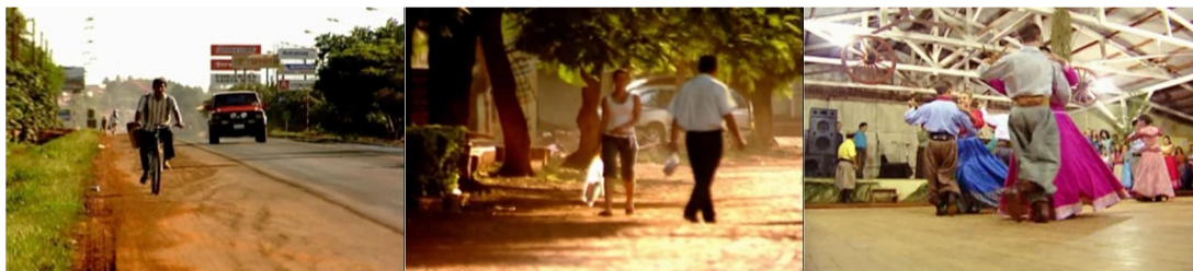
Figura 09. Episódio “Paraguai” direção Rafael Figueiredo.