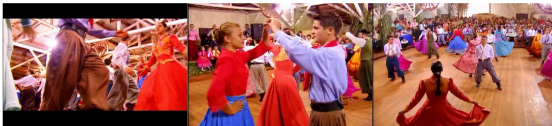
Figura 20. Episódio “Goiás”, direção Rubens Bandeira.