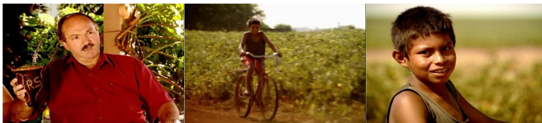
Figura 12. Episódio “Paraguai”, direção Rafael Figueiredo.