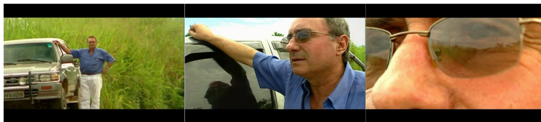
Figura 21. Episódio “E o pago virou floresta”, direção Joice Bruhn.