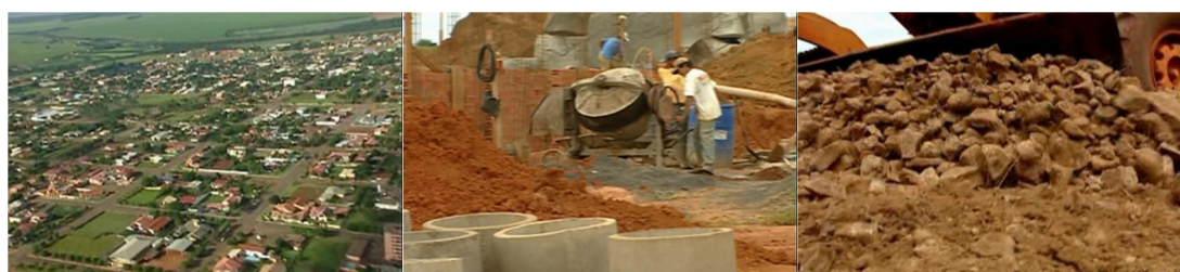
Figura 18. Episódio “Mato Grosso do Sul 2”, direção Rubens Bandeira.