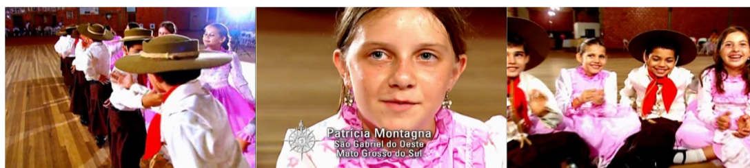
Figura 07. Episódio “Os sonhos continuam”, direção Rubens Bandeira.

Fonte: Série de TV A Conquista do Oeste . RBS TV, 2004.