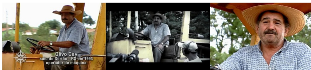
Figura 02. Episódio “Mato Grosso do Sul 2”, direção de Rubens Bandeira.