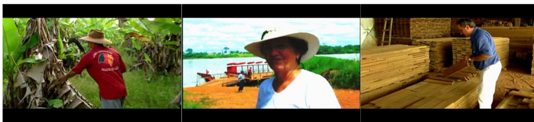
Figura 10. Episódio “E o pago virou floresta”, direção Joice Bruhn.