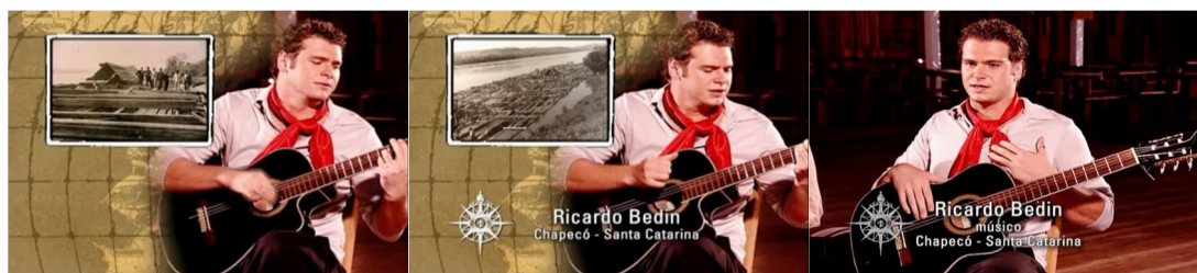
Figura 04. Episódio “Santa Catarina”, direção Rafael Figueiredo.