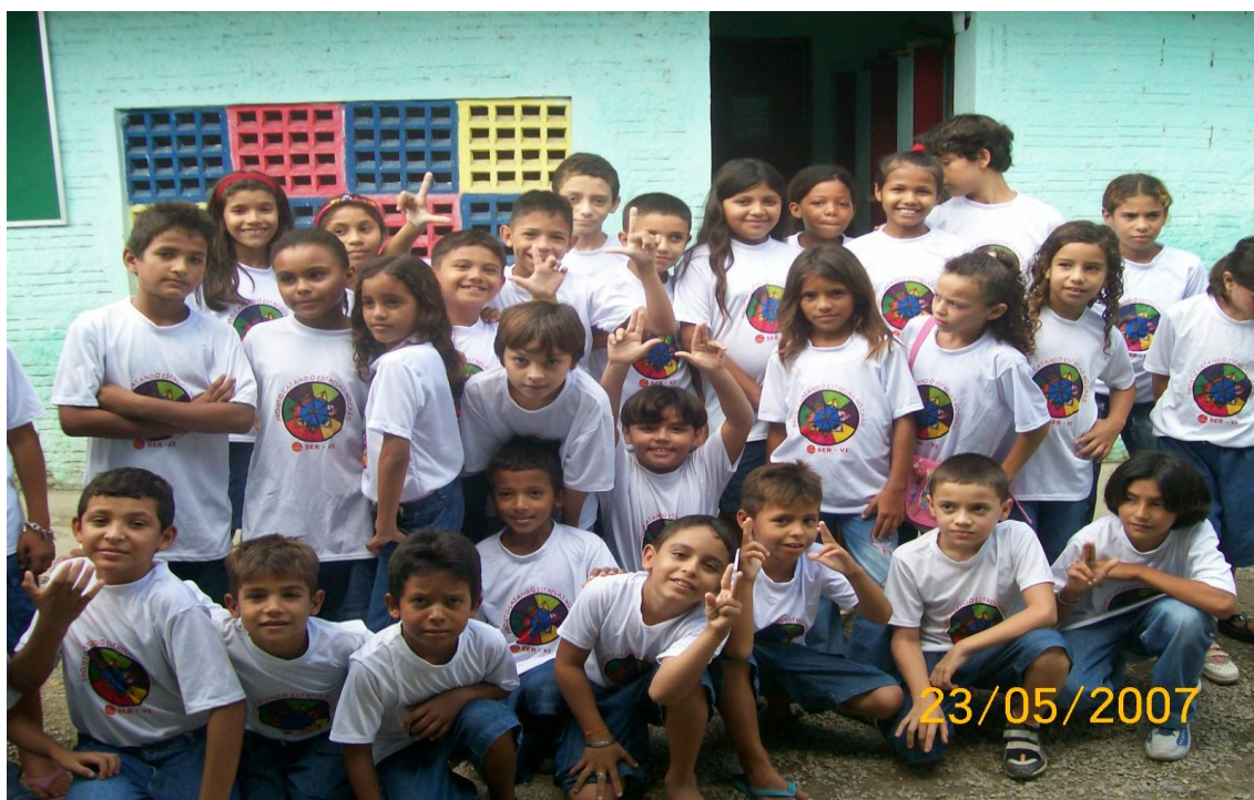
Foto 15. Preparação do Coral dos Alunos da EMEIF Bernadete Oriá de Oliveira para apresentação no Museu da Imagem e do Som (Fortaleza-CE)