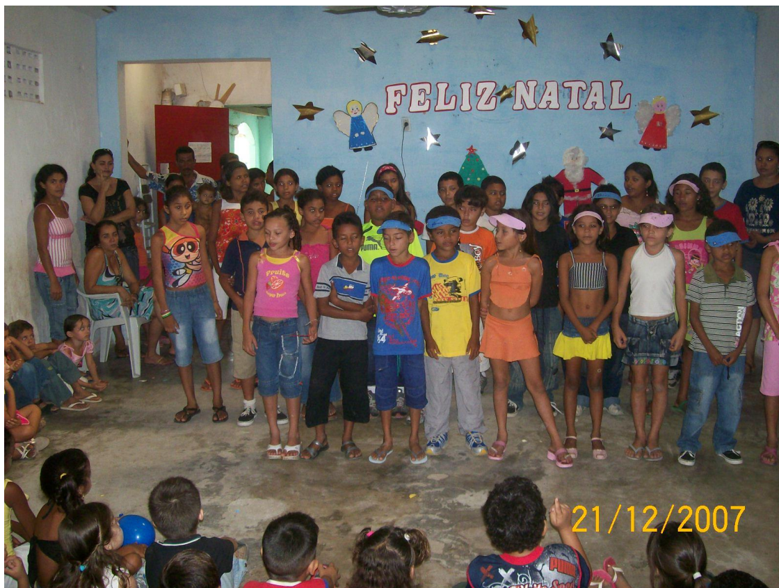
Foto 13. Apresentação do Coral dos Alunos da EMEIF Bernadete Oriá de Oliveira nas comemorações natalinas.

Fotos 11 e 12. Apresentação da feira cultural de atividades pedagógicas.