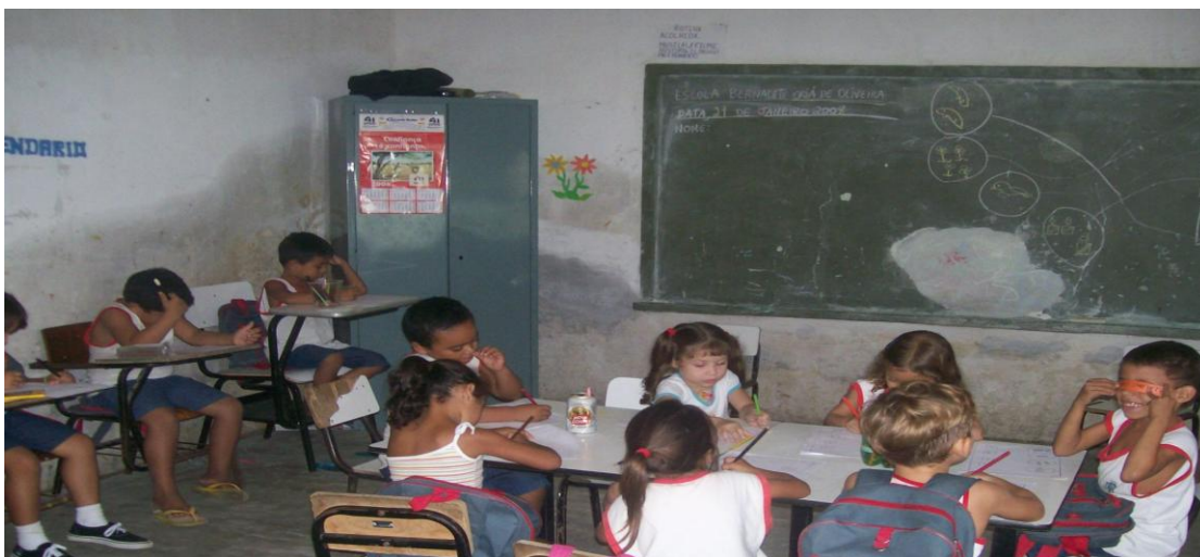
Foto 1. Salas de aula ( infiltrações, pouca luminosidade, infra-estrutura deficiente, inadequação de mobiliário