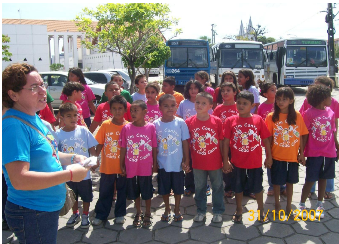
Foto 14. Apresentação do Coral dos Alunos da EMEIF Bernadete Oriá de Oliveira no Centro Dragão do Mar de Arte e Cultura (Fortaleza-CE)