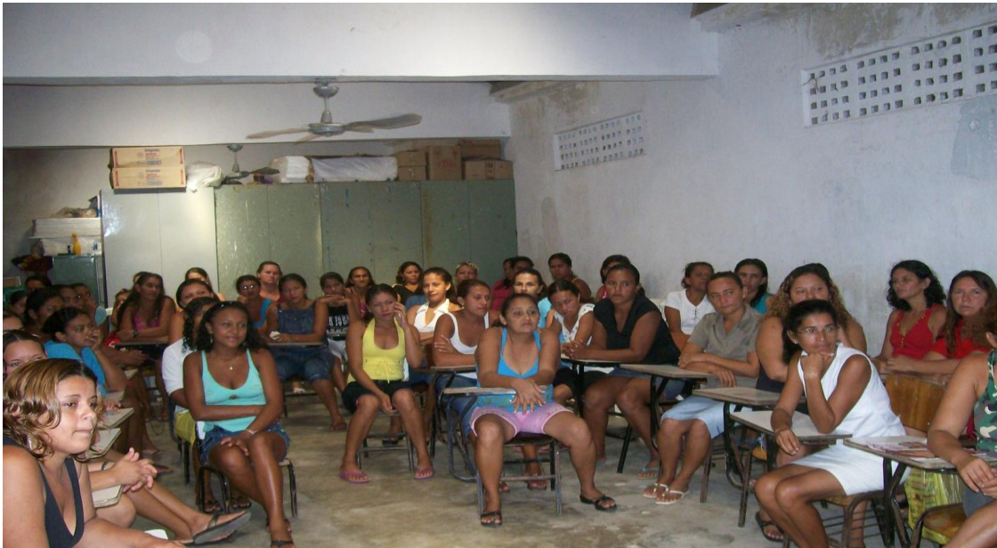
Foto 8. Reunião em comemoração ao dia das mães.