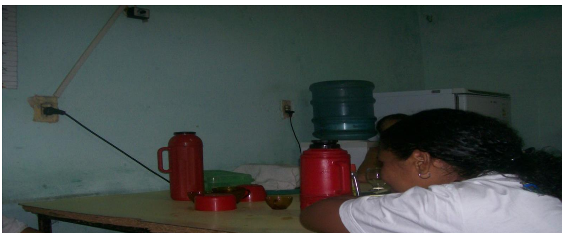
Foto 2. Sala dos professores e cozinha da escola, dividiam o mesmo espaço físico, em uma sala de 5m x 6m na escola.