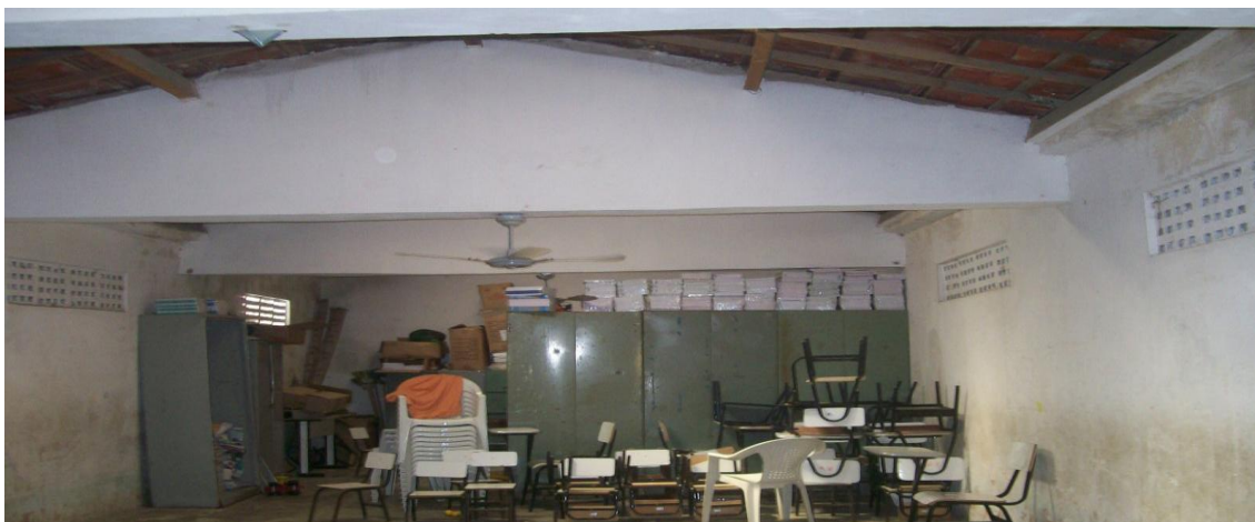
Foto 3. Espaço utilizado para área de recreação de todas as crianças da escola.