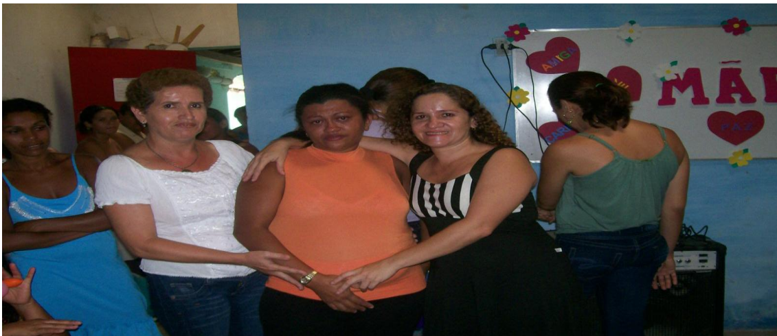
Foto 9. Reunião em comemoração ao dia das mães.