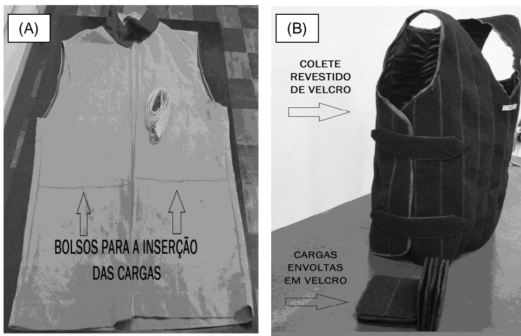
Figura 1. Coletes utilizados nas coletas de dados.

Os dois modelos de órtese possibilitam a mudança de carga e também de distribuição destas cargas, conforme a melhor resposta de estabilidade de tronco. Porém, o colete B tem a vantagem de poder distribuir as cargas em toda a sua superfície sem deslocamento das mesmas durante a marcha, enquanto que no colete A os pesos colocados nos bolsos sofrem pequenas oscilações durante a marcha.