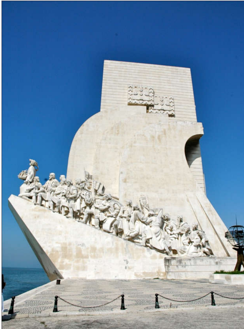
Figura 08 “Homenagem ao descobrimento”

Ao atravessar a praça em direção ao Rio Tejo, impossível não contemplar o Padrão do Descobrimento, um imponente monumento em forma de caravela que foi edificado em 1960 para homenagear aqueles que participaram das aventuras dos descobrimentos portugueses.