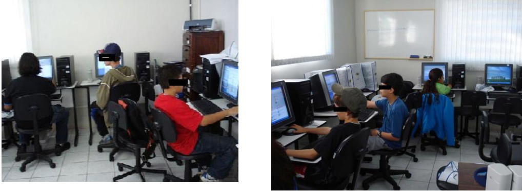
Figura 2 – Alunos desenvolvendo o Projeto de Aprendizagem no curso para tornar-se Aluno Monitor