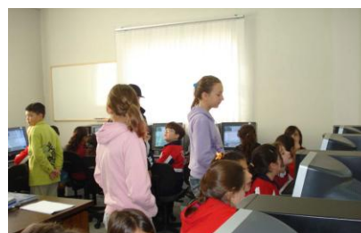
Figura 8. Alunos monitores interagindo com os alunos da terceira série.

A avaliação dos alunos da terceira série foi realizada pelo aluno monitor que assessorava o grupo, seguindo os critérios estipulados na Webquest e