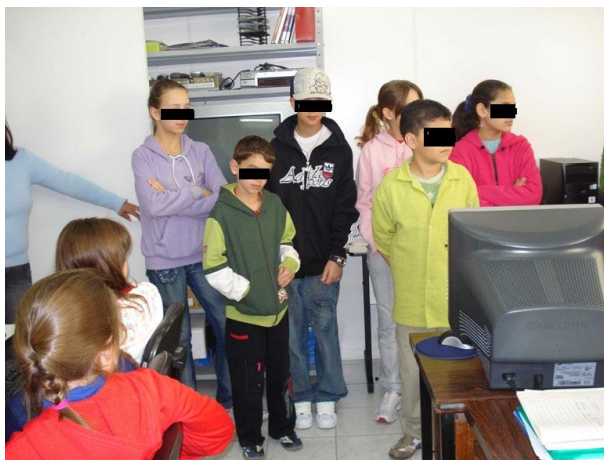
Figura 5. Alunos monitores ao receberem os alunos de terceira série no laboratório de informática do NTE, Cruz Alta, RS.

Na figura 5, aparece o grupo de alunos monitores no momento em que receberam os alunos da terceira série para implementar a atividade de Webquest .