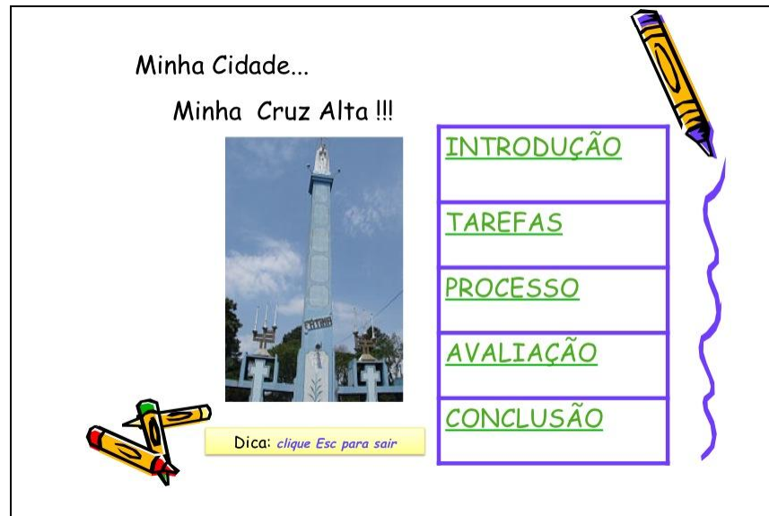
Figura 3 - Interface de apresentação da Webquest

A Webquest foi produzida pela professora-multiplicadora do NTE de Cruz Alta - RS, com o auxílio da professora da terceira série da Escola de Ensino Fundamental Dr. Gabriel Álvaro de Miranda. O conteúdo para a Webquest foi sugerido pela professora da turma, pois era o conteúdo que estava desenvolvendo na semana do aniversário do Município.