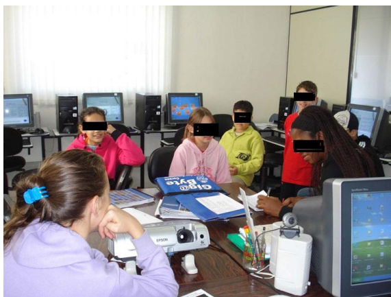
Figura 11. Entrevista com os alunos monitores

Depois de realizadas as atividades com os alunos da terceira série, os alunos monitores deram entrevista para o jornal da cidade, como mostra na figura 11, momento que demonstraram segurança ao falar sobre o que aprenderam ao participarem deste projeto.