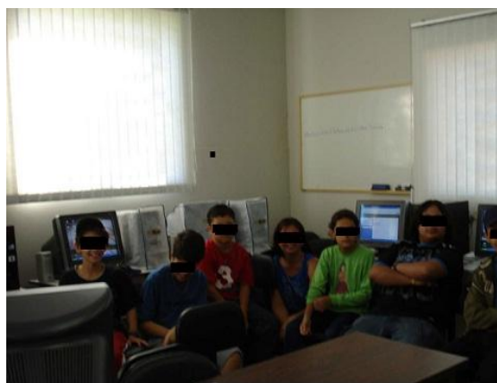
Figura 1 – Turma do Projeto Aluno Monitor

Abaixo, algumas fotos dos alunos da Escola Estadual de Ensino Fundamental Dr. Gabriel Álvaro de Miranda, que participaram do Projeto Aluno Monitor da primeira turma, com autorização dos pais e encaminhados pela direção da escola.