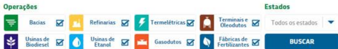
Figura 4 – Principais áreas de atuação.