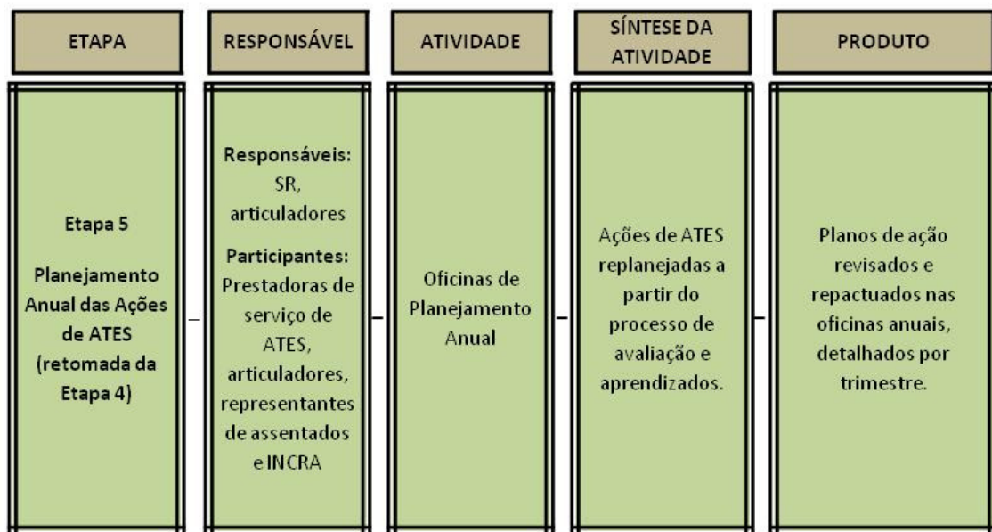
Figura 03 – Etapa 05 do Fluxograma de ATES

Além do planejamento inicial e dos planos de longo prazo apontados pelo PDA ou PRA anualmente o Manual de ATES solicita a realização de um planejamento anual das ações a serem desenvolvidas no assentamento como mostra a Figura 3. Tem a mesma caracterização do primeiro planejamento exceto por incumbir os Articuladores de ATES em conjunto com o INCRA pela realização das oficinas cabendo a equipe técnica e aos representantes dos assentamentos o papel de participação 4 .