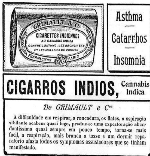
Figura 1: Propaganda e cigarros de maconha 7

Mesmo com algumas mudanças já na metade do século XIX, em que pesquisas internacionais, como a do Professor Jean Jacques Moreau, da França, sobre os efeitos hedonísticos da maconha eram divulgados, não tinham muita repercussão, ao contrário dos efeitos medicinais que até datados de 1905 médicos receitavam uso de cigarrilhas de maconha para tratamento de asma, bronquite e demais doenças respiratórias. Ainda, na década de 30,