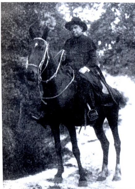
Figura 2- Meio de locomoção utilizado pelos padres na região da Quarta Colônia.