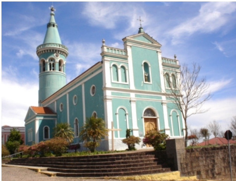
Figura 4 - Vista da fachada da igreja Matriz Santo Antônio de Pádua de Silveira Martins-RS.