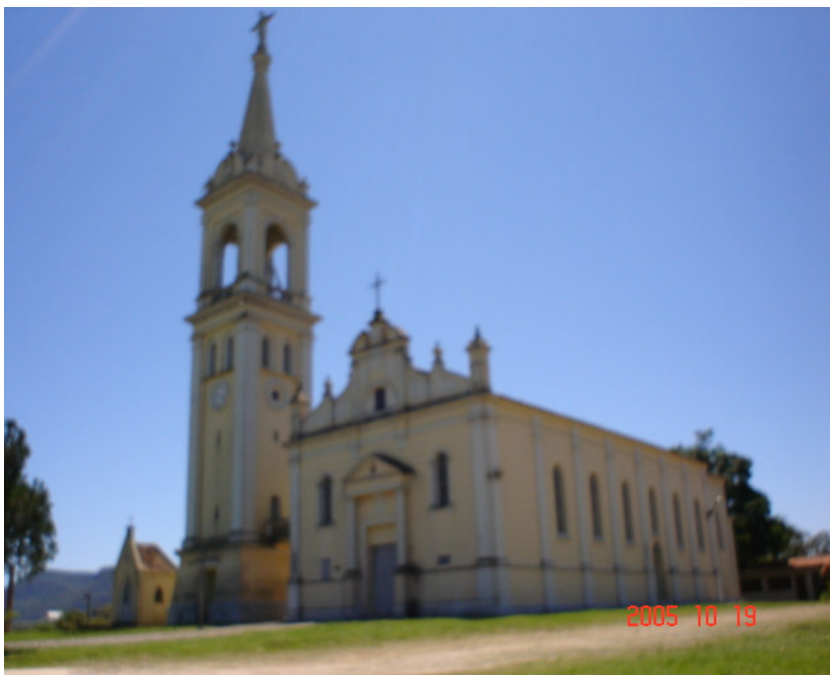
Figura 5 - Igreja Matriz São Pedro Apóstolo – município de Santa Maria-RS/distrito de Arroio Grande. Fonte: Foto da autora / outubro de 2008

A igreja matriz de Arroio Grande “São Pedro Apóstolo” foi construída em 11 de fevereiro de 1919 (CPGNP). A figura 5 mostra a igreja matriz, presença marcante da religiosidade na região.