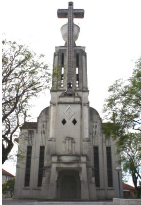
Figura 10 – Igreja Matriz São João Batista – São João do Polêsine-RS.