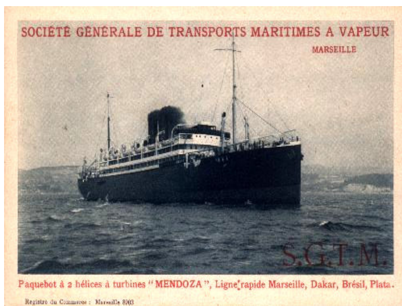
Figura 1- Vapor marítimo que trouxe os imigrantes italianos para a América no início do século XIX.

As transformações ocorridas no continente europeu, como o advento do capitalismo e da Revolução Industrial trouxeram como conseqüências a mecanização agrícola, o uso de uma mão-de-obra mais qualificada e, conseqüentemente, o desemprego. Além disso, o preço dos produtos agrícolas diminuía de ano a ano provocando uma baixa na produção. Desta forma “os produtos que eram a base da economia rural, como era o caso do trigo e do milho, tiveram seus preços rebaixados de forma alarmante ocasionando a diminuição na produção dos principais produtos agrícola.” (MANFROI, 2001, p.46). Daí surge à necessidade da imigração. A figura 1 mostra o meio marítimo de locomoção em que os imigrantes italianos vieram para a América, no início do século XIX.