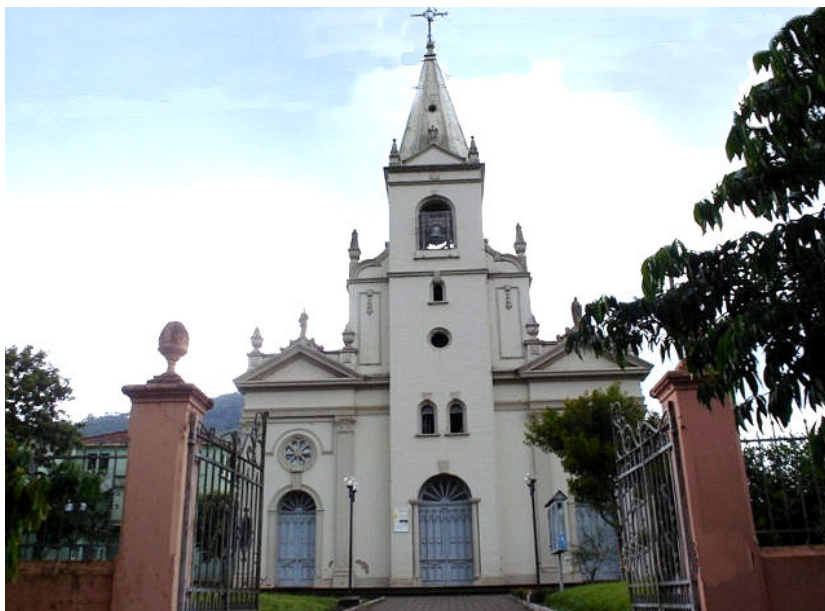
Figura 7 – Vista frontal da fachada da Igreja Matriz Santíssima Trindade – Nova Palma-RS.