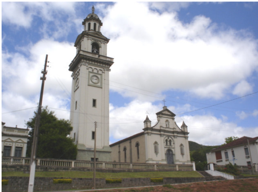
Figura 6 - Igreja Matriz da Paróquia São José – Ivorá-RS.