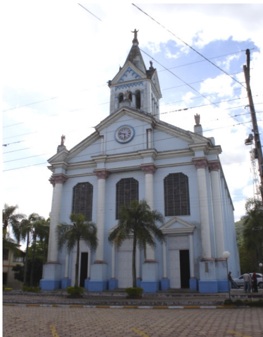
Figura 9 – Igreja Matriz São José – Dona Francisca-RS.