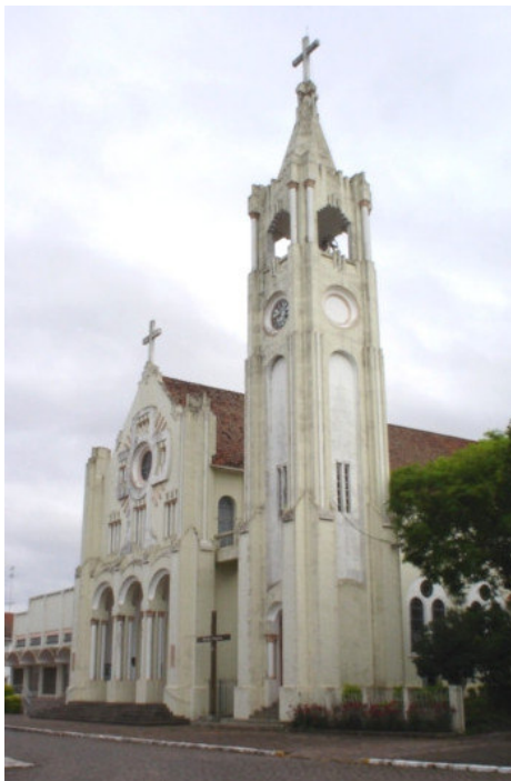
Figura 8 – Igreja Matriz São Roque – Faxinal do Soturno-RS.