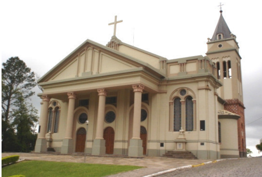
Figura 3 - Vista da fachada frontal da igreja Matriz Corpus Christi de Vale Vêneto-município de São João do Polêsine-RS.