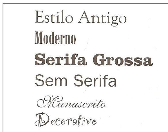
Figura 4: Exemplo dos seis principais grupos de tipografia.

Existem diversas variações de fontes. Nos editores de texto, por exemplo, aparecem três opções de estilo, caracterizadas como: Normal, Negrito e Itálico . Quanto ao tipo, de acordo com Williams (2005, p. 131), podemos caracterizar seis grupos como principais: estilo antigo, moderno, serifa grossa, sem serifa, manuscrito e decorativo, conforme Figura 4: