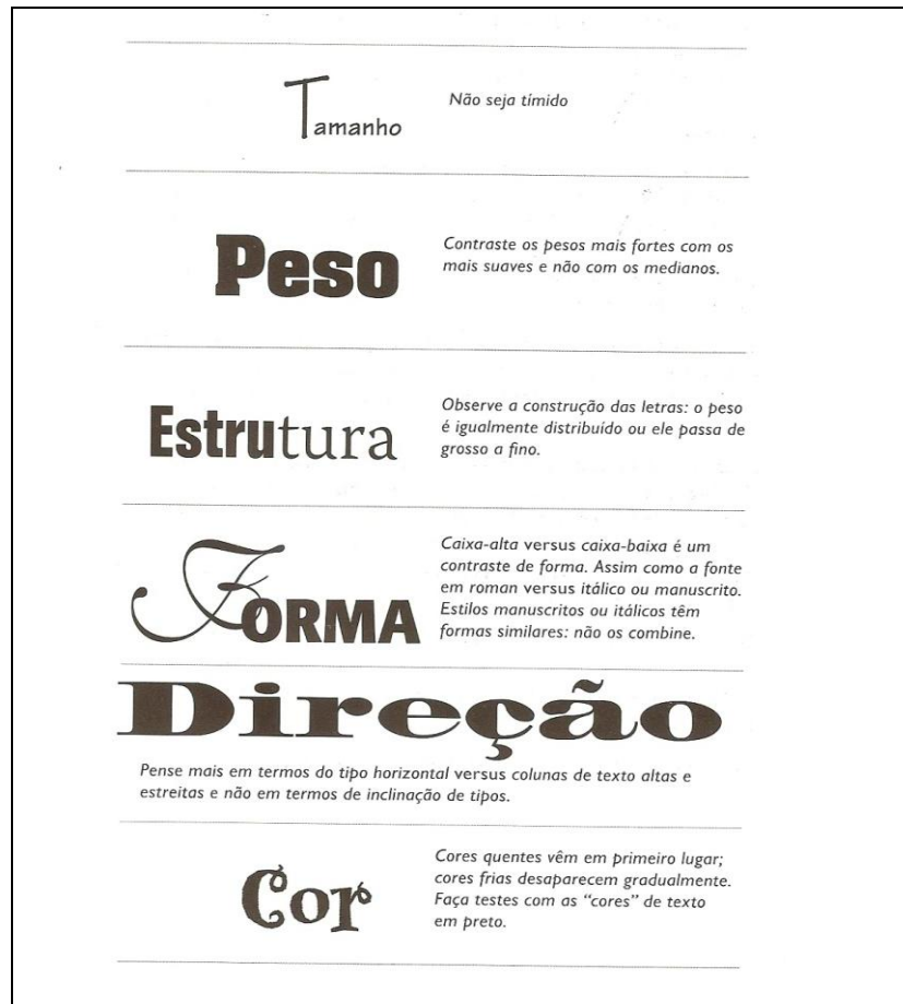
Figura 5: Características importantes a serem observadas em relação ao uso da tipografia.

Williams (2005, p.171), na obra Designer para quem não é designer , cita características importantes a serem observadas em relação ao uso da tipografia, conforme Figura 5: