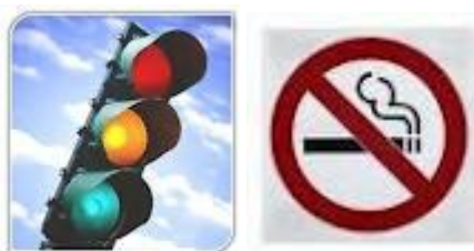
Figura 1: Exemplos de imagens que transmitem de forma direta seu sentido.

Assim como a escrita, as imagens têm a função de transmitir determinadas mensagens. Porém, as imagens expressam de forma mais direta o seu sentido, conforme Figura 1, sendo que sua interpretação dependerá da sensibilidade e do contexto que os receptores se inserem, segundo Samara (2010, p. 166): “Elas podem ajudar a esclarecer informações muito complexas – especialmente informações conceituais, abstratas ou orientadas por processos – exibindo-as concisamente ‘num piscar de olhos’”.