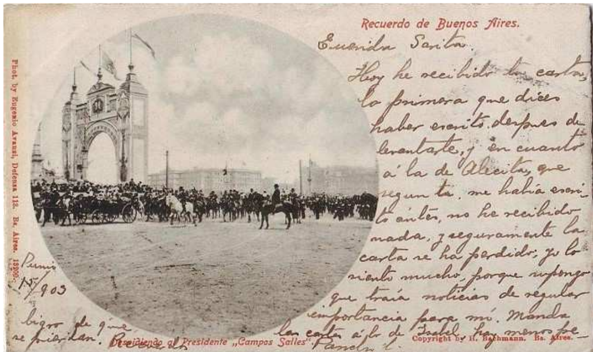
Figura 7 — Cartão postal comemorativo da visita de Campos Salles à Argentina em 1909.

Fonte: PALACIOS, Ariel. De Campos Salles a Dilma Rousseff: 111 anos de visitas presidenciais brasileiras na Argentina. Estadão , São Paulo, 30 jan. 2011. Disponível em: < https://internacional.estadao.com.br/blogs/ariel-palacios/de-campos-salles-a-dilma-rousseff-111-anos-de-visitas-presidenciais-brasileiras-na-argentina >. Acesso em: 06 ago. 2018.