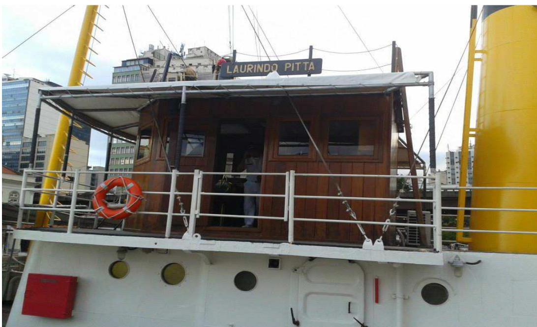
Figura 17 — Rebocador Laurindo Pitta, único navio integrante da DNOG disponível para visitas e passeios de turistas.