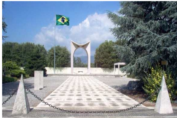
Figura 13 — Monumento aos Pracinhas da Força Expedicionária Brasileira na Segunda Guerra Mundial, em Pistoia, Itália.