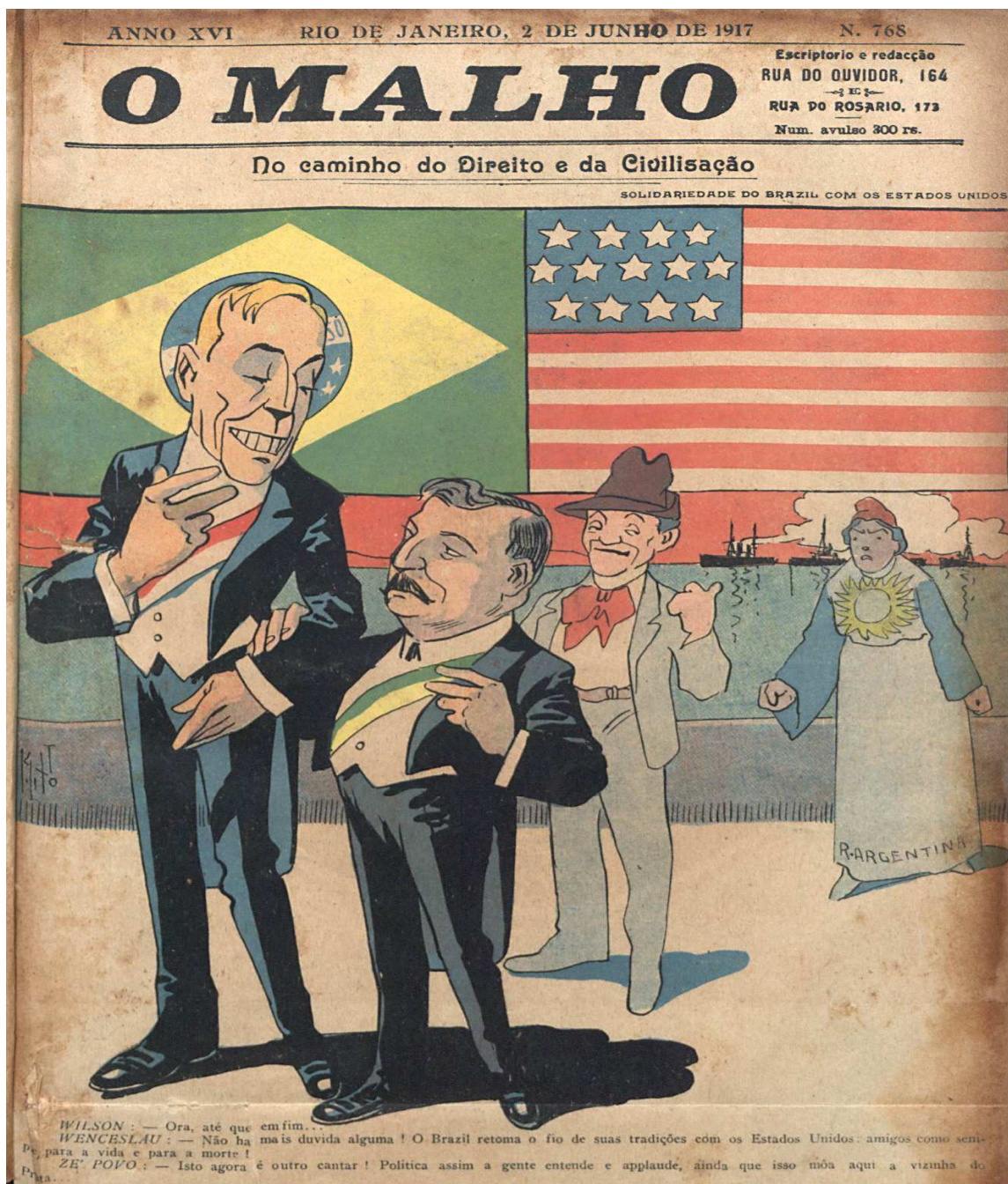
Figura 10 — Aliança do Brasil com os EUA na Primeira Guerra.