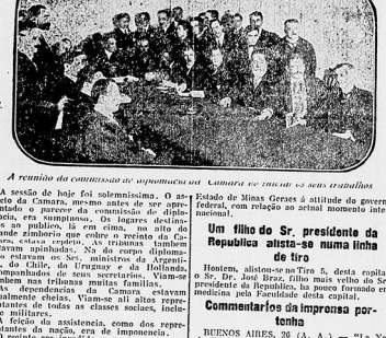
A reunião da comissão de homenagem ao Estado de Minas Gerais e ao atual governo federal, com relação ao atual momento internacional.

urgente e importante ter de ser tomado. A parte referente a "Minas" e "Estado de Minas" já foi feita. A parte referente a "Estado de Minas" já foi feita. A parte referente a "Estado de Minas" já foi feita. O Sr. Ruy Barbosa aplaude a atitude do governo O Sr. Ruy Barbosa, que teve a honra de ser o primeiro a levantar a voz em favor da declaração de guerra, aplaude a atitude do governo. Ele afirmou que a declaração de guerra é um ato de coragem e patriotismo, e que o Brasil deve lutar pela sua liberdade e pela liberdade do mundo.