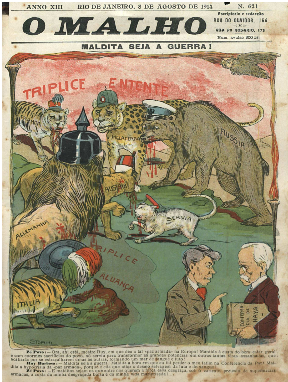
Figura 8 — Ruy Barbosa e a visão da Guerra como conflito entre civilização e barbárie, fiel aos princípios defendidos por ele na Segunda Conferência da Paz de Haya em 1907