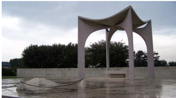
Figura 14 — Monumento aos Pracinhas da FEB, com pirâmide ao centro, onde repousam os restos mortais do soldado desconhecido, em Pistoia, Itália.

Fonte: Internet. Disponível em: < https://naopodemosparar.wordpress.com/2015/07/15/o-brasil-na-segunda-guerra-mundial/ >. Acesso em 10 mai. 2019.