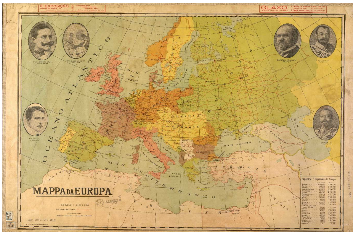
Figura 1 — Mapa da Europa em 1914 e suas principais lideranças.