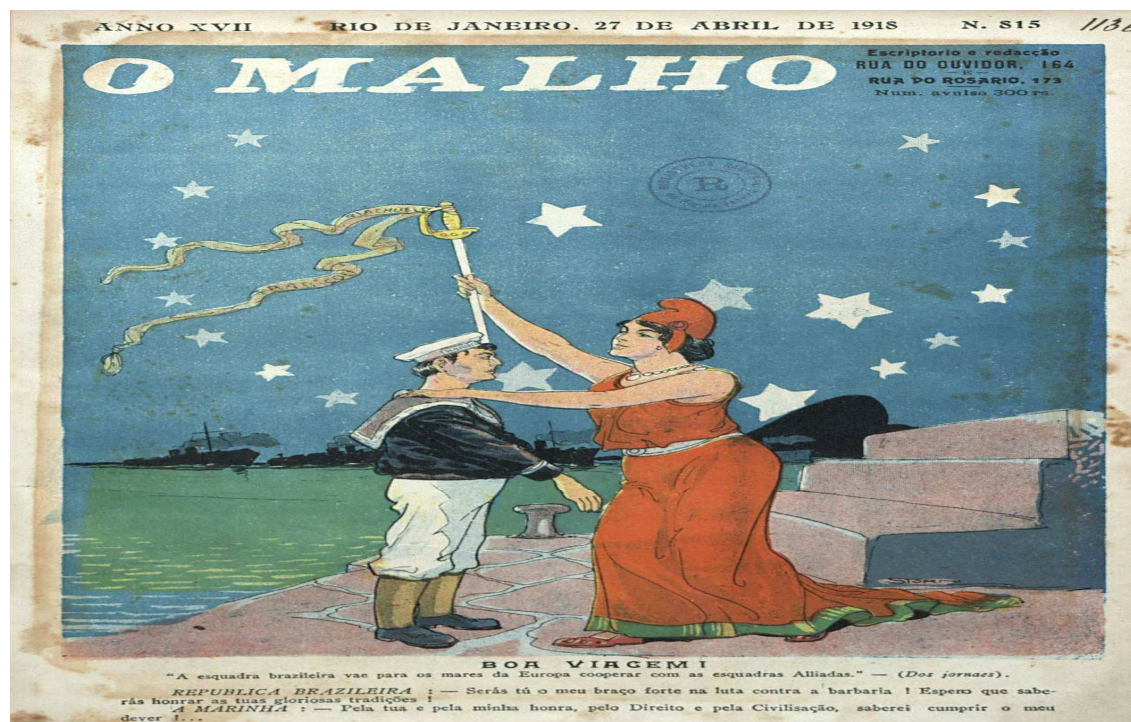
Figura 11 — Lançamento da DNOG

Fonte: Revista O Malho , Capa, Ano XVII, n. 815, Rio de Janeiro, 27 abr.1918. Disponível em:< http://memoria.bn.br/docreader/116300/36679 >. Acesso em 26 mar. 2019.