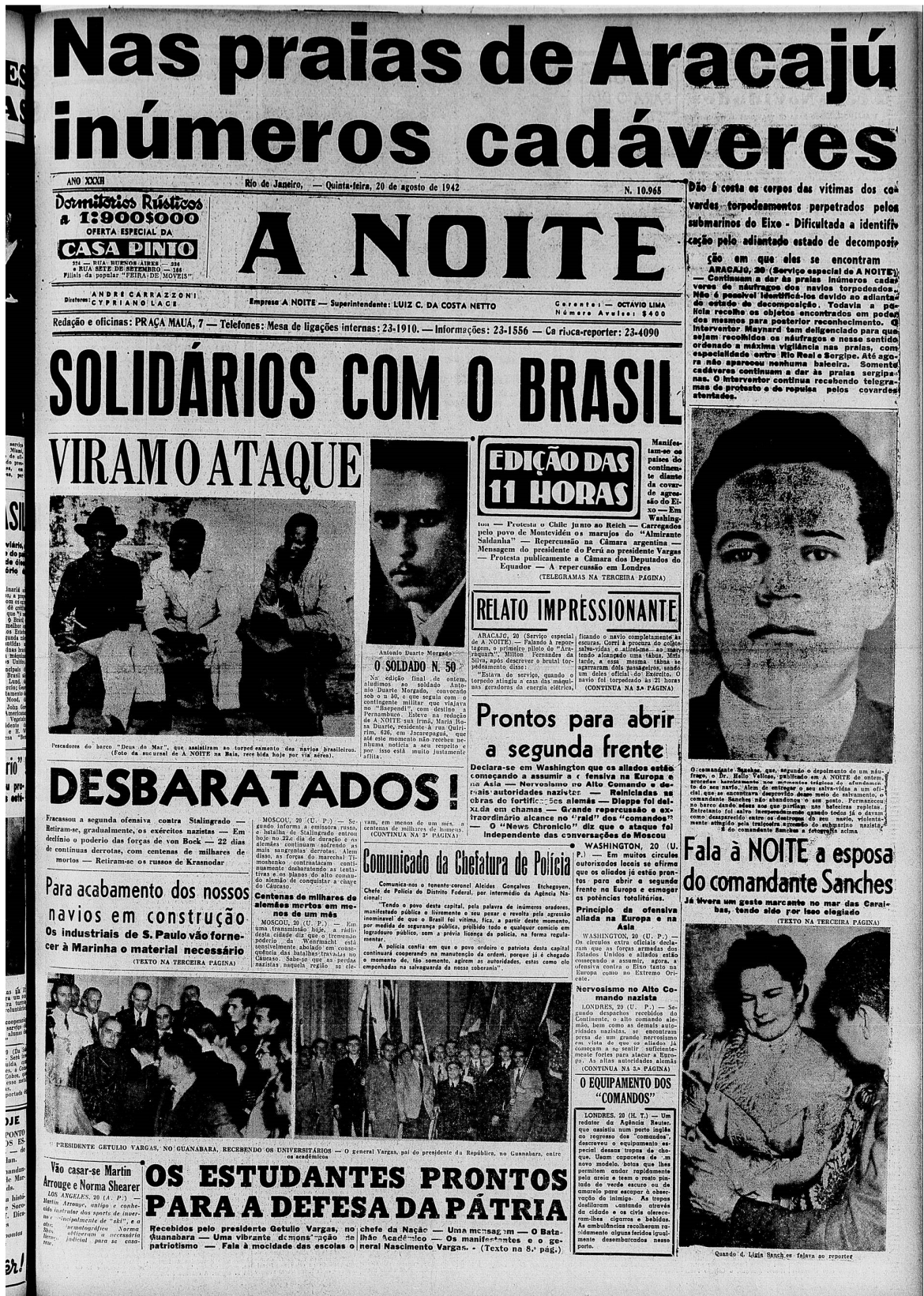
A Noite, capa, edição nº 10.965, 20 ago. 1942. Disponível em: FUNDAÇÃO BIBLIOTECA NACIONAL. Hemeroteca digital. <http://memoria.bn.br/DocReader/348970_04/16505>. Acesso em: 25 jul. 2018.