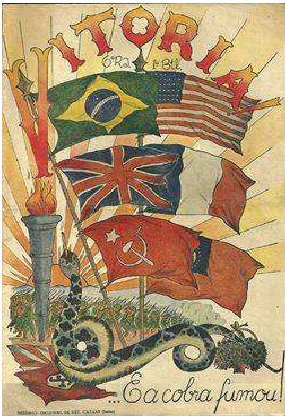
Figura 15 — O panteão do Brasil aparece junto às bandeiras das cinco potências da Pentarquia Global.