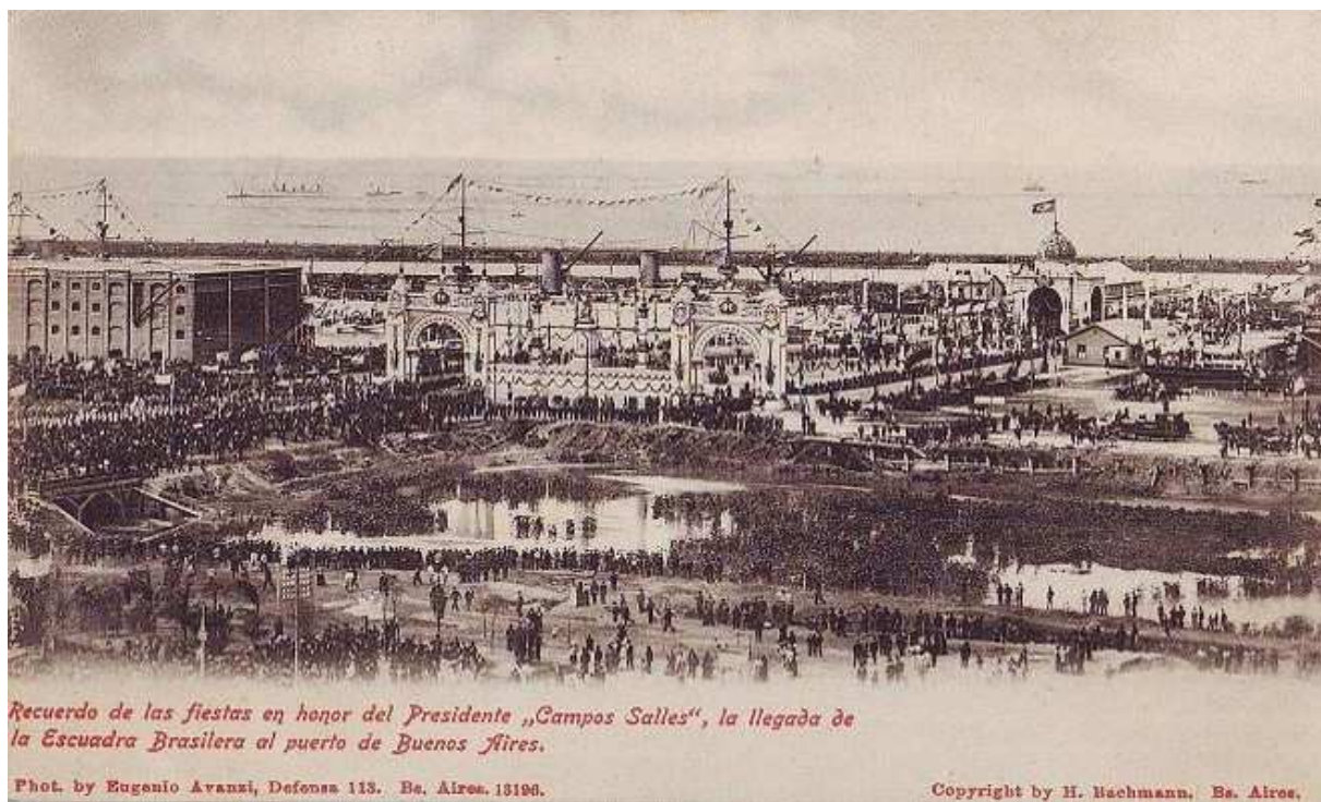
Figura 6 — Cartão postal comemorativo da visita de Campos Salles à Argentina em 1909.