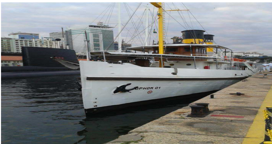
Figura 16 — Rebocador Laurindo Pitta, único navio integrante da DNOG disponível para visitas e passeios de turistas.

O rebocador Laurindo Pitta, último navio remanescente da esquadra da DNOG, serve nos dias de hoje como embarcação para passeios pela Baía de Guanabara (figuras 16 e 17) para muitos turistas que visitam o Rio de Janeiro.