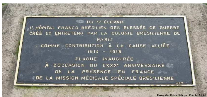
Figura 12 — Placa em homenagem ao hospital construído pela Missão Médica Militar do Brasil na Primeira Guerra Mundial, em Paris, França.

A memória em relação às participações brasileiras nas Guerras Mundiais é mantida por meio de homenagens feitas por onde o país deixou traços de sua contribuição, como é o caso da placa (figura 12) em frente ao hospital brasileiro construído em Paris e depois doado àquela cidade.