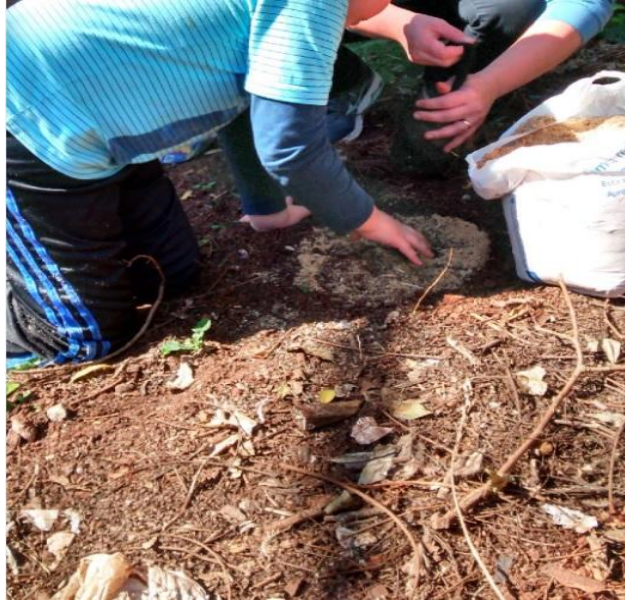
Figura 2 – Percepção dos diferentes elementos da natureza pelo aluno autista.