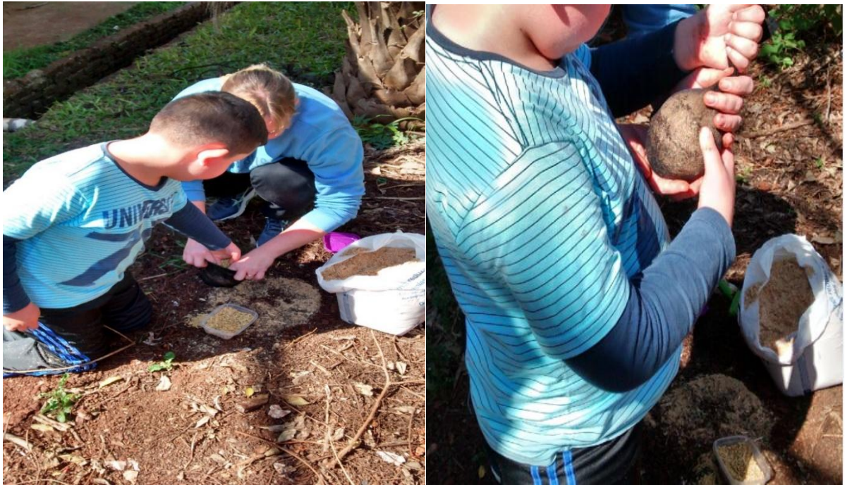
Figura 3 – Processo de enchimento e modelagem do boneco ecológico pelo aluno autista.