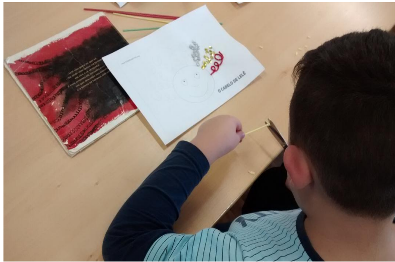
Figura 1 – Processo de recorte e colagem de material para confecção de um boneco ecológico pelo aluno autista.