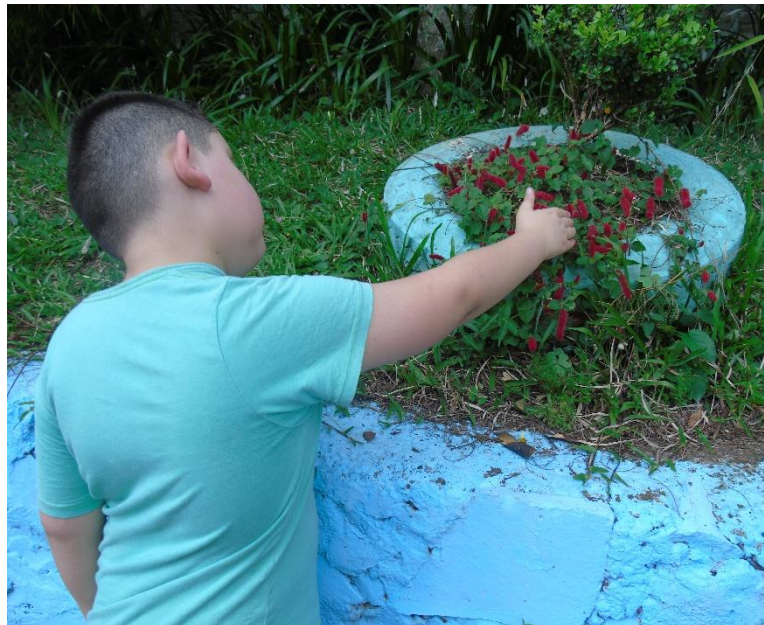
Figura 7 – Percepção de diferentes plantas pelo aluno autista.

As flores e diferentes plantas (Figura 7) adicionam um aspecto colorido e agradável ao ambiente, possuindo características variadas que podem ser percebidas pela contato físico e pela percepção visual. A partir do relato da professora, o educando mencionou ter percebido a cor vermelha da flor e a textura peluda e macia, sendo que ele ainda mencionou que a mesma pareceria ser cheirosa.