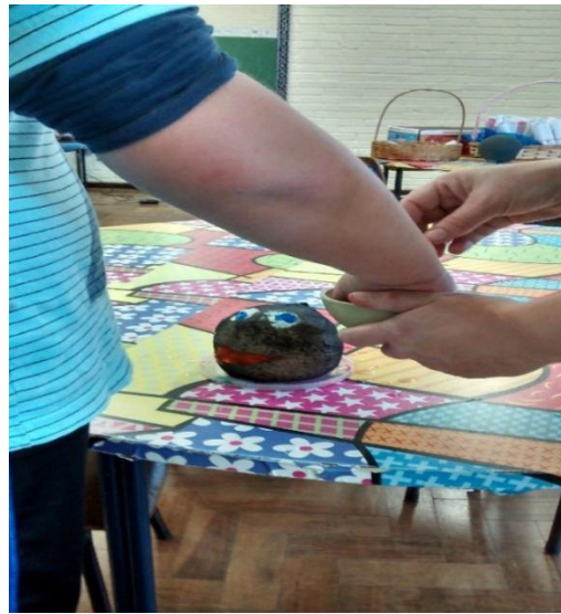
Figura 5 – Percepção do elemento água durante a atividade prática realizada pelo aluno autista.