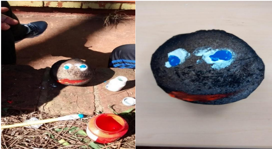
Figura 4 – Imagem do boneco ecológico finalizado pelo aluno autista.