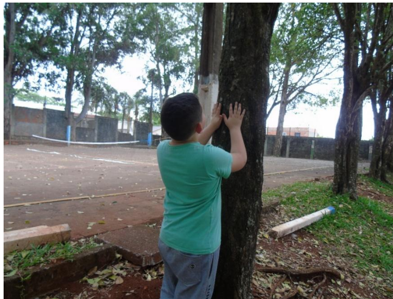
Figura 6 – Percepção da cor, altura, textura e forma das árvores pelo aluno autista.

Com isso, o estudante pode estabelecer contato físico com as árvores como uma forma de proporcionar a percepção da cor, altura, textura e sua forma, conforme pode ser observado na Figura 6.