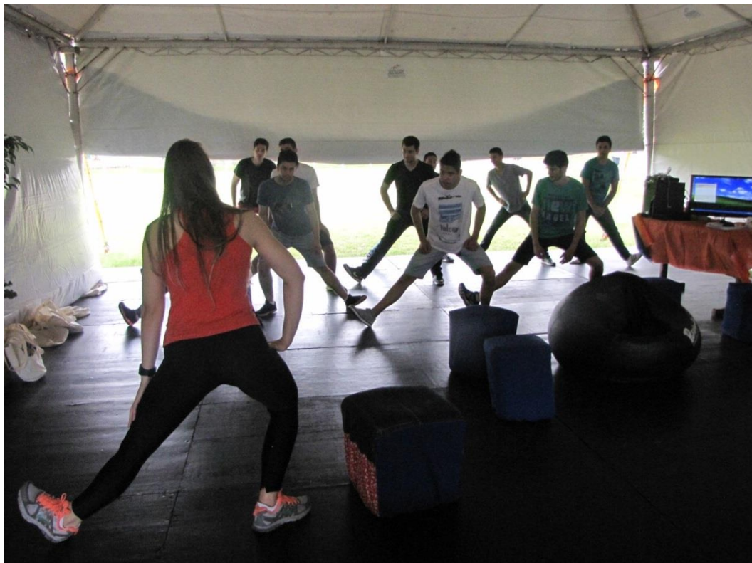
Foto 5: Atividade do Curso de Educação Física no lounge, agosto, 2014.