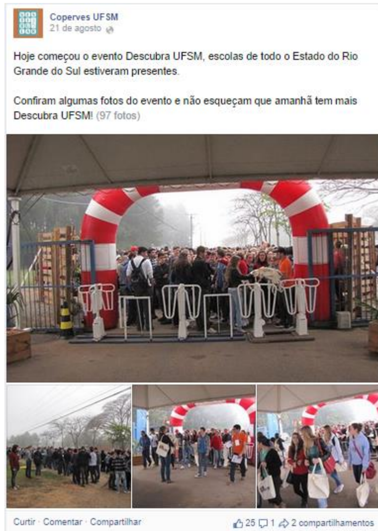
Foto 3: Postagem na Fan Page da COPERVES, agosto, 2014.

Agência como sugestão de temas a serem abordados na Fan Page do evento, que possuía uma linguagem mais descontraída. Assim, algumas notícias que precisavam de mais divulgação, como a publicação do cronograma das atividades culturais, eram enviadas para a imprensa em geral, através de um mailing 13 que havia nos documentos do estágio, do qual eu atualizei.