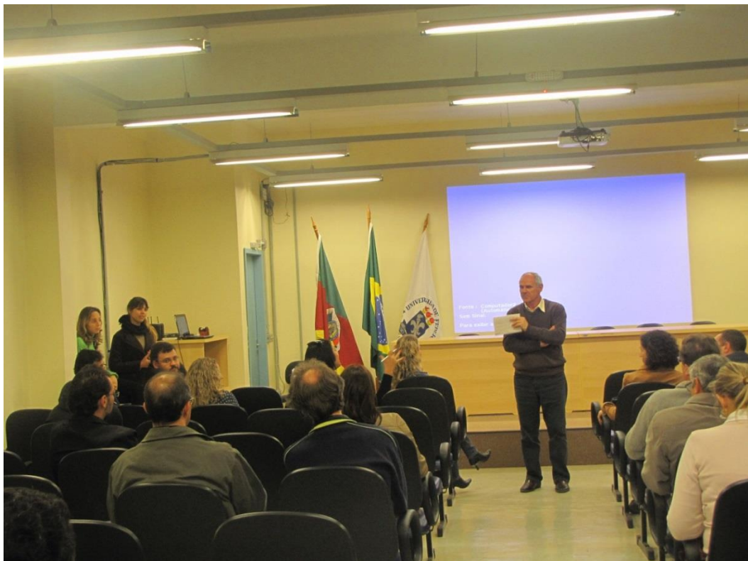
Foto 1: Foto da reunião sobre o evento, junho, 2014.