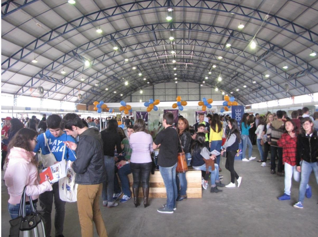
Foto 8: Estudantes no pavilhão da mostra dos cursos, agosto, 2014.

Em relação ao resultado do questionário aplicado, 1.130 pessoas responderam o questionário e consideraram o evento muito bom. Em relação a pergunta que questionava se o Descubra UFSM ajudou na escolha do curso de Graduação, 98% dos entrevistados disseram que sim. Dessa forma, acredito que o evento cumpriu com o seu propósito, a COPERVES trabalhou a imagem da instituição Universidade Federal de Santa Maria, promovendo a sua identidade organizacional perante a opinião pública e a sociedade e isso só ocorreu com o esforço de todas as pessoas envolvidas.