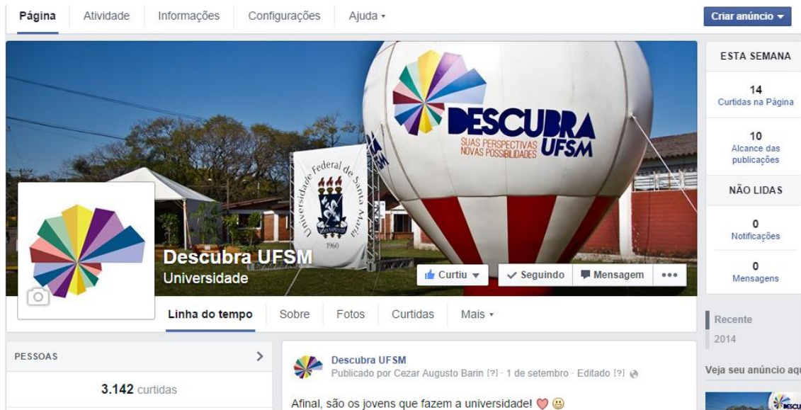
Foto 2: Fan Page oficial do evento, setembro, 2014.