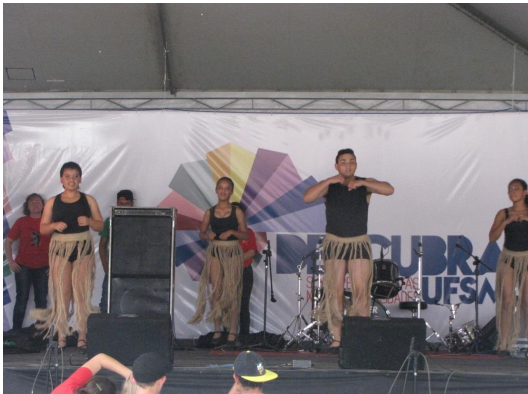
Foto 6: Uma das atividades culturais realizada no palco principal, agosto, 2014.

No dia do evento, fiquei responsável por fazer a cobertura fotográfica dos três dias (foto 6), tirei fotos de todos locais e ações que pude, tanto para divulgar nos meios de comunicação da COPERVES, quanto para ter um registro de imagens e também cuidei das atividades do lounge , verifiquei se não faltaria algo para as oficinas e também pedi aos bolsistas da Rádio Park, uma rádio que anunciava as ações do evento, de anunciar mais vezes essas atividades para chamar o público sempre que necessário.