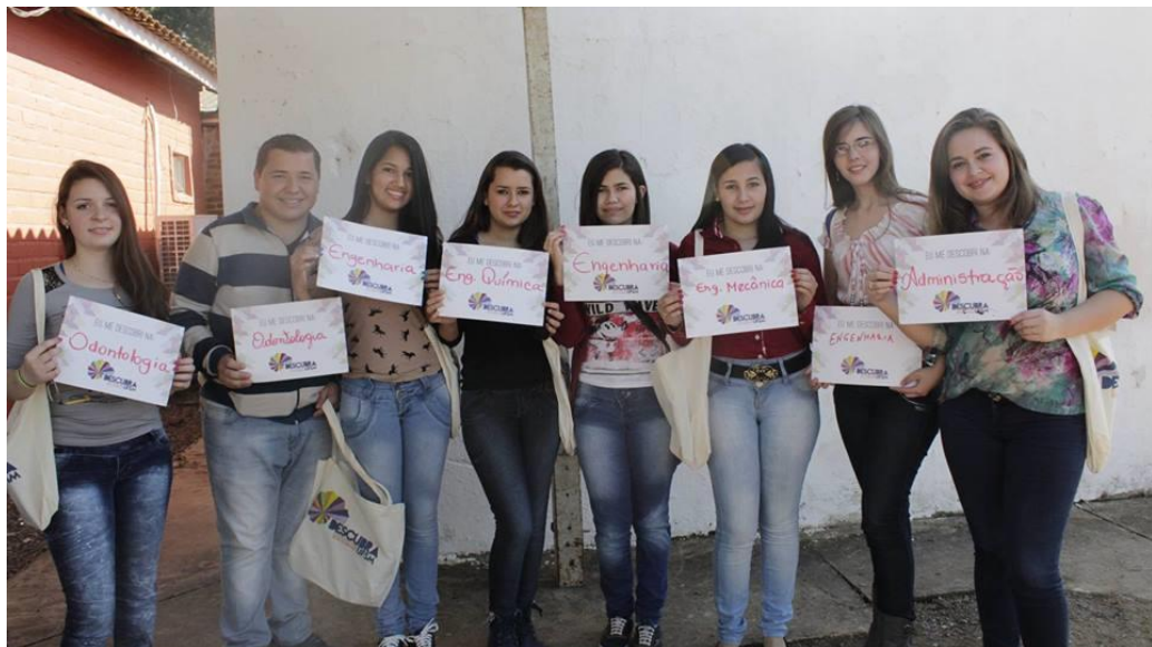
Foto 7: Ação das placas “eu me descobri na”, agosto, 2014.

Visando ações interativas com o público-alvo foram criadas ações para esse fim, como por exemplo, a ação das placas (foto 7), do qual estudantes respondiam na placa: “Eu me descobri na”, dessa forma os participantes preenchiam o nome do curso que havia interesse de cursar e tiravam uma foto. A Multiweb foi responsável por essa ação, eu fiquei responsável por divulgar na Fan Page da COPERVES e por repassar essas para os integrantes da Facos Agência publicarem na Fan Page do evento, como resultado ocorreram diversos comentários sobre o assunto, promovendo a interação com os internautas, mostrando o impacto positivo do evento também nas redes sociais.