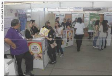
Descubra UFSM contou com diversas atrações que atraiu o público.

Os espaços do Centro de Eventos foram ocupados pelos cursos de graduação da UFSM, além dos campi descentralizados, Colégio Politécnico, Colégio Técnico Industrial (Ctiso), Editora, Gráfica e Livraria UFSM, Hospital Universitário (Husm), Hospital Veterinário, Núcleo de Tecnologia Educacional (NTEA), Secretaria de Apoio Internacional (SAI)