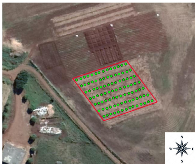
Figura 1 – Área experimental e pontos amostrais. Frederico Westphalen – RS

A área experimental possuía uma dimensão de 49 x 49 metros, com uma área total de 2401 m 2 . A área foi dividida em 7 faixas retangulares com 49 x 7 metros, cada faixa recebeu um sistema de manejo outono/inverno com diferentes plantas de cobertura, solteira ou consorciadas durante três anos consecutivos (Figura 1), sendo essas: Avena strigosa (AP), Avena sativa (AB), Raphanus sativus (NF), Secale cereale (CE), Vicia sativa (EC), Pisum sativum (EV).