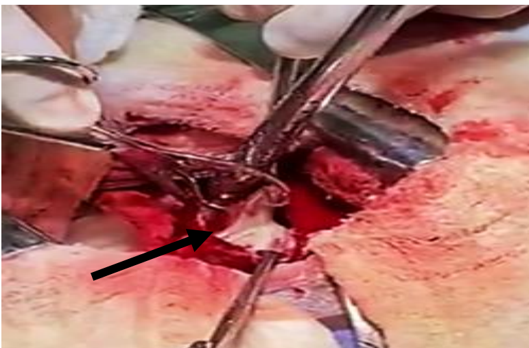
Figura 2–Remoção do osso (seta preta), com auxílio de pinça hemostática de crille e chumaco de gaze em uma Labrador, fêmea de 2 anos de idade.