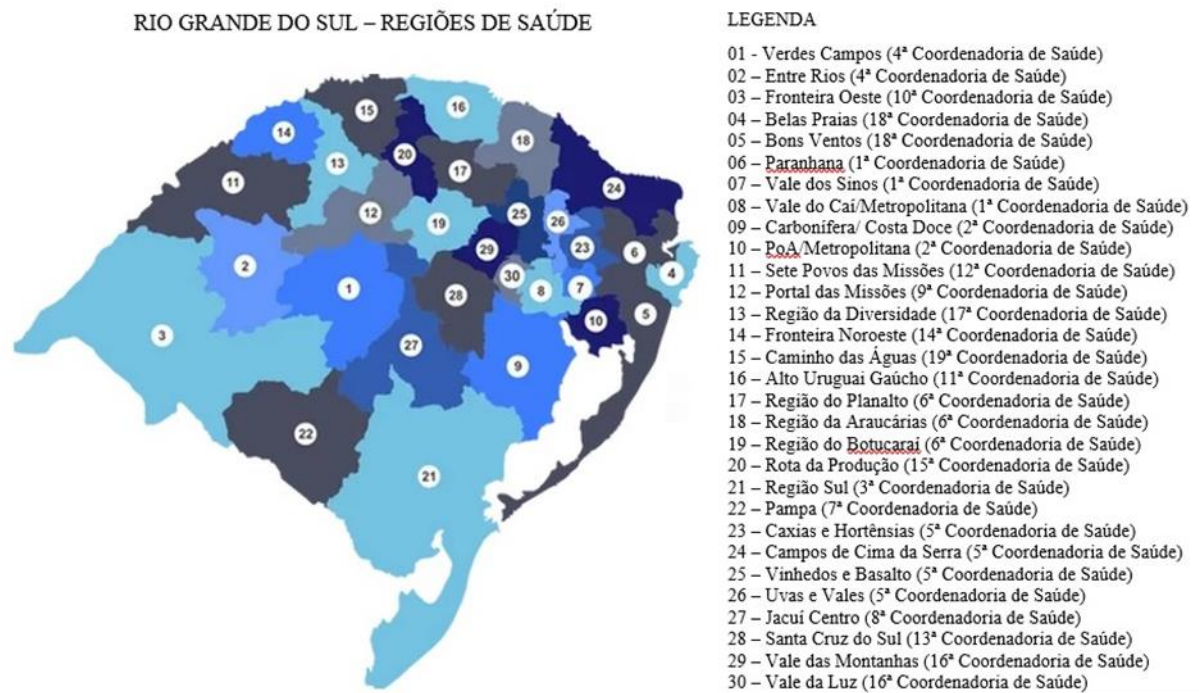
Figura 2 - Mapa das Regiões de Saúde do Rio Grande do Sul