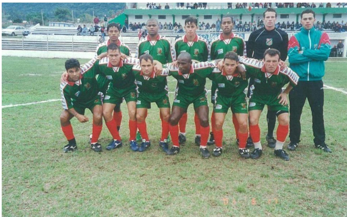
Figura 3-Equipe principal em 2001 com a camiseta verde e encarnada

As camisetas de cores verde e encarnada foram usadas pela primeira vez em 12 de junho de 1913. Por falta desta foto do ano de 1913, escolhi uma foto de 2001 para mostrar as cores da camiseta do clube.