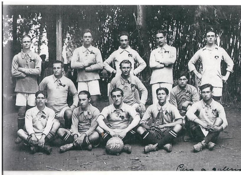
Figura 2- Time campeão do Cidadino em 1919.