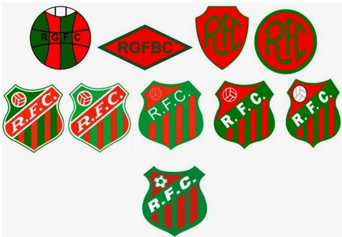
Figura 7- Escudos do Riograndense