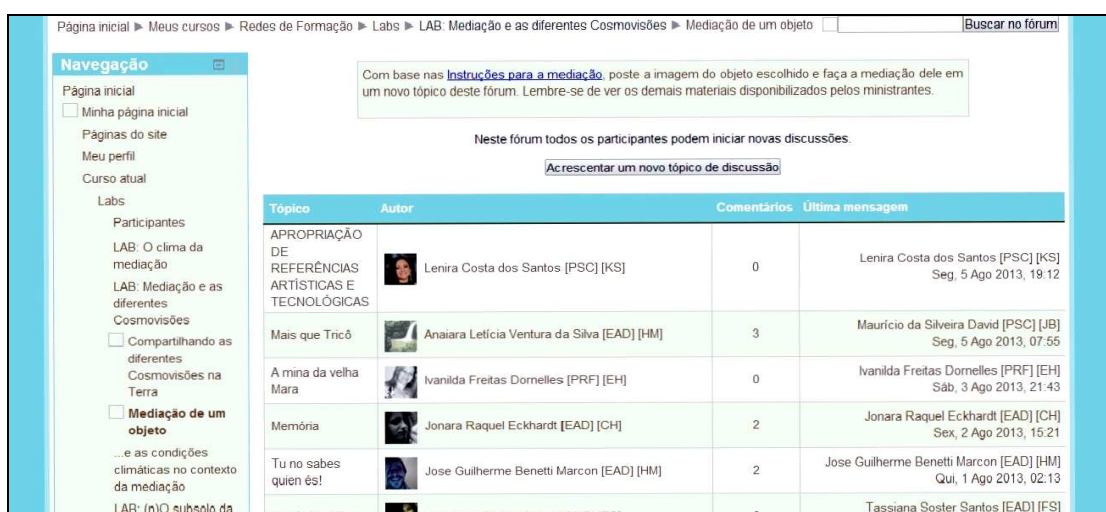
Figura 3- Fórum Mediação de um objeto do LAB Mediação e as diferentes Cosm visões .

Gabriela, me envolveste na tua escrita tanto quanto parece ter sido envolvida pelo encontro com teu amigo. A escrita é intensa. Muito bacana teu cuidado com as palavras e com a forma do texto (a tipografia que me lembrou os roteiros de cinema [...]) Relacionei isso à mediação, do quanto esses encontros nos movimentam. Para além de causar experiências, vivemos experiências muito profundas também.[...] Abraços. (por Helena Moschoutis [TUT] [MED] - quinta, 6 junho 2013, 17:39)