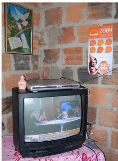
Figura 22 – Televisão e aparelho de DVD de Lucielen e Raquel