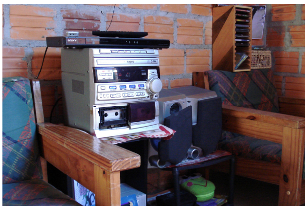
Figuras 24 e 25 – Televisão e aparelho de som de Rafaela