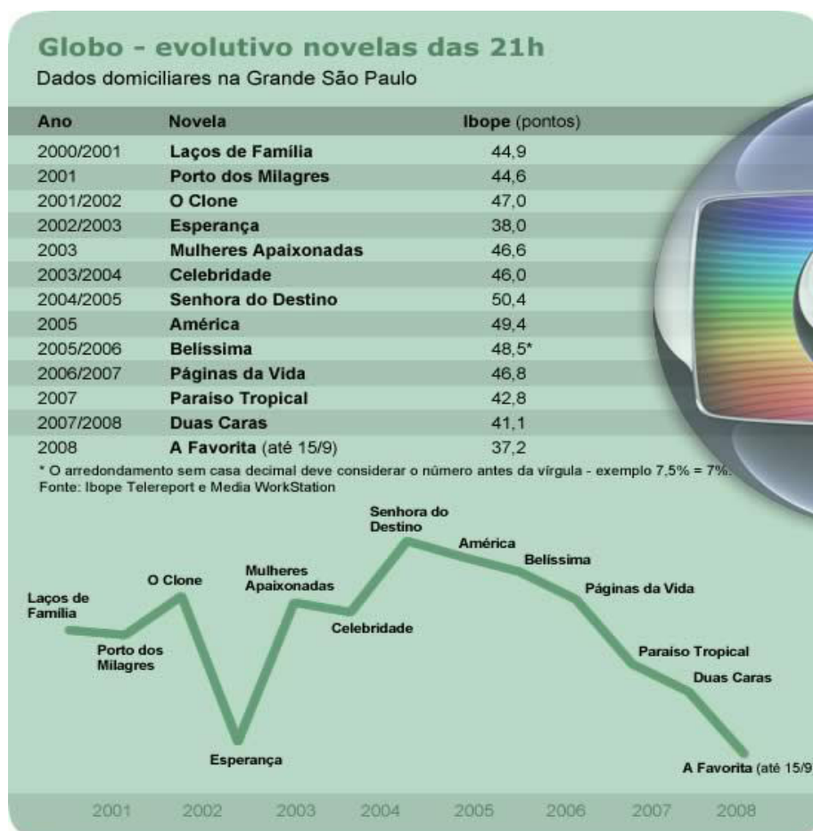
Figura 2 – Evolutivo da audiência da telenovela das 21h na década de 2000