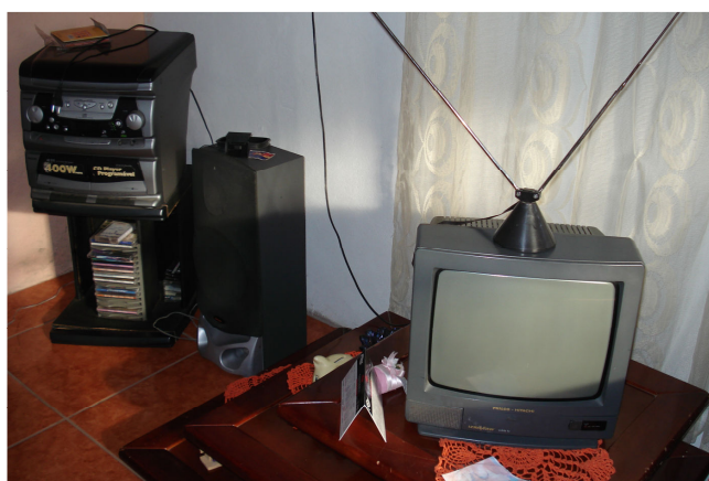
Figura 19 – Televisão e aparelho de som de Emanuele