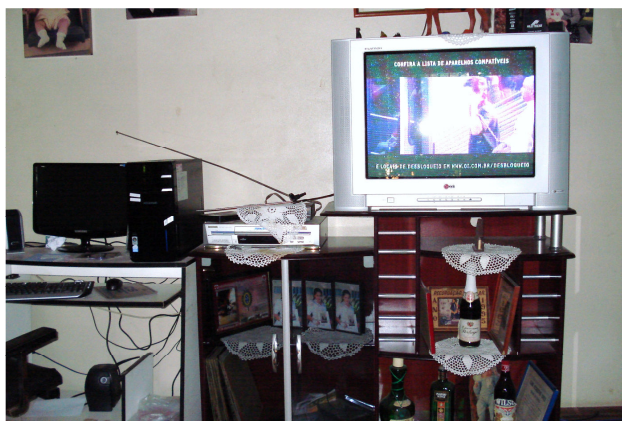
Figura 18 – Televisão, videocassete e computador da casa onde Cauane está morando