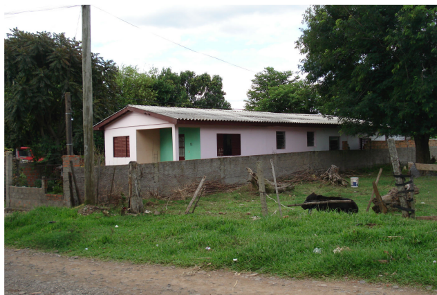
Figura 4 – Casa de Emanuele