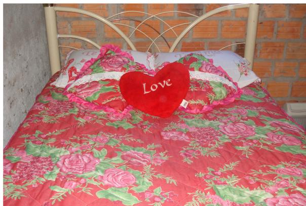
Figura 14 – Cama de Rafaela