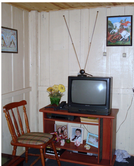
Figura 17 – Televisão e videocassete de Carol