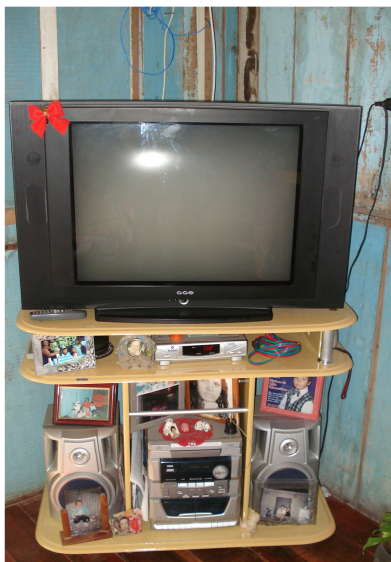
Figura 23 – Televisão e aparelho de som de Paola