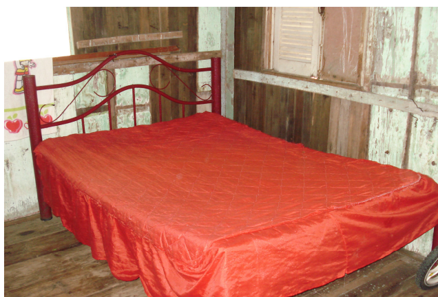
Figura 7 - Cama de Letícia